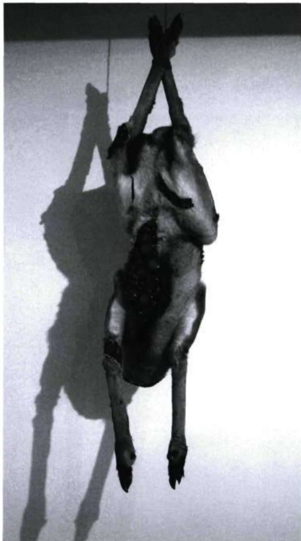
Angela Singer, W Button , 2007. Vieux cerf empaillé recyclé et matériaux divers.

Dans le second cas, en confrontant le public à des animaux mis en scène d'une certaine manière, le plus souvent des animaux morts, l'art joue un rôle de révélateur. Il brise l'hypocrisie ambiante, dévoile et révèle cette souffrance animale que les consommateurs et les industries mettent tant d'énergie à dissimuler. Le simple fait de présenter les animaux en trois dimensions, plutôt qu'en deux à l'écran, rend la confrontation plus forte et diminue la mise à distance, permettant ainsi au souci éthique de se développer. Le fait d'utiliser des animaux morts, qui n'ont plus d' anima , qui sont donc des objets, suscite la réflexion puisque les vivants sont précisément utilisés comme des objets. La démarche en tant que telle peut être comprise comme une dénonciation. Donnons plusieurs exemples.