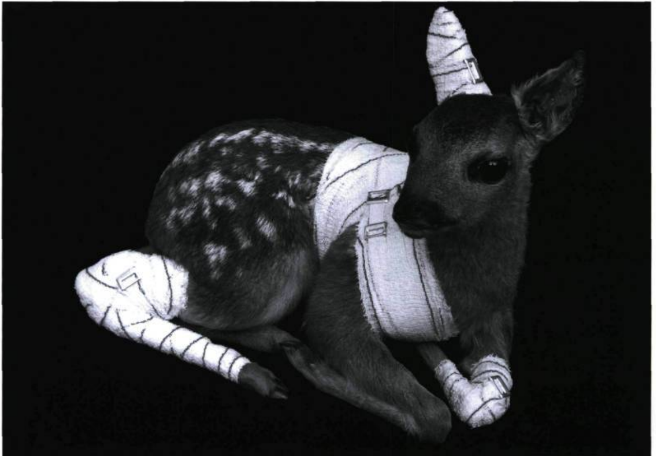
Pascal Bernier, Accidents de chasse (faon) , 1994. Faon naturalisé, bandages, acrylique. © < www.pascalbernier.com >, avec l'aimable autorisation de l'artiste.

La taxidermie traditionnelle dissimule le trauma : sur l'animal empaillé, pas de trace de la balle ou de la lame qui a tué. Dans une visée réaliste, on s'efforce de rendre l'animal comme il était avant sa mort, à ceci près qu'il est désormais immobile, vidé, figé, réifié par l'homme, qui symbolise ainsi sa domination – surtout dans le cas des trophées de chasse. La taxidermie sabotée ( botched taxidermy ) est une démarche artistique qui, pour dénoncer cette hypocrisie, détourne, décore et arrange les animaux empaillés de manière provocante, souvent pour mettre en évidence ce trauma qu'on a voulu cacher. W Button (2007) de Angela Singer, qui est à la fois artiste et militante pour les droits des animaux, représente les blessures sanguinolentes et les corps ouverts d'animaux empaillés recyclés. Dans le même esprit, Pascal Bernier dans ses Accidents de chasse (1994-2000) bande les blessures d'un gibier empaillé. Ses bandages réparent et guérissent de la mort. Les animaux ne sont plus des victimes, ni des trophées, mais des rescapés.