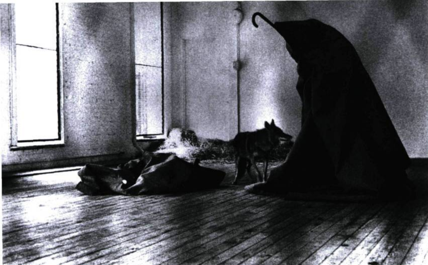
Joseph Beuys, I Like America and America Likes Me , mai 1974. Vidéo, action d'une semaine avec un coyote à la galerie René Block, à New York. © Caroline Tisdall, tirée du catalogue de l'exposition la Part de l'Autre , organisée par le Carré d'Art - Musée d'art contemporain, à Nîmes, Actes Sud/Carré d'Art, 2002, p. 126.

met en scène une éléphant indienne qui simule sa propre mort – l'année même où des militants se mobilisent contre la maltraitance d'une autre éléphant, Samba, violente pour avoir refusé d'exécuter ce même numéro pour le moins curieux.