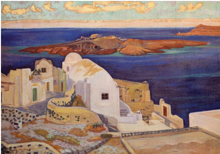
Σπύρος Παπαλουκάς, «Σαντορίνη», λάδι σε μουσαμά, 75x187 εκ., Εθνική Πινακοθήκη.