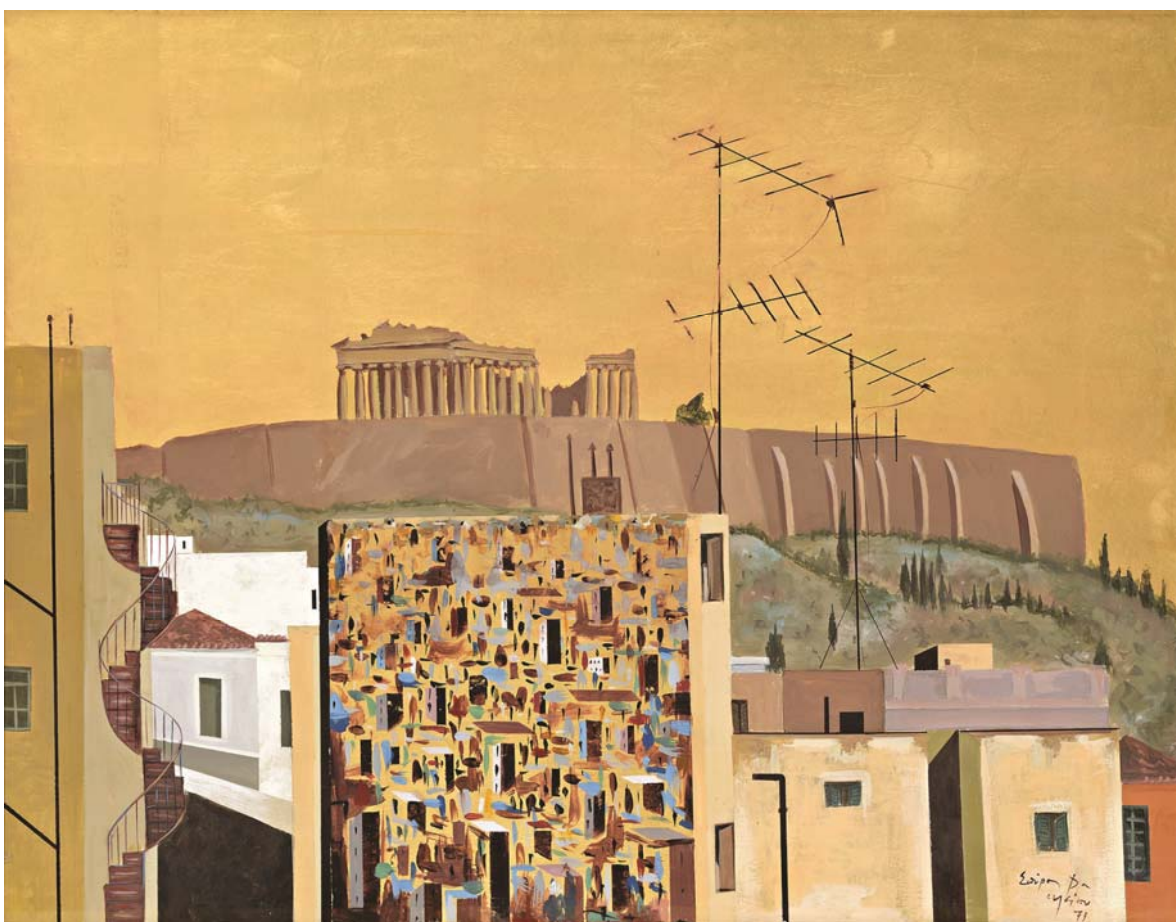
Σπύρος Βασιλείου, Ακρόπολη .

Σωτήρης Μητραλέξης (2015), Απελευθέρωση της Εκκλησίας από το Κράτος: Οι Σχέσεις Εκκλησίας – Κράτους και η μελλοντική μετεξέλιξή τους , Αθήνα: Manifesto, σελ.10-11.