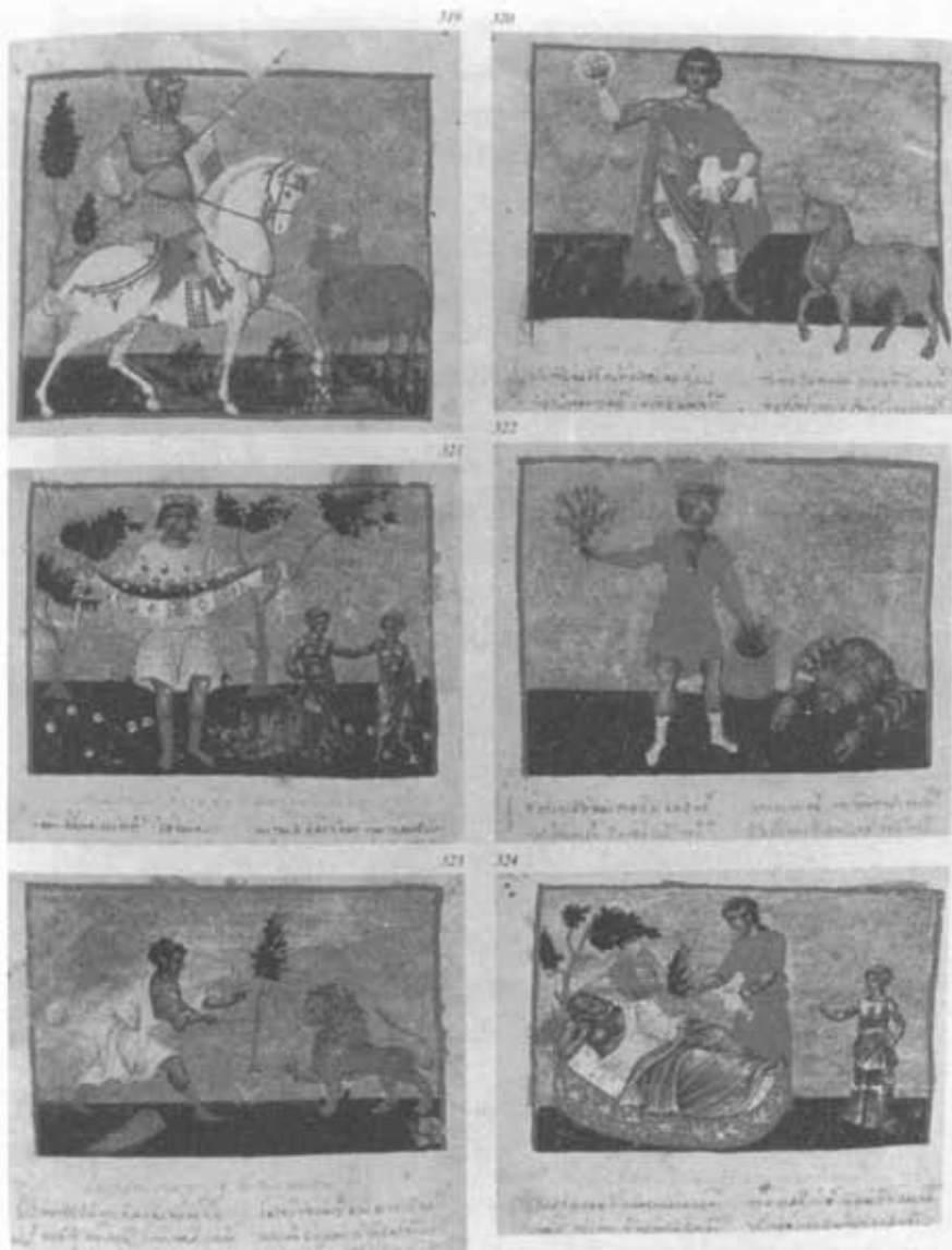
Εικ. 319. Ζώδιο Μάρτιου (καθ. 1199, σ. 193D) Εικ. 320. Ζώδιο Ἀπριλίου (καθ. 1199, σ. 179D) Εικ. 321. Ζώδιο Μαΐου (καθ. 1199, σ. 177D)