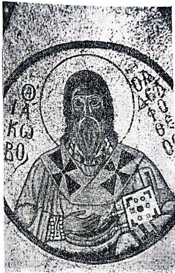
ΙΑΚΩΒΟΣ ὁ Ἀδελφόςθεος. Ψηφιδωτόν. Μονὴ Ὁσίου Λουκᾶ, Φωκίδος. ΙΑ' αἰών.

Ἐκ τοῦ βιβλίου τῶν Πράξεων δὲν φαίνεται πῶς ἐπραγματοποιήθη ἡ ἀνοδος τοῦ Ἰακώβου ἐντὸς τῆς ἐκκλησιαστικῆς Ἱεραρχίας. Ἐκ τῶν πληροφοριῶν τῶν Πράξεων, αἱ ὁποῖαι ἀσχολοῦνται κυρίως μετὰ τὸ Ἱεραποστολικὸν ἔργον τῆς ἀρχικῆς Ἐκκλησίας, ἐπικεφαλῆς τοῦ ἀποστολικοῦ ὀμίλου τῆς Ἱεραποστολῆς ἐν Παλαιστίνῃ ἀλλὰ καὶ τῆς μητρὸς τῶν Ἐκκλησιῶν φαίνεται ὅτι ἦτο ὁ Πέτρος μέχρι τῆς στιγμῆς, καθ' ἣν ὑπὸ τὴν ἀπειλὴν νέας συλλήψεως του ὑπὸ Ἀγρίππα Α' ἠναγκάσθη νὰ ἐγκαταλείψῃ τὰ Ἱεροσόλυμα καὶ πιθανῶς τὴν Παλαιστίνην (42 μ.Χ.), ὁπότε καὶ παραγγέλει «ἀπαγγεῖλατε Ἰακώβφ καὶ τοῖς ἀδελφοῖς ταῦτα» (Πράξ. ιβ' 17), ὅπερ σημαίνει ὅτι ὁ Ἰάκωβος ἦδη κατὰ τὸν χρόνον ἐκεῖνον κατέφεν ἠγετικὴν ἐν τῇ Ἐκκλησίᾳ θέσιν. Μετὰ ὅμως τὴν ἀναχώρησιν τοῦ Πέτρου «εἰς ἕτερον τόπον» τεκμηριοῦνται ἐξ ὅλων τῶν μαρτυριῶν ἡ ἀρχηγία τοῦ Ἰακώβου εἰς τὰ ζητήματα τῆς Μητρὸς τῶν Ἐκκλησιῶν. Κατὰ τὴν ἀποστολικὴν Σύνοδον