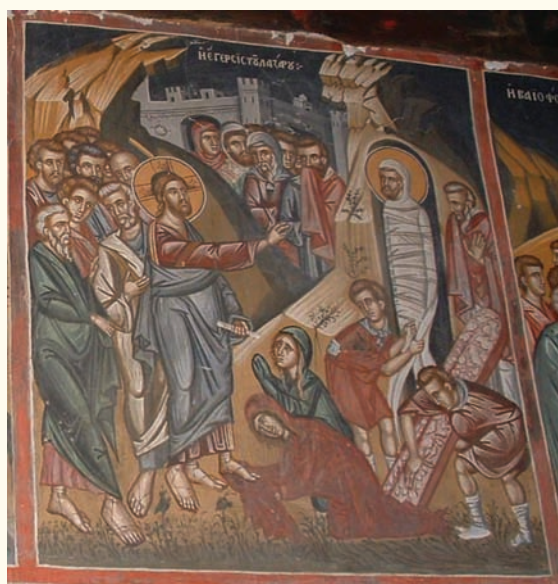
είκ.4. Η Έγερση τοῦ Λαζάρου.

στον Ἅγιο Νικόλαο στο Κλωνάρι καὶ στον Ἅγιο Μάμαντα στον Λουβαρά. Παρόμοια εἰκονογραφία παρουσιάζει ἡ σκηνὴ τῆς Βαϊοφόρου (είκ.5) μὲ τὴν ἀντίστοιχη στον Ἅγιο Νικόλαο στο Κλωνάρι. Ὁ ζωγράφος τοῦ Παλαιχωρίου ἀνανεώνει τὴν εἰκονογραφία τοῦ θέματος