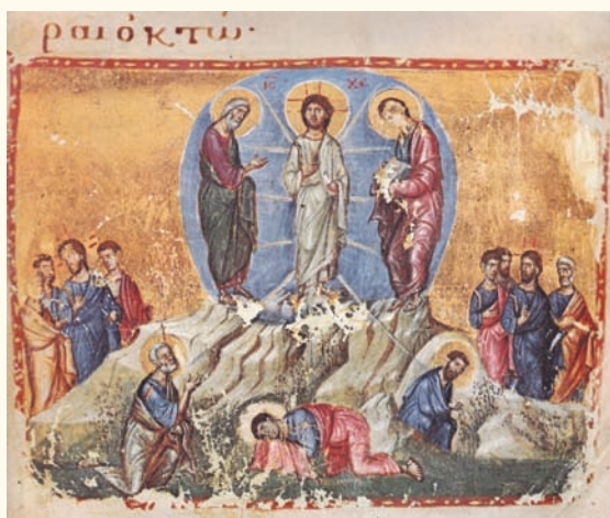
Είκ. 8. Άγιον Όρος, Μονή Ίβήρων Τετραεναγγελο κωδ. 5. 13 ος αιώνας.