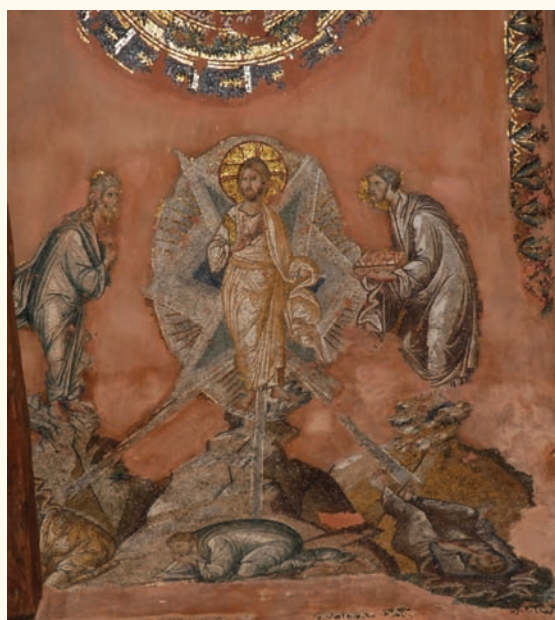
Εἰκ. 12. Ναὸς Ἁγίων Ἀποστόλων Θεσσαλονίκης. 1312-1315.

Μιὰ ἀκόμη εἰκονογραφικὴ λεπτομέρεια πού παρουσιάζει ἀλλαγὴ τὴν περίοδο αὐτή, εἶναι ἡ ἀπόδοση τοῦ ὄρους Θαβῶρ. Στὶς πρώιμες παραστάσεις τὸ ὄρος ἀπουσιάζει καὶ τὸ ἔδαφος ὑποδηλώνεται μὲ χρωματιστὲς λωρίδες, ὅπως στὸ ψηφιδωτὸ τοῦ Σινᾶ (εἰκ. 2) ἢ μὲ πράσινη χλόη, τὴν ὁποία κοσμοῦν ἄνθη, ὅπως στὴ Νέα Μονὴ Χίου (εἰκ. 3). Τὸ ὄρεινὸ τοπίο τοῦ Θαβῶρ ἀποδίδεται ἀπὸ τὸν 11ο αἰῶνα, ἀρχικά, μὲ μαλακὴ καμπύλη, ἐπάνω στὴν ὁποία πατᾶ ὁ Ἰησοῦς, ὅπως βλέπουμε στὸν κώδικα 1 (φ. 296β) τῆς Μονῆς Ἰβήρων (εἰκ. 4) 75 , στὴν Μονὴ Δαφνίου 76 κ.α. Ἦδη ἀπὸ τὴν μεσοβυζαντινὴν περίοδο, τὸ ὄρος σχηματοποιεῖται μὲ κλιμακωτοὺς βράχους, ὅπως σὲ εἰκόνα τοῦ