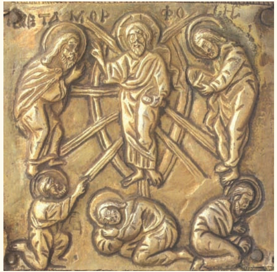
Είκ. 11. Πλαίσιο ἐπένδυσης εἰκόνας τῆς Παναγίας Ὁδηγήτριας (λεπτομέρεια). Μονὴ Βατοπαιδίου Ἁγίου Ὁρους. Ἀρχές τοῦ 14 ου αἰώνα.

παλαιολόγια περίοδο γίνεται κανόνας, ὅπως στὸ πλαίσιο ἐπένδυσης εἰκόνας τῆς Παναγίας Ὁδηγήτριας (εἰκ. 11) 44 κ.α. Ὁ Ίωάννης στὴ Νέα