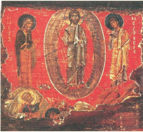
Είκ. 7. Αγία Πετρούπολη, Μουσείο Ερμιτάζ. Δεύτερο μισό 12ου αιώνα.

στην τοιχογραφία στον Άγιο Παντελεήμονα στο Νέρεξ 39 , ή μορφή του Ίωάννη στο κέντρο θυμίζει την αντίστοιχη του Πέτρου στο ψηφιδωτό της Μονής του Σινᾶ, ἐνῶ ὁ Ἰάκωβος δεξιά ἀποδίδεται μὲ μιὰ ἀσυνήθιστη ἡρεμία 40 . Σὲ εἰκόνα τῆς Μονῆς Ξενοφῶντος τοῦ Ἁγίου Ὁρους (τέλος 12ου αἰώνα) 41 , ὁ Μωυσῆς ἀποδίδεται ὡς γενειοφόρος μεσήλικας καὶ ὄχι ὡς ἀγένειος νεαρός, ὅπως κατὰ τὴ μεσοβυζαντινὴ περίοδο 42 . Ἀνάλογα ἀποδίδεται καὶ στοὺς Ἁγίους Ἀναργύρους Καστοριάς (γύρω στὰ 1180), στὸν Ἅγιο Γεώργιο στὸ Κουρμπίνοβο (1192) 43 , ἀπόδοση πού στὴν