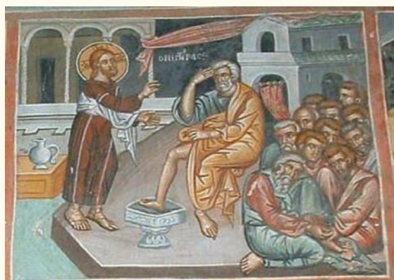
είκ. 8. Ο Νιπτήρ.

τόσημο τρόπο ο άσπασμος του Ιούδα, ή φρουρά καθώς επίσης το έπεισόδιο με τον Πέτρο που εικονίζεται σε αντίκλιση, να αναζητάει με τα μάτια τον Χριστό. Στον Έμπαυγμό (είκ.9), όπως στις αντίστοιχες σκηνές στον Λουβαρα και, στον Άγιασματή, ο Χριστός