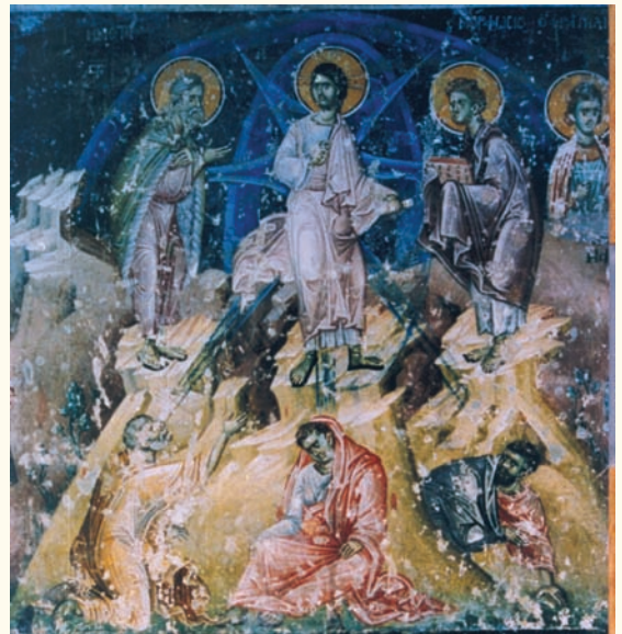
Εικ. 10. Ναός Αγίου Γεωργίου, Staro Nagoricino. 1317.

σχολιάζει ο καθηγητής Ε. Ν. Τσιγαρίδας, εικονίζεται σε στάση ανάλογη με του Ίωσήφ στη Γέννηση του Χριστού, όπως αναφέρεται από τον Νικόλαο Μεσαρίτη στην περιγραφή των ψηφιδωτών του ναού των Αγίων Αποστόλων της Κωνσταντινούπολης 35 , ενώ ανάλογη στάση παρουσιάζει ο Ιωάννης στην τοιχογραφία του ναού του Αγίου Γεωργίου στο Staro Nagoricino (1317) (εικ. 10).