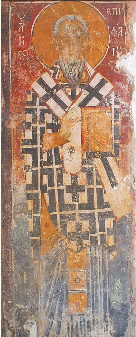
Ὁ ἅγιος Ἐπιφάνιος. Τοιχογραφία στὸν παλαιὸ ναὸ τοῦ Σωτῆρος, Σωτήρα Ἀμμοχώστου (13ος αἰ.).

τέστησε ἄλλο παλαιότερο. Σ' ἓνα ἀπὸ τὰ θωράκια ἀναγράφεται πιθανῶς ἡ χρονολογία τῆς διακόσμησης παρὰ ἡ κατασκευὴ του: «Ἐπὶ Μακαριωτάτου Κυρίου Κυρίου Μακαρίου 1857 Μαΐου α'». Ὁ αὐλεῖος χῶρος τοῦ ναοῦ ἀποτελεῖ τὸ παλαιὸ κοιμητήριον τοῦ χωριοῦ καὶ περιβάλλεται ἀπὸ ψηλὸ περιτοίχισμα.