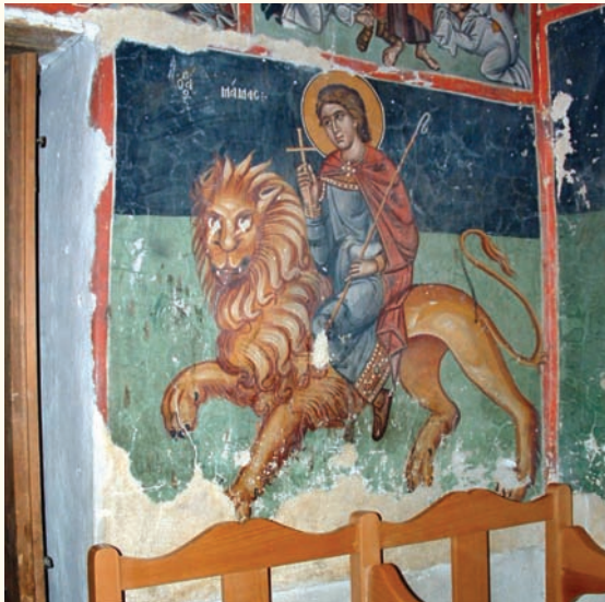
είκ. 17. Ο άγιος Μάμας.

στο δυτικό τοίχο του ναού και απαντώνται πολύ συχνά μαζί και σε άλλους ναούς της Κύπρου. Οί μικροδιαφορές που παρουσιάζονται έντοπίζονται κυρίως στην έλλειψη χώρου. Όπως διαφαίνεται από την απεικόνιση του αγίου Μάμαντος (είκ.17), πολιούχου Αγίου της