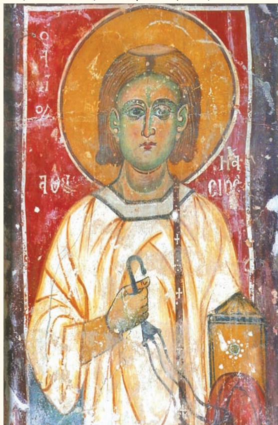
Ὁ ἅγιος Ἀθανάσιος ὁ Πεντασχοινίτης. Τοιχογραφία στὸν παλιὸ ναὸ τοῦ Σωτῆρος, Σωτήρα Ἀμμοχώστου (13ος αἰ.).

Τὸ καμπαναριὸ κτίστηκε τὸ 190 αἰῶνα, μετὰ ἀπὸ τὴν ἔκδοση ἀπὸ τὴν Ὑψηλὴ Πύλη τοῦ διατάγματος τοῦ Χάττι Χουμαγιούν, σύμφωνα μὲ τὸ ὁποῖο δίνονταν ὀρισμένα προνόμια στοὺς ραγιαδες μεταξύ των ὁποίων καὶ ἡ χρησιμοποίησι κωδῶνων στοὺς ναοὺς. Ὅταν λοιπὸν κτίστηκε τὸ καμπαναριὸ καὶ κρεμάστηκε ἡ καμπάνα, ἕνα μερόνυκτο τὴν κτυποῦσαν οἱ κάτοικοι χαρούμενοι. Περνώντας δὲ ἕνας Τοῦρκος «τσαούσης» καβάλα στὸ ἄλογο, ἐρχόμενος ἀπὸ τὸ Παραλίμι καὶ πηγαινόντας στὸ Λιοπέτρι, εἶπε στοὺς ἑορτάζοντας κατοίκους «Ἐ γκιαούρηδες, ἴντα πού