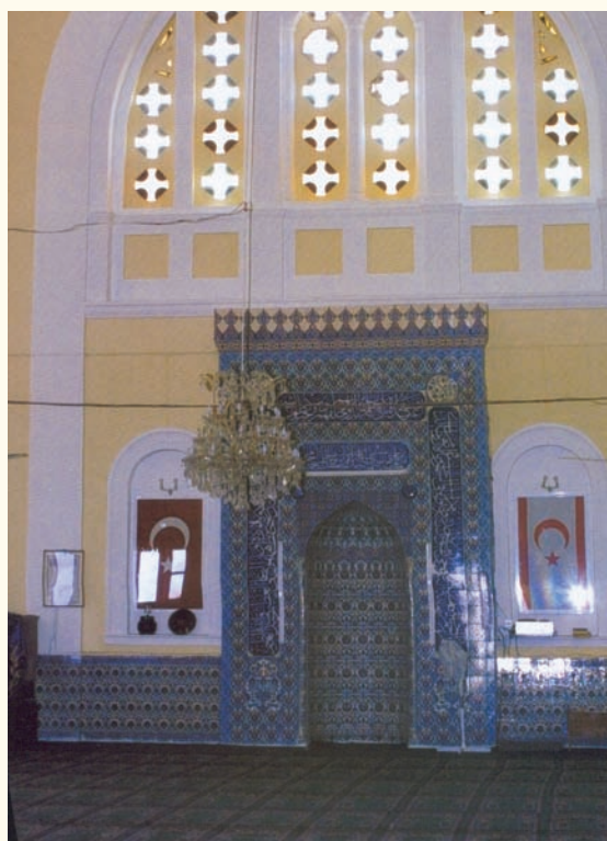
Τὸ ἐσωτερικὸ τοῦ ναοῦ ὅπως εἶναι σήμερα, μετὰ τὴ μετατροπὴ του σὲ μουσουλμανικὸ τέμενος.