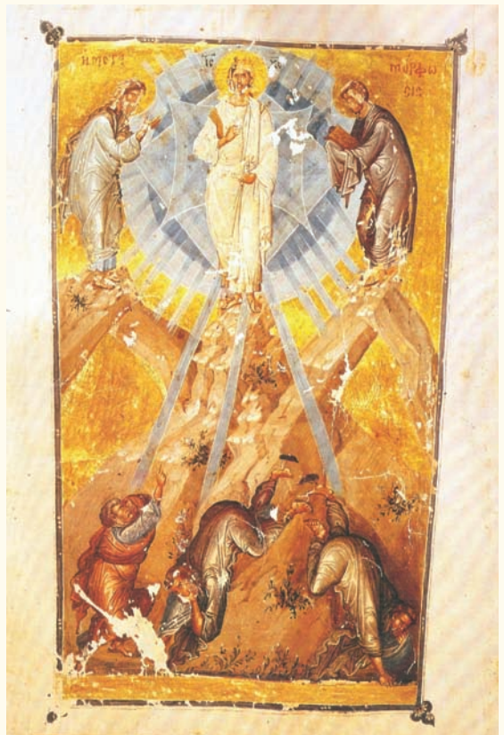
Εἰκ. 13. Παρισινὸς κώδικας gr. 1242, χειρόγραφο τοῦ Ἰωάννου ΣΤ Καντακουζηνοῦ. 1370-1375.

Ἀξιωμαθὲν εἶναι ἡ ἀπὸ τὸν 14ο αἰῶνα ἐπικρατοῦσα ἀπεικόνιση τοῦ Χριστοῦ μέσα σὲ δυὸ ἐπάλληλα τετράγωνα πὸν περικλείουν τὴν κυκλικὴ δόξα 62 , ὅπως τὴ συναντᾶμε στὴν μικρογραφία τοῦ χειρογράφου τοῦ Ἰωάννου ΣΤ Καντακουζηνοῦ, τοῦ 1370-1375 (Παρισινὸς κώδικας gr. 1242, ψαλμὸς 92, ἡ Μεταμόρφωση φ. 159ν) (εἰκ. 13) 63 , ἢ στὴ Μεταμόρφωση τῆς Περιβλέπτου στὸ Μυστρά (1360-1370) (εἰκ. 14) 64 . Τὰ δυὸ αὐτὰ γεωμετρικὰ σχήματα καὶ ἡ εἰκόνα τοῦ Χριστοῦ μέσα σ' αὐτὰ, εἰκονίζουσι συμβολικὰ τὴν Ἁγία Τριάδα: «Φῶς ἀναλλοίωτον Λόγε, φωτὸς Πατὴρ ἀγεννήτου, ἐν τῷ φανέντι φωτί σου, σήμερον ἐν Θαβωρίῳ, φῶς εἶδομεν τὸν Πατέρα, φῶς καὶ τὸ Πνεῦμα, φωταγωγοῦν πᾶσαν κτίσιν» 65 καὶ ὀφείλουσι στὴν ἐπίδραση τῶν Ἠσυχαστῶν καὶ τῆς διδασκαλίας τοῦ ἁγίου Γρηγορίου τοῦ Παλαμᾶ 66 , ἡ δὲ δόξα - νεφέλη ἀποτελεσε σύμβολο τοῦ Ἁγίου Πνεύματος 67 . Πρέπει βέβαια νὰ σημειώσουμε ὅτι δὲν παύει νὰ ὑφίσταται ἡ προηγούμενη μορφή τῆς δόξας μὲ τὸ ἔλλειψοειδὲς (σχῆμα ἀμυγδαλωτό, mandorla), τὸ κυκλικὸ σχῆμα χωρὶς τὰ σχήματα τῶν τετραγώνων, ἀλλὰ καὶ τὴν ἀπόδοσή της, ὅπως στὸ Πρωτάτο 68 , μὲ στόχο νὰ τονιστεῖ ἡ