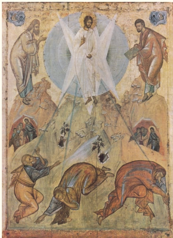
Εἰκ. 16. Μόσχα, Πανακοθήκη Tretiakov. Ἐργαστήριό τοῦ Θεοφάνη τοῦ Ἑλληνα. 1403.

Πατρὸς τὸ ἀπαύγασμα ». Συνεπῶς, σκοπὸς τῆς Μεταμόρφωσης, μεταξύ των ἄλλων, εἶναι νὰ προετοιμάσει τοὺς μαθητὲς γιὰ τὸν ἐπικείμενο θάνατο τοῦ Χριστοῦ, καὶ νὰ θυμηθοῦν ἐκείνη τὴν ὥρα ὅτι αὐτὸς εἶναι ὁ «ἀγαπητὸς Υἱὸς» καὶ ὅτι τὸ πάθος του εἶναι ἐκούσιο.