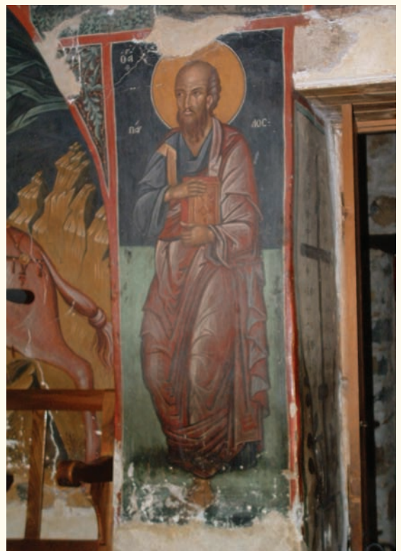
εἰκ. 15. Ὁ Ἀπόστολος Παῦλος.

Ὅμοιότητες μὲ ὡς πρὸς τὴν εἰκονογραφία καὶ τὴν τεχνοτροπία τοῦ Φιλίππου Γούλ ἐντοπίζονται ἐπίσης καὶ στὶς μορφές μεμονωμένων Ἁγίων, ὅπως λ.χ. στὴ μορφή τοῦ Ἀποστόλου Παύλου (εἰκ.15). Ὁ Ἅγιος πού ἀπεικονίζεται μὲ κυανοῦ χιτώνα καὶ ἐρυθρὸ ἱμάτιο νὰ κρατεῖ καὶ μὲ τὰ δύο του χέρια κλειστὸ Εὐαγγέλιο πα-