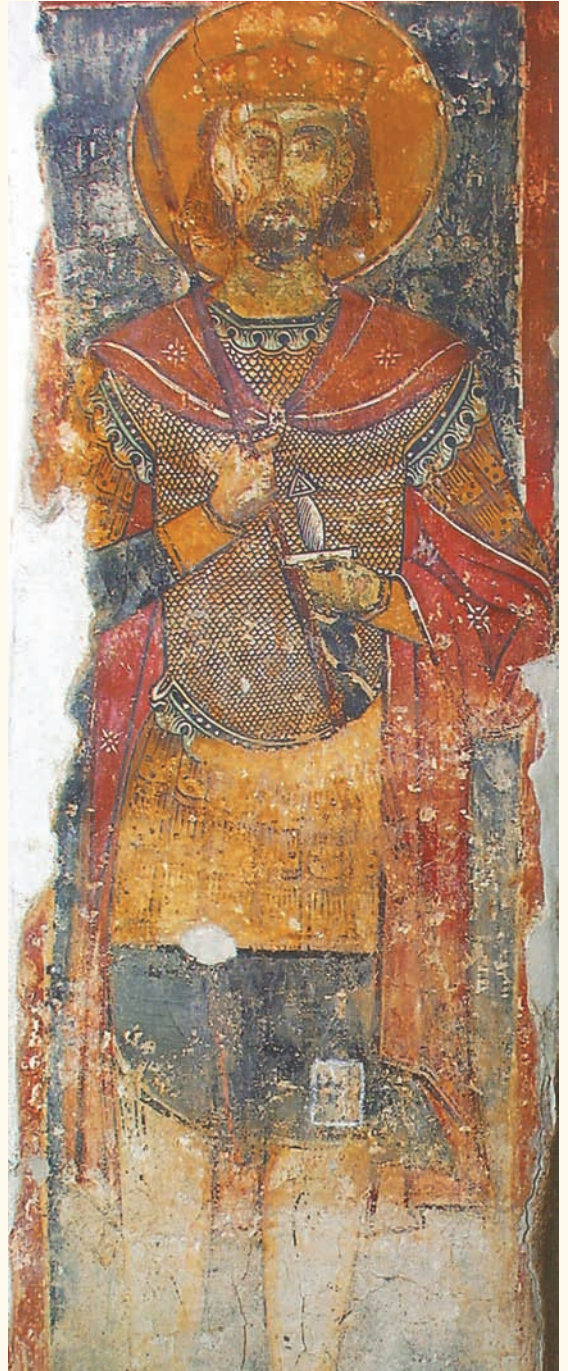
Ὁ ἅγιος Κωνσταντῖνος «ὁ τῆς Ὁρμυτίας» (τῆς Ὁρμίδειας). Τοιχογραφία στὸν παλαιὸ ναὸ τοῦ Σωτῆρος, Σωτήρα Ἀμμοχώστου (13ος αἰ.).