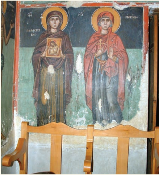
είκ. 16. Οι αγίες Παρασκευή και Μαρίνα.

ρουσιάζει πολλές ομοιότητες με την αντίστοιχη στον Λουβαρά, τόσο ως προς την έκφραση της μορφής του Αγίου, όσο και ως προς στην στάση του. Η έκφραση του Αγίου είναι παρόμοια και με την αντίστοιχη στον Άγιασματή. Αντίστοιχες εικονογραφικές και τεχνοτροπικές ομοιότητες παρουσιάζουν και οι αγίες Παρασκευή και Μαρίνα (είκ.16) που εικονίζονται