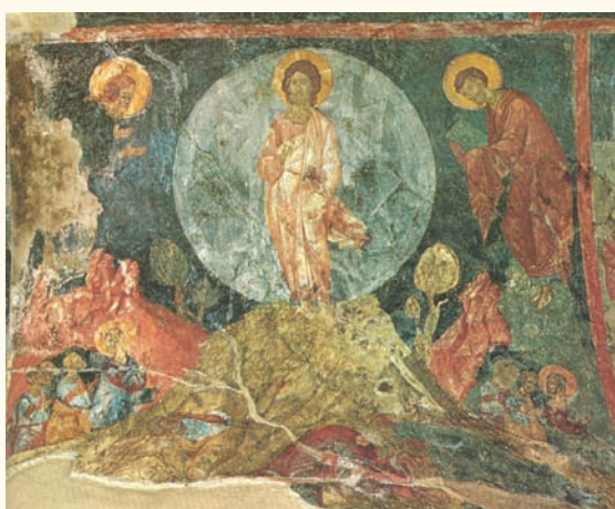
Είκ. 14. Μυστράς, Περίβλεπτος. Τρίτο τέταρτο 14 ου αιώνα.

ώστόσο πού παρουσιάζει ενδιαφέρον στην τοιχογραφία του Πρωτάτου είναι η επέκταση της έλλειφοειδοῦς δόξας του Ίησοῦ σε μεγαλύτερο ήμικύκλιο πού καλύπτει καί τους δύο προφῆτες. Τό στοιχείο αὐτό συναντᾶμε καί σε μεταγενέστερα μνημεῖα, ὅπως στὸν ναὸ τοῦ