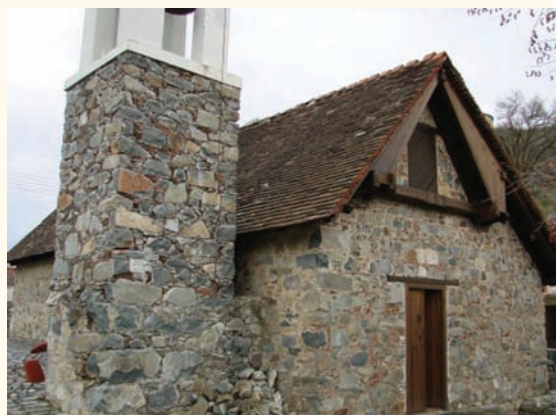
εἰκ. 1. Ἀποψη τοῦ ναοῦ τῆς Μεταμορφώσεως τοῦ Σωτῆρος στὸ Παλαιχώρι.

Ὁ ναὸς τῆς Μεταμορφώσεως (εἰκ.1), κτίζεται καὶ τοιχογραφεῖται κατὰ τὴ Βενετοκρατία, περίοδο κατὰ τὴν ὁποία τὸ Παλαιχώρι γνωρίζει μεγάλη ἀκμή, ἀφοῦ τότε ἀνεγείρονται καὶ τοιχογραφοῦνται τὰ περισσότερα θρησκευτικὰ του μνημεῖα.