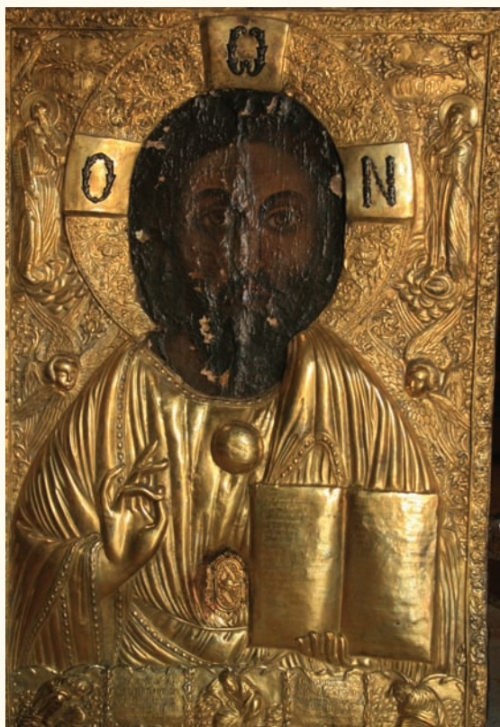
Ἡ εἰκόνα τοῦ Χρυσοσώτηρος Ἀκανθοῦ (πρόσφατη φωτογραφία)

καὶ τῶν ἁγίων Νικολάου καὶ Σπυρίδωνος, τοῦ ἁγίου Σάββα καὶ τῆς ἁγίας Ἄννας, ὅλες τοῦ 19ου αἰῶνα καὶ μιὰ εἰκόνα τοῦ ἁγίου Γεωργίου τῆς δεκαετίας τοῦ 1960 4 .