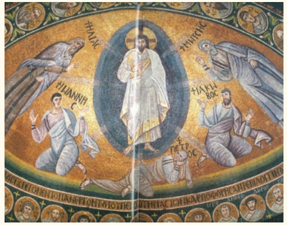
Εἰκ. 2. Καθολικὸ τῆς Μονῆς Σινᾶ. Μέσα τοῦ 6 ου αἰώνα.

δίσκου, μέσα σὲ χρυσὸ οὐρανὸ μὲ κόκκινα σύννεφα, πρὸς τὸν ὁποῖο δείχνει τὸ χέρι τοῦ Θεοῦ. Ὁ Μωυσῆς ἀριστερὰ καὶ ὁ Ἡλίας δεξιὰ, σὲ προτομῇ, ἀναδύονται μέσα ἀπὸ τὰ σύννεφα. Πιὸ κάτω οἱ ἀπόστολοι Πέτρος ἀριστερὰ καὶ Ἰωάννης καὶ Ἰάκωβος δεξιὰ, εἰκονίζονται σὰν τρία λευκὰ πρόβατα στὶς πλευρὲς τοῦ λόφου. Ἡ συγκεκριμένη περίπτωση ἀλληγορικῆς παράστασης τῆς Μεταμόρφωσης, ἀπὸ ὅσο γνωρίζουμε, εἶναι μοναδική.