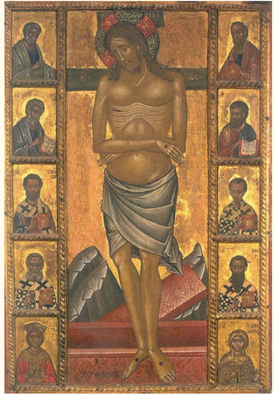
είκ. 18. Η Άκρα Ταπείωση, εικόνα στο Μουσείο Παλαιχωρίου που προέρχεται από το ναό της Παναγίας Χρυσοπαντάνας στο ίδιο χωριό.

Τη σχέση του Φίλιππου Γούλ με το Παλαιχώρι υποδεικνύει μία εικόνα Άκρας Ταπείωσης (είκ.18) στο Μουσείο Παλαιχωρίου που προέρχεται από το ναό της Χρυσοπαντάνας