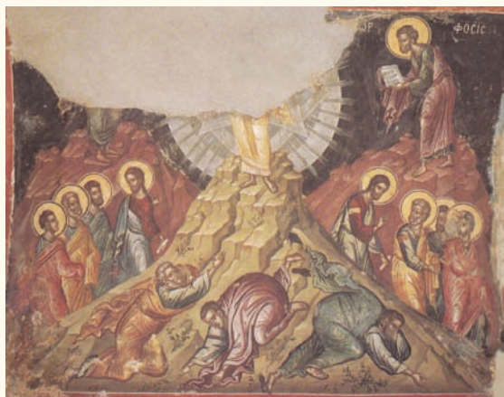
Είκ. 15. Άγιον Όρος, Μονή Σταυρονικήτα. 1545/6.

μικρές αποκλίσεις αποδίδεται ή σκηνή σε εικόνα (τρίπτυχο) του Βυζαντινού Μουσείου της Αθήνας (άρχες 17ου αιώνα) 97 . Το ίδιο συμβαίνει και σε άλλες μορφές τέχνης 98 .