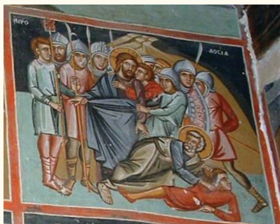
είκ. 9. Η Προδοσία.

τόσημο τρόπο ο άσπασμος του Ιούδα, ή φρουρά καθώς επίσης το έπεισόδιο με τον Πέτρο που εικονίζεται σε αντίκλιση, να αναζητάει με τα μάτια τον Χριστό. Στον Έμπαυγμό (είκ.9), όπως στις αντίστοιχες σκηνές στον Λουβαρα και, στον Άγιασματή, ο Χριστός