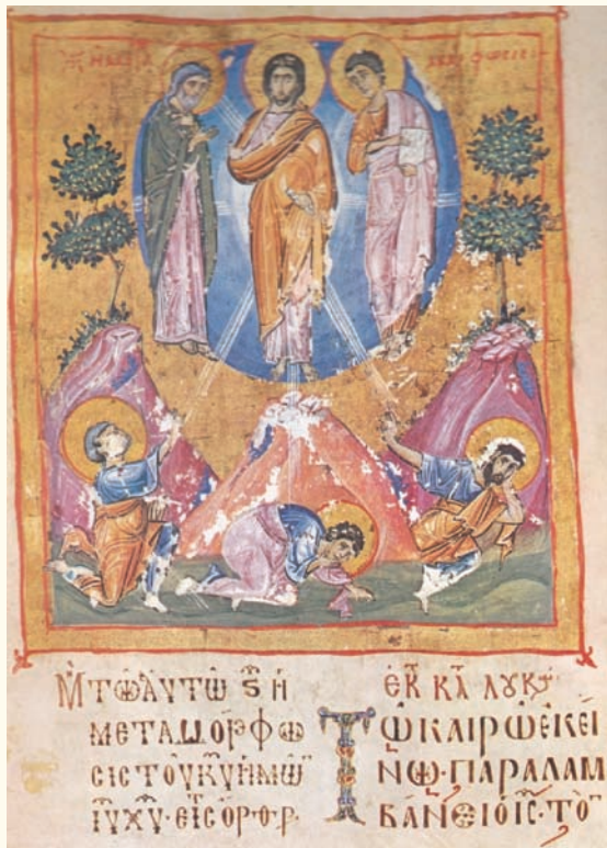
Εικ. 4. Κώδικας 1 (φ. 2966), Μονή Ίβήρων. 11 ος αιώνας.

σπάνια στάση του Ίακώβου, ο οποίος κλείνει το άρτί του, γεγονός που παραπέμπει στον φόβο των μαθητών από τη φωνή του Θεού και όχι από την παρουσία της νεφέλης 32 . Όμοια στάση παρουσιάζει ο Ίακώβος στο παρεκκλήσιο του Αγίου Νικολάου της Λαύρας (1560) 33 . Συνηθισμένη είναι και η πρηνής στάση του Ιωάννη στο κέντρο της παράστασης, στη Νέα Μονή της Χίου, ενώ σε εικόνα του τέλους του 12ου αιώνα στην Μονή Ξενοφώντος του Αγίου Όρους παρουσιάζει σπάνια στάση για την εικονογραφία του 34 . Ο απόστολος, όπως