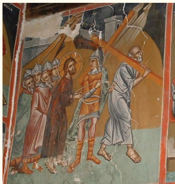
είκ.10. Έλκόμενος επί Σταυρού.

τριγυρίζεται από πλήθος Ιουδαίων που τον χλευάζουν ήχώντας βούκινα και άλλα μουσικά όργανα. Παρόμοια εικονογραφία με τον Λουβαρα και τον Άγιασματή παρουσιάζει ή σκηνή του Έλκομένου (είκ.10) με τον Σίμωνα στα δεξιά να μεταφέρει το σταυρό και να ακολουθείται από τον Ιησού που έλκεται από Ρωμαίο