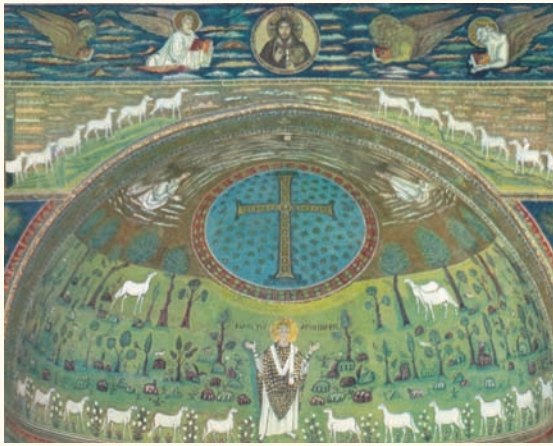
Εἰκ. 1. Ραβέννα, Ἅγιος Ἀπολλινάριος In Classe . Μέσα τοῦ 6 ου αἰώνα.