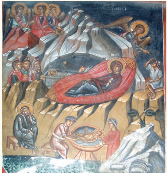
εἰκ. 3. Ἡ Γέννηση τοῦ Χριστοῦ.

Στὴν καλλιτεχνικὴ παραγωγή τοῦ Συμεὼν Ἀξέντη πού ὑπογράφει τὶς τοιχογραφίες τοῦ Ἁγίου Σωζομένου τὸ 1513 καὶ τῆς Θεοτόκου καὶ Ἁγίας Παρασκευῆς τὸ 1514 στὸ χωριὸ Γαλάτα ἐντοπιζοῦνται πολλὲς ὁμοιότητες μὲ τὶς τοιχογραφίες τοῦ Παλαιχωρίου: Σκηνὲς ὅπως ἡ Γέννηση τοῦ Χριστοῦ (εἰκ.3) πού παρουσιάζει