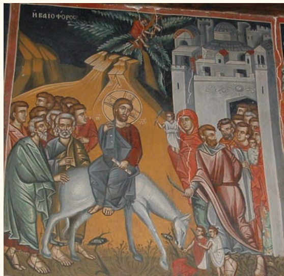
είκ. 5. Ἡ Βαϊοφόρος.

στον Ἅγιο Νικόλαο στο Κλωνάρι καὶ στον Ἅγιο Μάμαντα στον Λουβαρά. Παρόμοια εἰκονογραφία παρουσιάζει ἡ σκηνὴ τῆς Βαϊοφόρου (είκ.5) μὲ τὴν ἀντίστοιχη στον Ἅγιο Νικόλαο στο Κλωνάρι. Ὁ ζωγράφος τοῦ Παλαιχωρίου ἀνανεώνει τὴν εἰκονογραφία τοῦ θέματος