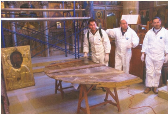
Ἔργασίες ἀπεντόμωσης εἰκόνων στὸν ἱερό ναὸ Ἁγίου Μάμαντος Μόρφου. Διακρίνεται ἀριστερὰ ἡ εἰκόνα τοῦ Χρυσοσώτηρος.

Ὁ Ἐπίτροπος ὅταν ἔφτασε στὸ χωριὸ ἀνάφερε τὸ γεγονός στους συγχωριανούς του καὶ τότε σχηματίστηκαν ὁμάδες καὶ βγήκαν σ' ἀναζήτηση τοῦ ζῶου καὶ τῆς εἰκόνας. Τελικὰ βρέθηκε τὸ ζῶο νεκρὸ μέσα σὲ ἕνα δάμνο σχοινιαῖς δίπλα στὰ ἐρείπια τῆς ἐκκλησιᾶς τοῦ διαλυθέντος συνοικισμοῦ τῆς Μελίσσας. Ἀπὸ τότε θεωρήθηκε ἱερὴ ἡ σχοινιά ἐκείνη καὶ κανένας δὲν ἤθελε καὶ δὲν τολμούσε νὰ κόψει ἕνα κλαδάκι». Στὸ χῶρο τῆς σχοινιαῖς στήθηκε πέτρινος στύλος ὕψους μισοῦ μέτρου, πάνω στὸν ὁποῖο ἀνάβαν οἱ Χριστιανοὶ μιὰ καντήλα.