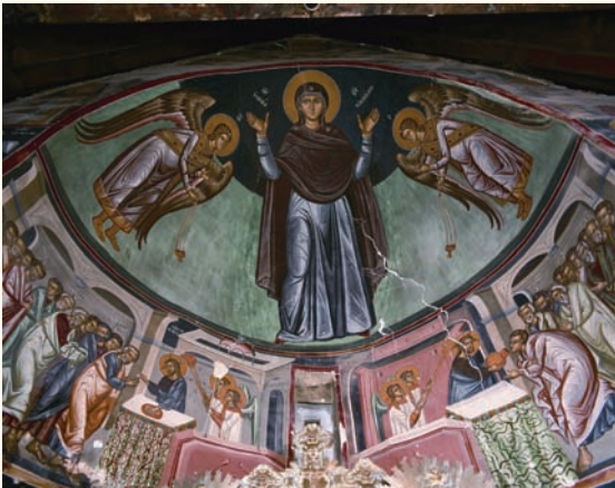
εἰκ. 2. Ἡ σύνθεση τῆς Θεοτόκου ὡς Κυρίας τῶν Ἀγγέλων, στὸ τεταρτοσφαίριο τῆς ἀψίδας τοῦ ἱεροῦ θήματος καὶ ἡ Κοινωνία καὶ ἡ Μετάληψη τῶν Ἀποστόλων στὸν ἡμικύλιον τῆς ἀψίδας (ἀρχές 16ου αἰ.).

Ἡ σύνθεση τῆς Θεοτόκου ὡς Κυρίας τῶν Ἀγγέλων (εἰκ.2), στὸ τεταρτοσφαίριο τῆς ἀψίδας, παρουσιάζει τὴ Θεοτόκο ὄρθια χωρὶς τὸ Βρέφος, μὲ τὰ χέρια ὑψωμένα σὲ στάση δέησης ἀνάμεσα στοὺς σεβίζοντες Ἀρχαγγέλους Μιχαὴλ καὶ Γαβριήλ, δέμα πού παρουσιάζεται μὲ πολλὲς ὁμοιότητες στὸ ναὸ τοῦ Ἁγίου Μάμαντος στὸν Λουβαρὰ (1495) καὶ στὸ ναὸ τοῦ Ἁγίου Νικολάου στὴ Γαλαταριά.