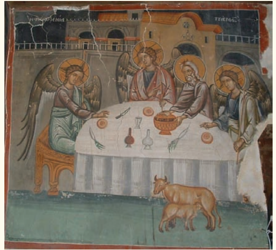
εἰκ. 14. Ἡ Φιλοξενία τοῦ Ἀβραάμ.

τὴν ἀπόδοση τῶν Ἀγγέλων, ὅσο καὶ τῆς τράπεζας πού ἀπεικονίζεται μὲ τὴν ἴδια προοπτική.