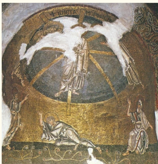
Εικ. 3. Νέα Μονή Χίου. 1042-1056.

την παλαιότερη παράδοση, ἐνῶ συνήθως, στὶς μεταγενέστερες παραστάσεις, μόνο ὁ Χριστὸς ἀποδίδεται μέσα στὴ δόξα. Διαφοροποίηση παρατηρεῖται καὶ στὶς στάσεις τῶν μαθητῶν. Ὁ Πέτρος ἀποδίδεται ἀριστερά, σχεδὸν ὄρθιος κρατώντας σταυρό. Στὴ μέση εἰκονίζεται ὁ Ἰωάννης πρηνὴς νὰ βλέπει πρὸς τὰ κάτω, καὶ ὁ Ἰάκωβος δεξιά, καδισμένος, στηρίζεται μὲ τὸ ἀριστερὸ χέρι. Ἡ θέση τοῦ Πέτρου εἶναι κοινὴ σὲ ὅλες σχεδὸν τὶς παλαιὲς παραστάσεις, καθὼς συνήθως ἀποδίδεται ὄρθιος ἢ σὲ γονυκλισία, ὅπως στὸν κώδικα Paris. gr. 54 τοῦ 13ου αἰώνα 24 . Ἡ διαφορὰ τῆς ἀπεικονίσεως στὸν παρισινὸ κώδικα εἶναι ὅτι ὁ μὲν Πέτρος ἀπομονώνεται, ἐνῶ ὁ Ἰάκωβος καὶ ὁ Ἰωάννης