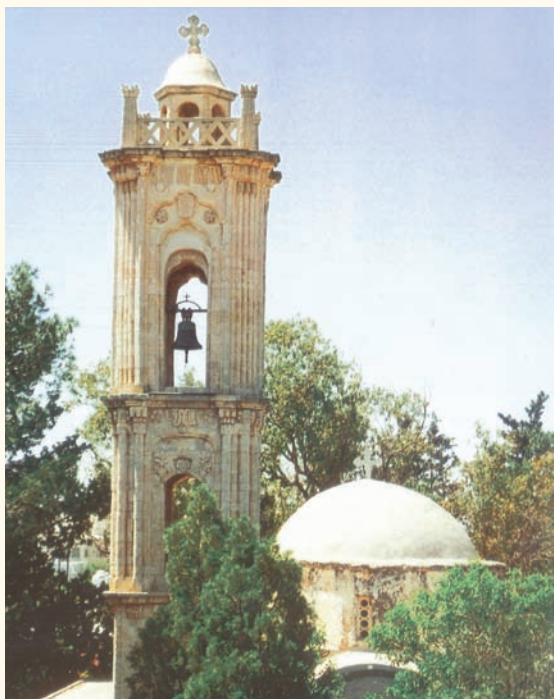
Ὁ ἀρχαῖος ναὸς τῆς Μεταμορφώσεως τοῦ Σωτῆρος, Σωτήρα Ἀμμοχώστου (13 ος , 16 ος , 19 ος αἰ.).

Ὁ ἀρχαῖος ναὸς τοῦ Σωτῆρος (13 ος αἰ.) 1 Ὁ ναὸς τῆς Μεταμορφώσεως τοῦ Σωτῆρος, ὁ ὁποῖος εἶναι γνωστὸς καὶ ὡς Χρυσοσώτη- ρος, ἔχει δώσει τὸ ὄνομά του καὶ στὸν οἰκισμό. Ὁ ναὸς εἶναι κτισμένος στὴ θέση παλαιοχρι-