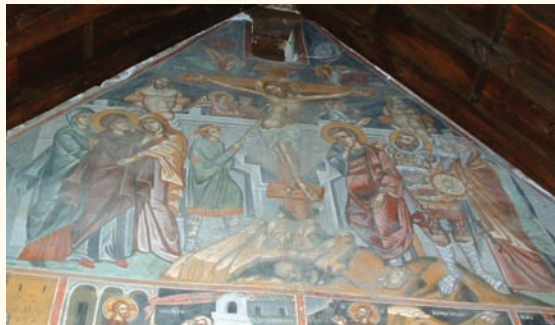
είκ. 6. Ἡ Σταύρωση.

Οἱ τοιχογραφίες στο Παλαιχώρι παρουσιάζουν ἀρκετὲς εἰκονογραφικὲς καὶ τεχνοτροπικὲς ὁμοιότητες μὲ τὰ ἔργα τοῦ Φιλίππου Γουλ ποὺ ἐκτέλεσε σύμφωνα μὲ τὶς κτητορικὲς ἐπιγραφὲς τὸ 1494 τὶς τοιχογραφίες στον Τίμιο Σταυρὸ τοῦ Ἀγιασμάτων καὶ τὸ 1495 στον Ἅγιο Μάμαντα στον Λουβαρά. Σὲ σκηνὲς ὅπως ἡ Σταύρωση (είκ.6), ἀκολουθοῦνται κοινοὶ εἰκονογραφικοὶ τύποι στὴν ἀπόδοση τοῦ