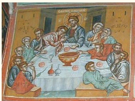
είκ.7. Ο Μυστικός Δείπνος.