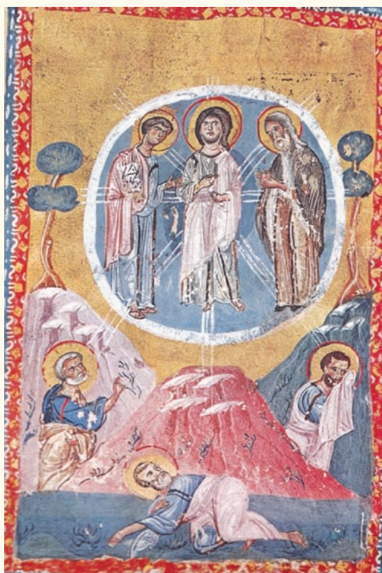
Εἰκ. 6. Εὐαγγελιστάριο. Κώδικας 2 Μονῆς Παντελεήμονος. 12ος αἰώνας.

Ὁ εἰκονογραφικὸς τύπος τῆς Μεταμόρφωσης, ὅπως διαμορφώνεται στὶς παραπάνω παραστάσεις εἶναι ὁ ἀπλός, καθόσον λείπουν τὰ δύο συμπληρωματικὰ ἐπεισόδια, τῆς ἀνάβασης καὶ τῆς κατάβασης τῆς ομάδας τοῦ Χριστοῦ καὶ τῶν μαθητῶν του ἀπὸ τὸ ὄρος Θαβώρ, ἐπεισόδια γνωστὰ ἀπὸ τὶς εὐαγγελικὲς διηγήσεις 46 . Ὁ Γκιολὲς ἀναφέρει ὅτι τὰ ἐπεισόδια αὐτὰ προστίθενται στὴν παράσταση τῆς Μεταμόρφωσης κατὰ τὴ μεσοβυζαντινὴ ἐποχὴ 47 . Μεταγενέστερα παραδείγματα ἀποτελοῦν τὸ Τετραεὺς κώδ. 5 (φ. 269β) τῆς Μονῆς Ἰβήρων τοῦ Ἁγίου Ὄρους (13ος αἰώνας) (εἰκ. 8) 48 , ὁ Λαυρεντιανὸς κώδικας I 23, φ. 34 καὶ 79 49 κ.ἄ. Ὁ σύνδετος αὐτὸς εἰκονογραφικὸς τύπος, πὺν προσδίδει ἀρηγηματικὸ χαρακτήρα στὴ σκηνή, διαδίδεται στοὺς παλαιολόγειους χρόνους, ὅπως στὴν τοιχογραφία στὴν Gracanica (1318-1321) 50 , στὴν Μονὴ Χιλανδαρίου (1321-1322) 51 , στὴν Παναγία Περίβλεπτο (1360-1370) (εἰκ. 14) 52 , στὴν Παντάνασσα (1430) 53 τοῦ Μυστρά καὶ σὲ πολλὰ ἄλλα παραδείγματα κατὰ τὴ μεταβυ-