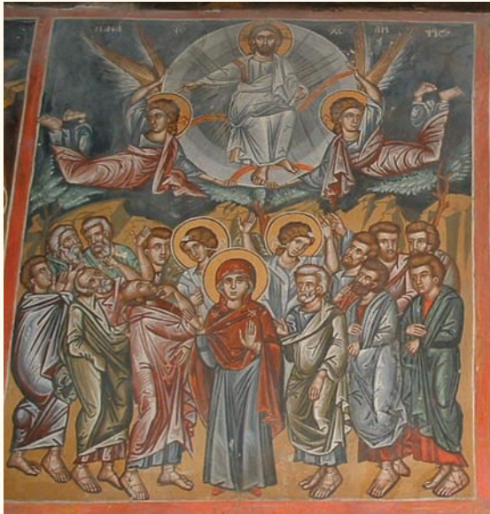
εἰκ. 12. Ἡ Ἀνάληψις.

σμάτη. Χαρακτηριστική είναι η απόδοση τῆς Θεοτόκου πού κρατεῖ τὸ κεφάλι τοῦ νεκροῦ Χριστοῦ καὶ τοῦ ἄγονου τοπίου μὲ τοὺς βραχῶδεις λόφους πού συγκλίνουν πρὸς τὸν σταυρὸ πού εὐρίσκεται ἀνάμεσά τους. Μοναδική διαφορά ἀνάμεσα στὶς δύο σκηνές παρουσιάζει ἡ στάση τῆς Μαρίας Μαγδαληνῆς. Μὲ παρόμοιο τρόπο ἀπεικονίζονται οἱ σκηνές τῆς Ἀνάληψης (εἰκ.12) καὶ τῆς Πεντηκοστής