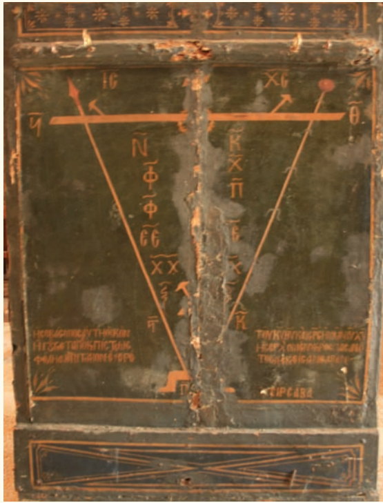
Τό πίσω μέρος της εικόνας Χρυσοσώτηρος Άκανθους

Παλλάδιο και κάυχημα της Άκανθους είναι ή θαυματουργή εικόνα του Χρυσοσώτηρος, ή