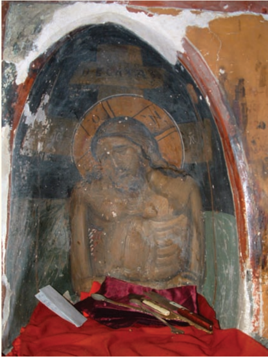
είκ. 19. Ἡ Ἄκρα Ταπείνωση, τοιχογραφία στήν κόγχη τῆς Προθέσεως τοῦ ναοῦ τῆς Μεταμορφώσεως τοῦ Σωτῆρος Παλαιχωρίου (ἀρχές 16ου αἰ.).

νολογία. Ἀπό τὰ στοιχεῖα καί τίς συγκρίσεις πού ἔχουν παρατεθεῖ πιστεύω ὅτι εἶναι καταφανεῖς οἱ σχέσεις τῶν τοιχογραφιῶν τοῦ ναοῦ τῆς Μεταμορφώσεως τοῦ Σωτῆρος στό Παλαιχώρι μέ ἐκεῖνες τοῦ Φίλιππου Γοῦλ στόν Ἁγισμάτη (1494) καί στόν Λουβαρά (1495).