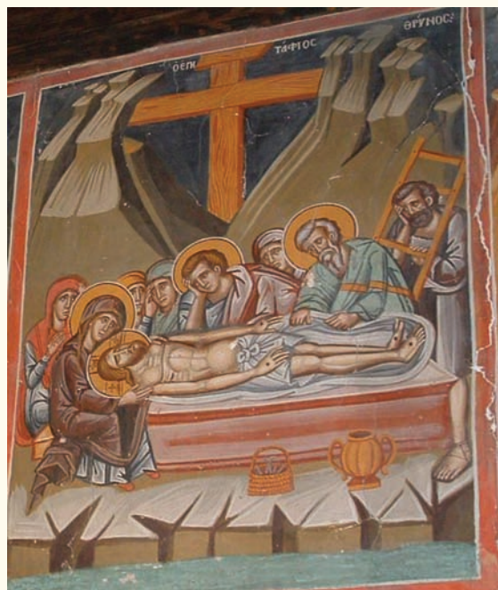
είκ. 11. Ο Έπιτάφιος Θρήνος.

στρατιώτη. Μεγάλη είναι επίσης ή όμοιότητα στην εικονογραφία καθώς επίσης και στην τεχνοτροπική απόδοση του Έπιταφίου Θρήνου (είκ.11) με την αντίστοιχη σκηνή στον Άγια-