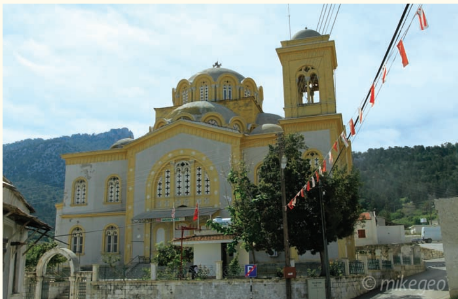
Ἱερὸς Ναὸς Χρυσοσώτηρος Ἀκανθοῦς (πρόσφατη φωτογραφία)