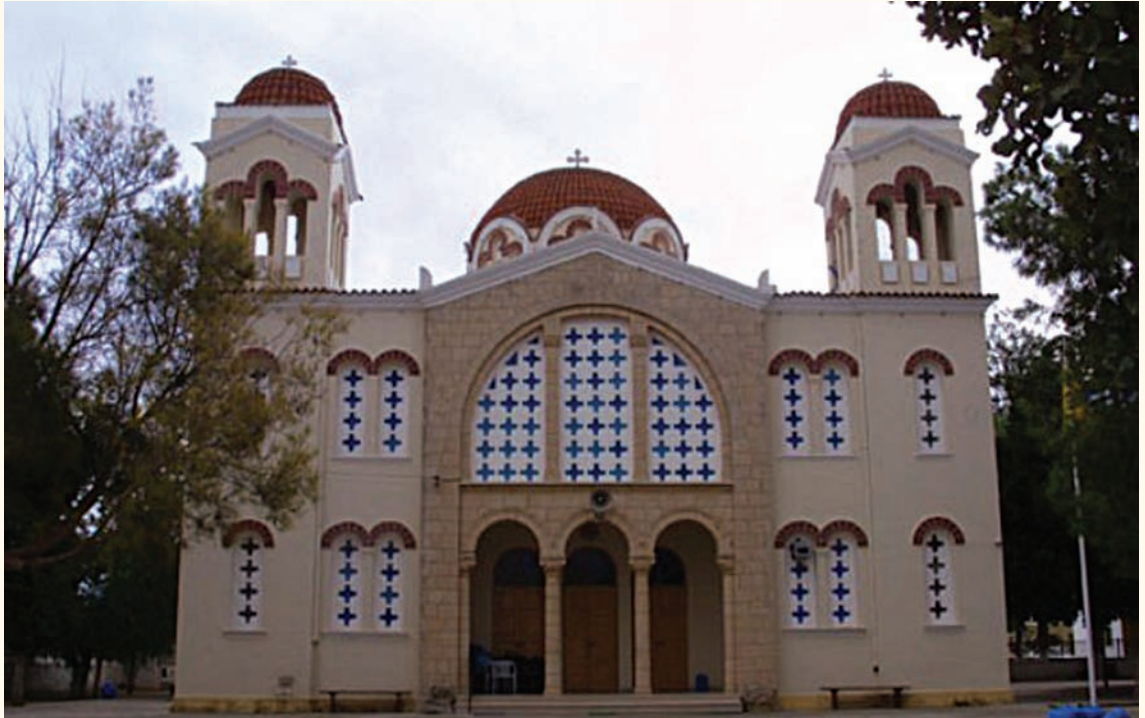
Ὁ νέος ναὸς τῆς Μεταμορφώσεως τοῦ Σωτῆρος, Σωτήρα Ἀμμοχώστου (1939).

6 Αὐγούστου, ἑορτὴ τῆς Μεταμορφώσεως τοῦ Σωτῆρος καὶ τὴν Κυριακὴ των Βαΐων, τῆς Ἑλιᾶς ὅπως εἶναι γνωστὴ στὴν Κύπρο. Ἡ δεύ- τερη πανήγυρη γινόταν πρὶν τὴν τουρκικὴ εἰσβολὴ στὸν ἱερό ναὸ τοῦ ἁγίου Μέμνονος στὴν Ἀμμόχωστο, ἀπ' ὅπου καὶ μεταφέρθηκε προσωρινὰ στὴ Σωτήρα.