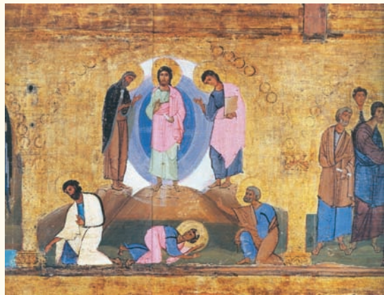
Εικ. 5. Ἐπιστύλιο μὲ σκηνὲς Δωδεκαῶρτου. Σινᾶ, Μονὴ Ἁγίας Αἰκατερίνης. Πρῶτο μισὸ 12ου αἰώνα.

ἀποτελοῦν μία ὁμάδα. Οἱ ἀρχαιότερες καὶ οἱ σύγχρονες πρὸς τὸ παρισινὸ κώδικα παραστάσεις (Paris) 25 παρουσιάζουν κάθε ἀπόστολο μεμονωμένο. Ἄλλοτε ὁ Ἰάκωβος ἱστορεῖται στὸ μέσο 26 καὶ ὁ Ἰωάννης δεξιά 27 ἢ ὁ Ἰάκωβος ἀριστερά (εἰκ. 5) 28 . Ὅμως ἡ