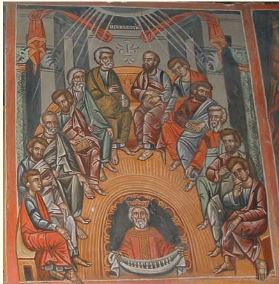
εἰκ. 13. Ἡ Πεντηκοστή.

(εἰκ.13) μὲ ἐκεῖνες στὰ μνημεῖα τοῦ Φιλίππου Γούλ. Στὴν σκηνή τῆς Φιλοξενίας τοῦ Ἀβραάμ (εἰκ.14) παρὰ τὰ διαφορετικὰ ἀρχιτεκτονήματα τοῦ βάδους ἀκολουθεῖται ἀνάλογη εἰκονογραφία ὅπως στὸν Λουβάρά, τόσο ὡς πρὸς