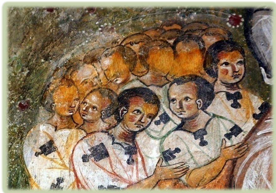
7. Bachovo, Βουλγαρία. Λεπτομέρεια από τοιχογραφία του ΙΘ' αι.

Η συζήτηση αυτή πάντως δεν φαίνεται να έχει επηρεάσει για την ώρα την άσκηση ποιμαντικής από την Εκκλησία μας η οποία, ανάλογα και με τη διάκριση του κάθε πνευματικού, στέκεται πολύ αυστηρά απέναντι στη γυναίκα η οποία θα προσφύγει στους κόλπους της ύστερα από μια τέτοια πράξη, στερώντας της τη μετοχή στη Θεία Κοινωνία για χρόνια.