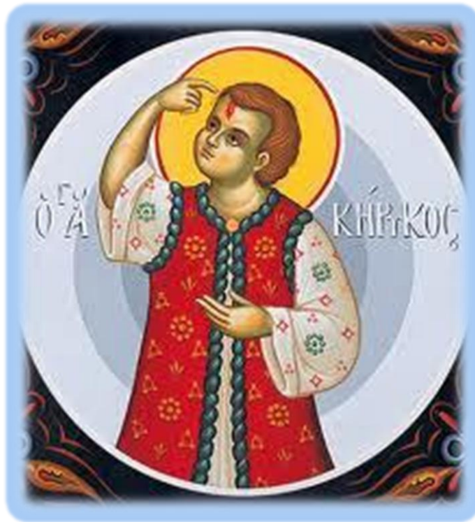
6. Ο Άγιος Κήρυκος

Στο βιβλίο της Ε΄ τάξεως του Δημοτικού Σχολείου έχουν επιλεγεί από το πλήθος των μικρών μαρτύρων ως παράδειγμα για τα σύγχρονα παιδιά, κάτω