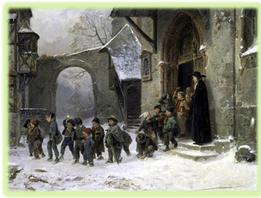
8. B. Vautier . Παιδιά που σχολάνε. 1850.

άρχισε να οργανώνεται γύρω από το παιδί και να απομακρύνεται από την κοινότητα, χαράσσοντας οριστικά την έννοια της σύγχρονης οικογένειας. Η σχέση μαθητείας αντικαταστάθηκε από το σχολείο, το οποίο ανέλαβε την ευθύνη να οδηγήσει το παιδί στην ωριμότητα και στην ηθικότητα. Αντί για την αυτονομία την οποία επιδιώκει σταδιακά στον άνθρωπο η γνώση, το παιδί εισέπραξε την πειθαρχία στην εξουσία της πυρηνικής οικογένειας και το σχολικό εγκλεισμό. Η ιστορία της παιδικής ηλικίας χαρακτηρίζεται επομένως από την αύξηση της ανελευθερίας, τον κοινωνικό αποκλεισμό και την προφύλαξη του παιδιού από τους ενηλίκους 309 .