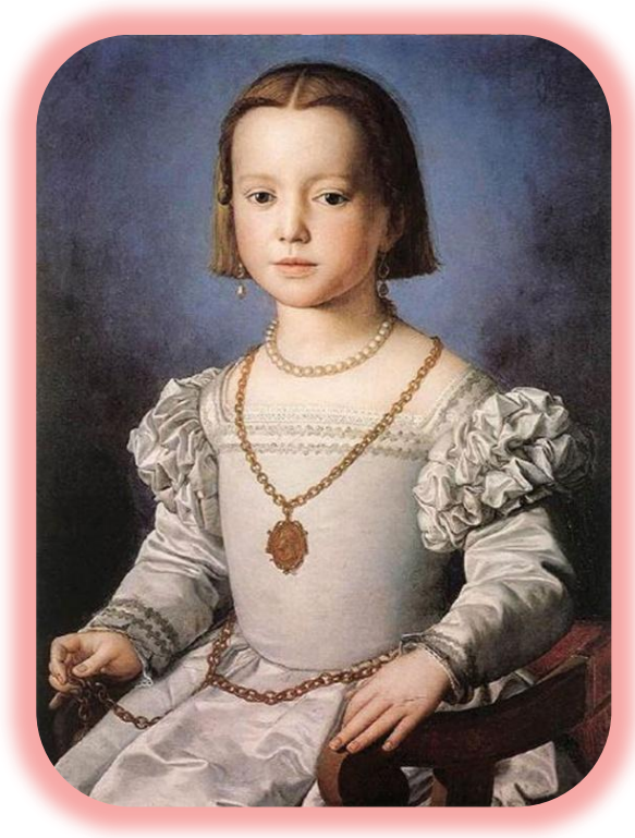
10. Bia. Angolo Brongino 16ος αιώνας.

• Αντίδραση αντιστροφής 315 . Η αντίδραση αυτή πηγαιίνει παράλληλα με την πρώτη. Ο ενήλικος δεν ζητάει να εισπράξει από το παιδί, σε συναισθηματικό πάντα επίπεδο, ό,τι το παιδί έχει να του δώσει, αλλά στο πρόσωπο του παιδιού ζητά να βιώσει τη σχέση που είχε ο ίδιος με τους γονείς του, ή κάποιο άλλο σημαντικό γι' αυτόν πρόσωπο. Έτσι εξηγεί ο Ντεμόζ την ένδυση των παιδιών ως ενηλίκων, καθώς και την παρηγοριά την οποία δίνει ένα παιδί σ' έναν ενήλικο σε μια δύσκολη στιγμή.