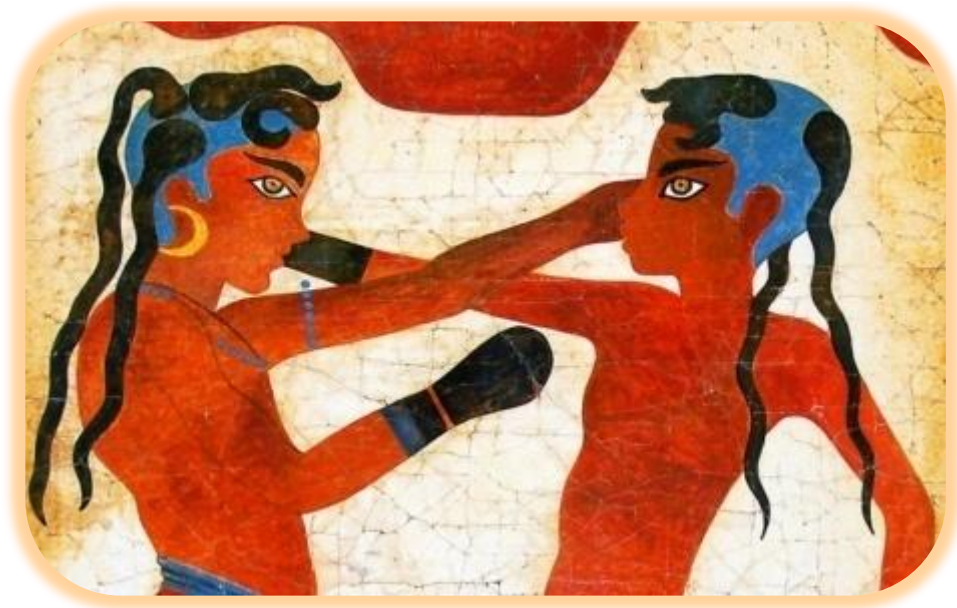
1. Οι Πυγμάχοι: Τοιχογραφία από το Ακρωτήρι.

ασκήσει πολιτική υπέρ των γεννήσεων. Η γέννηση ενός παιδιού συνδεόταν περισσότερο με τη διαίωσιση του οίκου . Έτσι, αυτός ο οποίος θιγόταν από τη διακοπή της κυήσεως και μπορούσε να προσφύγει ακόμα και στα δικαστήρια ήταν ο πατέρας, είτε, σε περίπτωση θανάτου του πατέρα, κάποιος συγγενής του.