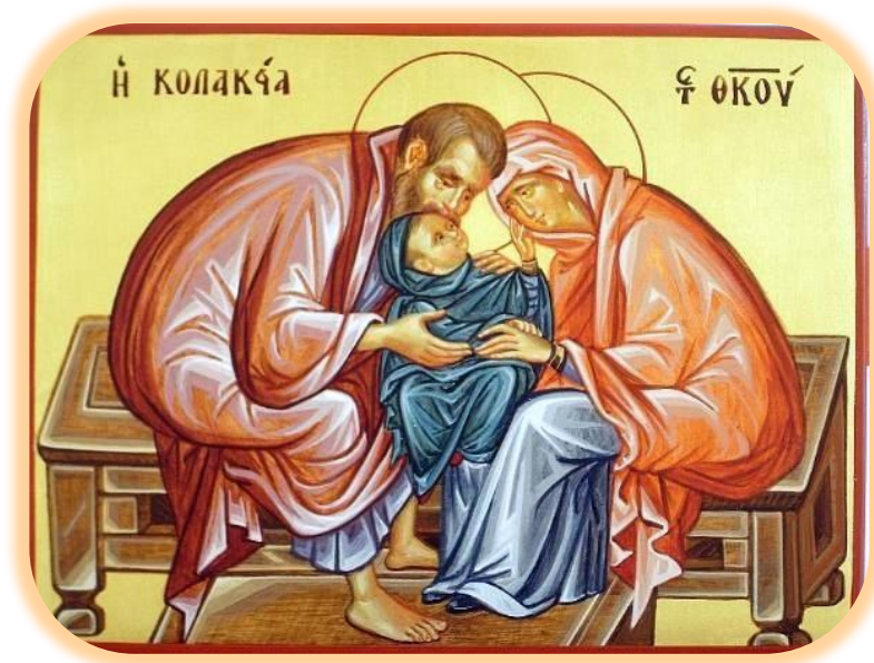
3. Η Κολακεία της Θεοτόκου: Δια χειρός Γκόρντανα Ραντόγιεβιτς.

συμπλήρωνε σαράντα μέρες ζωής, λεγόταν πρωτότοκο 71 , είτε είχε αδέρφια είτε όχι. Σε περίπτωση που γεννιόνταν δίδυμα φρόντιζαν να ξεχωρίσουν το βρέφος το οποίο είχε εξέλθει πρώτο, δένοντας στο χέρι του μια κόκκινη κλωστή, πράγμα το οποίο σήμερα γνωρίζουμε ότι είναι εν μέρει λάθος, καθώς το νωρίτερα συλληφθέν βρέφος εξέρχεται δεύτερο. Πάντως, στην περίπτωση του Ησαΐ και του Ιακώβ (Γεν. 25, 21-26) τελικά πήρε ο Ιακώβ τα πρωτοτόκια της οικογένειας, αν και εξήλθε δεύτερος .