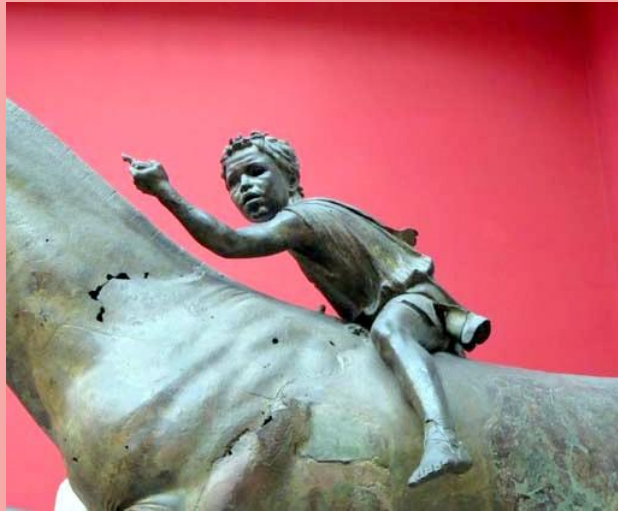
2. Ο Αναβάτης του Αρτεμισίου. Εθνικό Αρχαιολογικό Μουσείο Αθηνών.

1.1.2. Το παιδί στη ρωμαϊκή Δύση. Στη Δύση η φροντίδα των παιδιών, διέφευγε από τα καθήκοντα της Ρωμαίας κυρίας, μόλις το παιδί περνούσε τη βρεφική του ηλικία 54 . Η πλούσια γυναίκα το εναπόθετε στα χέρια ενός διακεκριμένου παιδαγωγού, τον οποίο μπορούσε να αγοράσει, πιστεύοντας ότι είχε εκπληρώσει το καθήκον της απέναντί του, εφ' όσον είχε περιβάλλει αυτή την οριστική εκλογή με τις επιβαλλόμενες προφυλάξεις και τις έγκυρες συμβουλές. Οι φτωχοί πάλι, ήταν ελεύθεροι να στείλουν τα παιδιά τους σ' ένα από τα ιδιωτικά σχολεία τα οποία είχαν ανοίξει διάφοροι διδάσκαλοι και τα οποία, στη Ρώμη τουλάχιστον, αφθονούσαν.