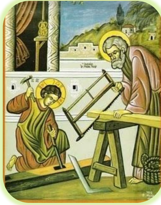
4. Ο Μικρός Ιησούς: Χειρ Θ. Μοναχής, 1998.

εθελοντικής υπακοής του Ιησού και της χειρωνακτικής εργασίας η οποία ακολούθησε έως την δημόσια επανεμφάνισή του.