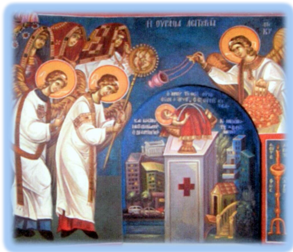
12. Η Ουράνια Λειτουργία: Από τοιχογραφία στον Ιερό Ναό Κοιμήσεως της Θεοτόκου στο Καπανδρίτι. Γ. Βαρθαλίτης, 2007.