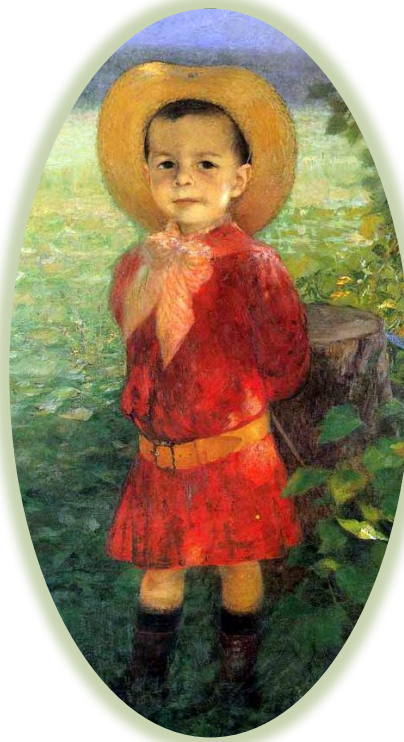
10. Γ. Ιακωβίδης, 19 ος αι. Ο γιος του καλλιτέχνη.

Οι τρεις αυτές μεγάλες αφηγήσεις πρόσφεραν στους ανθρώπους την αισιοδοξία και την ελπίδα ότι οι αγώνες για την ελευθερία θα απόφεραν καρπούς και ότι η επόμενη γενιά θα ζούσαν σ' έναν ειρηνικό κόσμο, έναν επίγειο παράδεισο. Με άλλα λόγια και οι τρεις αυτές κοσμοθεωρίες στηρίχτηκαν σε μια φαντασίωση, η οποία, τοποθετώντας συνεχώς την εκπλήρωση των προσδοκιών τους στο μέλλον, κούρασε τους ανθρώπους και τους ώθησε ν' ανακαλύψουν νέες διόδους επικοινωνίας με την πραγματικότητα και νέους τρόπους ερμηνείας της.