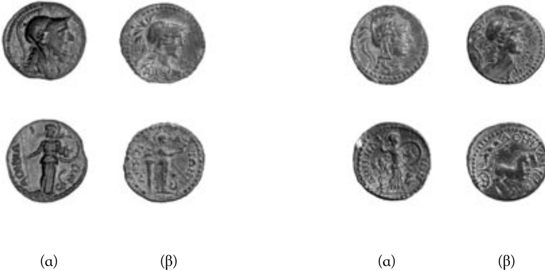
Εικ. 13 (α). Δραχμή, 264-267 μ.Χ. Νομισματικό Μουσείο, Συλλογή Εμπεδοκλή. (β). Δραχμή, 264-267 μ.Χ. Νομισματικό Μουσείο, αρ. ευρ. 1894-5 Η' 2745