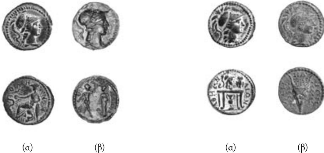
Εικ. 15 (α). Δραχμή, 264-267 μ.Χ. Νομισματικό Μουσείο, Συλλογή Εμπεδοκλή. (β). Δραχμή, 264-267 μ.Χ. Νομισματικό Μουσείο, αρ. ευρ. 1902-3 ΚΒ' 138