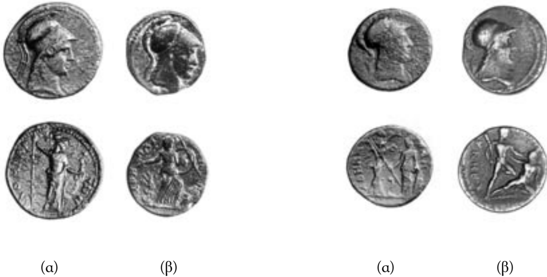
Εικ. 9 (α). Δραχμή, 150-175 μ.Χ. Alpha Bank, αρ. ευρ. 1843. (β). Δραχμή, 150-175 μ.Χ. Alpha Bank, αρ. ευρ. 4481