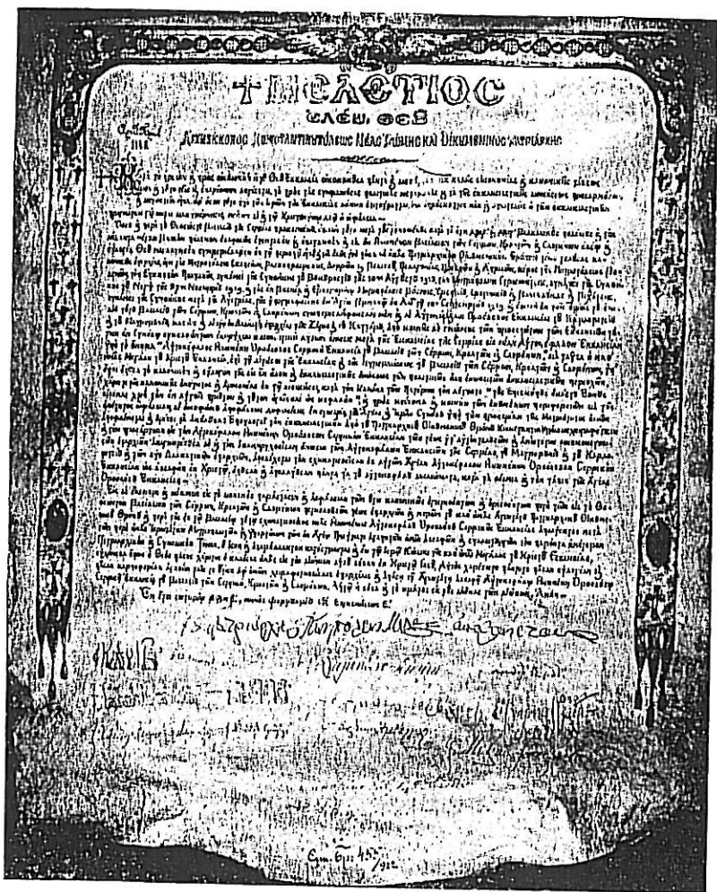
Εἰκ. 1. Ὁ Πατριαρχικός καὶ Συνοδικὸς Τόμος τοῦ 1922 περὶ τῆς κανονικῆς χειραφετήσεως τῶν μητροπόλεων τῆς Βορείου Μακεδονίας

σωπίας τοῦ Οἰκουμενικοῦ Θρόνου μὲ ἐπὶ κεφαλῆς τὸν μητροπολίτην Γερμανὸν Καραβαγγέλην εἰς τὸν καθεδρικὸν ναὸν τοῦ Βελιγραδίου τὴν 2 Ἀπριλίου 1922 (εἰκ. 2, 3). Τὴν κανονικὴν ταύτην χειραφῆτησιν ἀνεγνώρισαν ἅπανται αἱ Ὁρθόδοξοι Ἐκκλησίαι 1 .