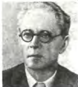
Леонид Арсеньевич Булаховский

Вопросам исторической фонетики в свое время уделял внимание и другой ученик Шахматова — В. В. Виноградов (1895—1969) (см. его „Очерки по истории звука \text{ч} в севернорусском наречии“, 1919), впоследствии занимавшийся вопросами изучения русского литературного языка, стилистики и языка писателя. В. В. Виноградов является создателем науки об истории русского литературного языка (см. его книгу „Очерки по истории русского литературного языка XVII—XIX вв.“ (изд. 1.—1934 г., изд. 3—1983 г.) и работу „Основные этапы истории русского языка“ в журнале „Русский язык в школе“, 1940, № 3—5, а также монографии и многочисленные статьи о языке крупнейших русских писателей — Пушкина, Гоголя, Достоевского, Толстого и др.). Большое значение для истории русского языка имеют работы В. В. Виноградова по лексике — по истории различных русских слов.