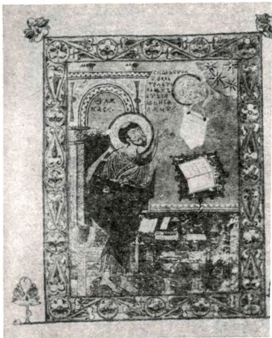
Миниатюра из Остромирова евангелия 1056—1057 гг.