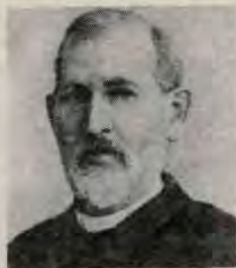
Федор Иванович Буслаев