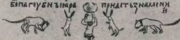
Лист из Изборника Святослава 1073 г.

НЪИ РАЗАРЪШТИ ЖЕНХЪИ ВЛАЖАХУ ИЖЕБИМАЪПОПОУ СТНЕЪ ТВИКОЖЕ ТЪУЪЖКЪТВОРН ША СЕЖЕУБОНСА БАВНРЕКЪИИ АШТЕ ВЪСТИИВЪТЕБПРО РОКЪ ИЛАНДАНСЪ НЪИ ИДАТЕЪНАИ НИКНАМУЖА ИДА ПРАДЕЪЗНАМИН