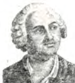
Михаил Васильевич Ломоносов