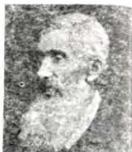
Измаил Иванович Срезневский

дворянства и в городах, близлежащих к Москве; поморское — это все северновеликорусское наречие, т. е. окающие говоры; по мнению Ломоносова, это наречие ближе к „славенскому“ старому языку. Третье, малороссийское, было названо им так потому, что украинский язык как литературный тогда еще не оформился. Ломоносов писал, что это наречие ближе к польскому языку и отлично от остальных двух наречий. Таким образом, Ломоносов, хотя и не выделил белорусского языка и не разделил южно- и средневеликорусские говоры, все же наметил основные наречия русского языка и указал их границы.