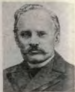
Алексей Александрович Шахматов

ция Буслаева, изложенная в „Опыте исторической грамматики русского языка“ (в последующих изданиях — „Историческая грамматика русского языка“), долгое время сохранялась в преподавании этой науки.