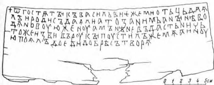
Новгородская грамота № 9 на бересте — письмо „От Гостяты к Василию“