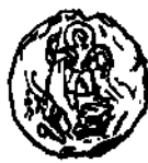
Грамота великого князя Мстислава и его сына Всеволода около 1130 г.

Добрилово евангелие 1164 г., южное по происхождению и интересное тем, что в его орфографии отражается процесс падения редуцированных. Хранится оно в библиотеке им. В. И. Ленина.