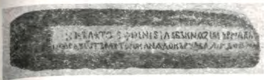
Надпись на Тьмутараканском камне 1068 г.

в настоящее время хранится в Публичной библиотеке им. Салтыкова-Щедрина в Ленинграде.