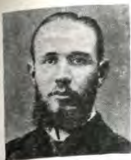
Николай Николаевич Дурново