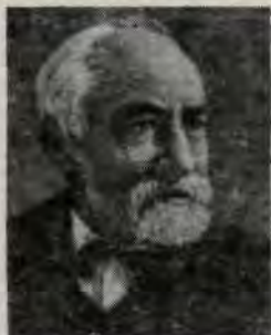
Алексей Иванович Соболевский