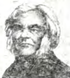
Александр Христофо- рович Востоков