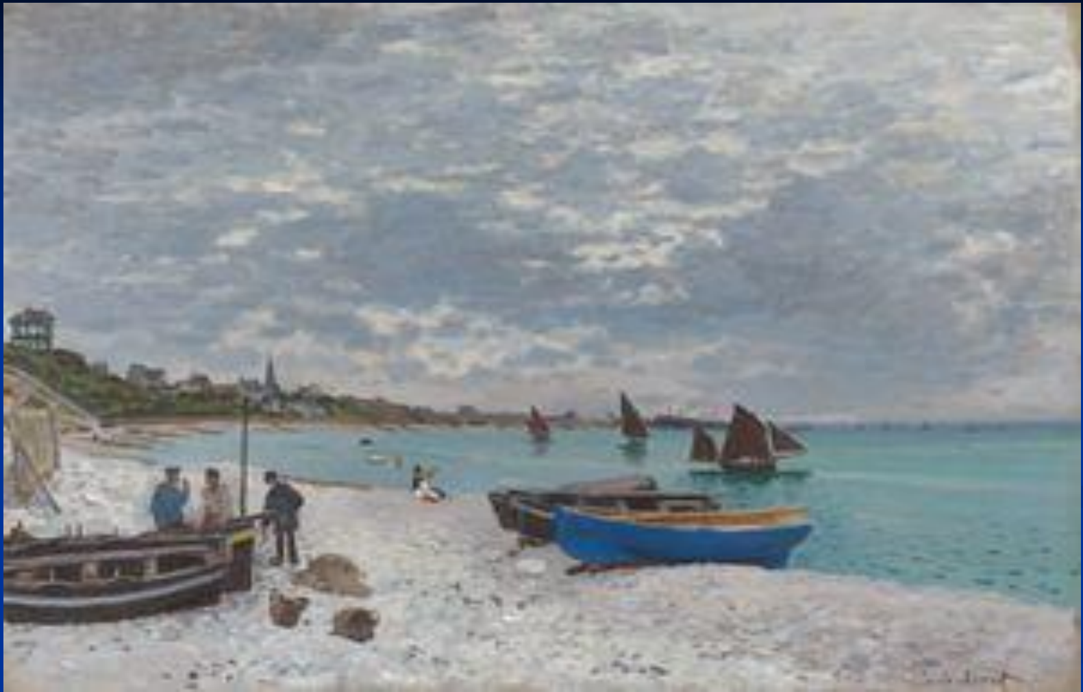
The Beach at Sainte Adresse, Claude Monet, 1867