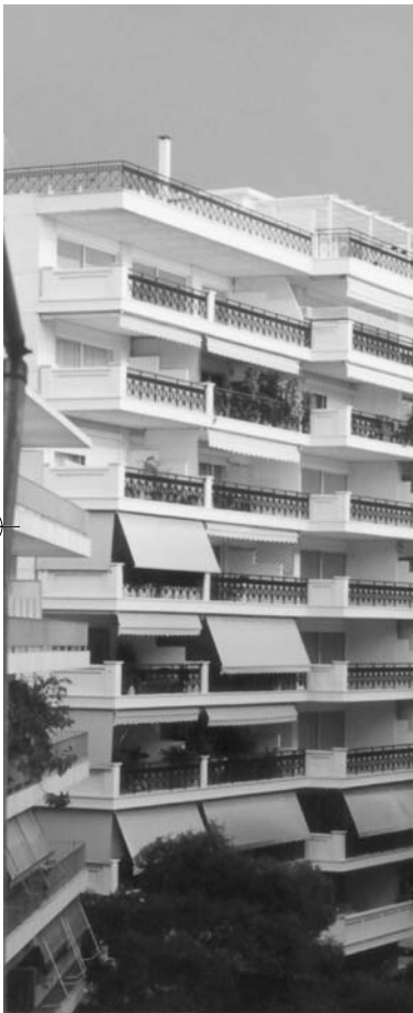
Ποθηκατοικία - Π. Φάληρο

Θεωρώ συνεπώς πώς η αισθητική αξιολόγηση του χώρου απαιτεί στην εποχή μας όχι μόνο τις παραδοσιακές αισθητικές έννοιες του ωραίου ή του υψηλού αλλά και του γραφικού το οποίο είναι πρόσκληση στο ι-διόμορφο και απρόβλεπτο και αντιτίθεται στην κανονικότητα και την ομοιομορφία. Το γραφικό παραμένει στην εποχή μας μια κύρια αισθητική και πολιτισμική κατηγορία και ανευρίσκεται σε αισθητικές θεωρίες που είναι ιδιαίτερα ευαίσθητες σε κοινωνικές, πολιτιστικές, οικονομικές και ιδεολογικές προσεγγίσεις της τέχνης και του περιβάλλοντος, γι' αυτό και επισημαίνεται εδώ η ιδιαίτερη παρουσία του στον χώρο σήμερα. Άλλωστε μετά μακριά αδιαφορία των αισθητικών προς το γραφικό και τη γραφικότητα, αυτό έχει αποβεί και πάλι αισθητική, πολιτισμική και κριτική κατηγορία που λαμβάνεται σοβαρά υπ' όψη κατά τη σχεδίαση των χώρων. ■