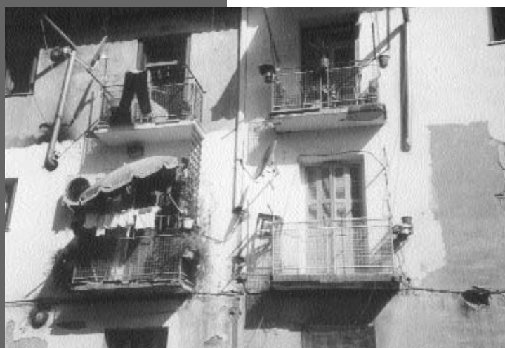
Προσφυγικά - Λεωφ. Συγγρού, Φίε