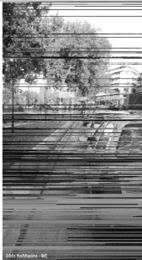
Οδός Καλλιπόλης - Φιξ

Αν ο άνθρωπος αποκρυπτογραφήσει αυτούς τους "φυσικούς νόμους", τότε θα μπορεί να ελέγξει την Φύση, την ίδια την Πραγματικότητα, τον ίδιο τον Κόσμο, και να τους καταστήσει υπηρετικούς των δικών του "αναγκών" και επιδιώξεων που έχουν επικεντρωθεί πλέον στο εκάστοτε παρόν, στην νέα έννοια περί "ανάπτυξης" και ευζωίας που γνωρίζουμε. Αυτό δε, γιατί η νέα αυτή μηχανιστική εικόνα για το Σύμπαν και την λειτουργία του, επεκτάθηκε μοιραίως και στην βιολογία με την σχεδόν αυτονόητη επικράτη-