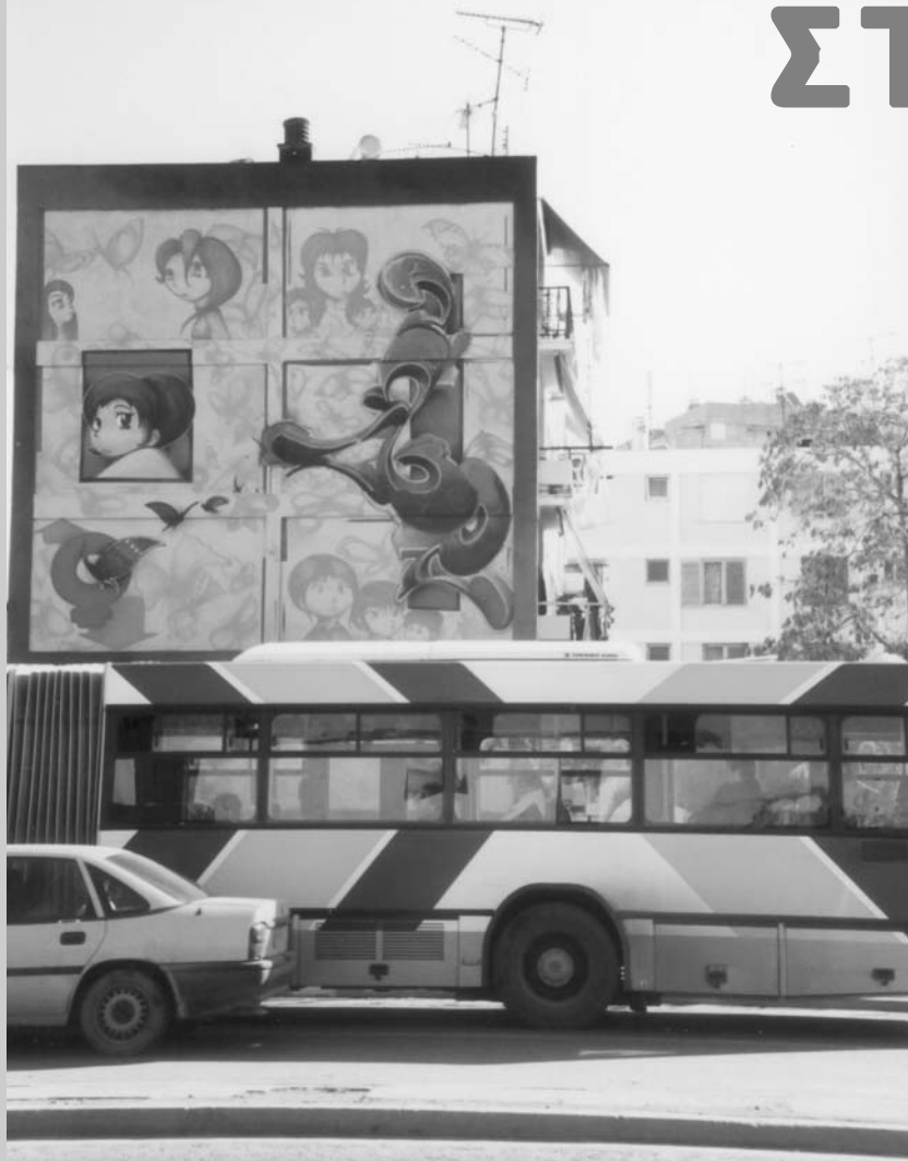
Graffiti σε εργατικές πολυκατοικίες, Οδός Πειραιώς - Φωτο: Πάνη Σταθοπούλου

Το γραφικό ως αισθητική ποιότητα του ελληνικού τοπίου και η αισθητική του περιβάλλοντος