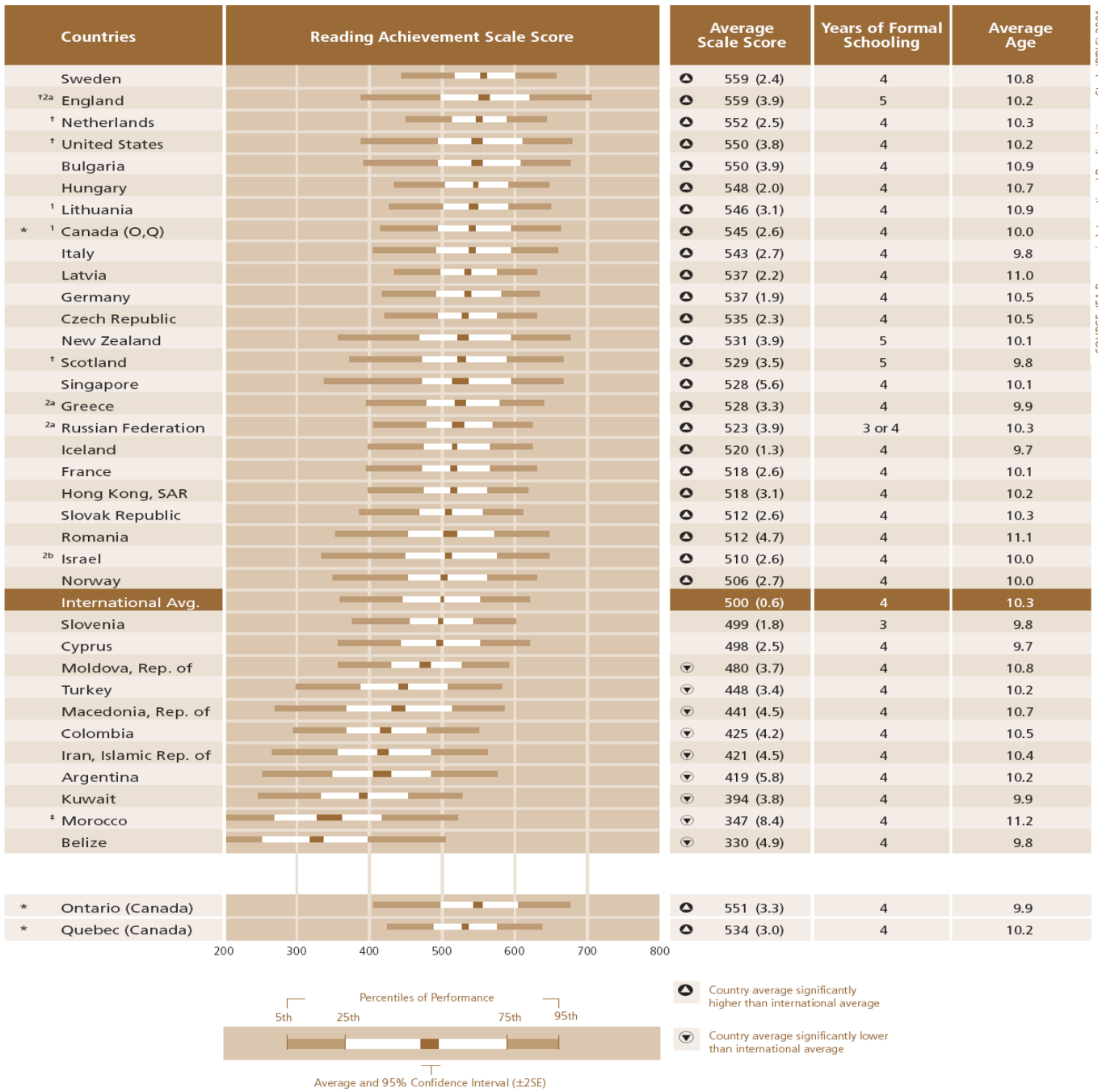
Exhibit 2.1: Distribution of Reading Achievement for Literary Purposes