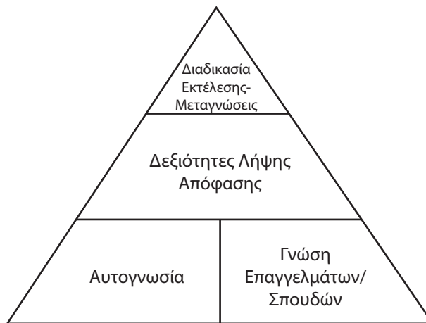
Σχήμα 1. Πυραμίδα της Γνωστικής Επεξεργασίας Πληροφοριών (Προσαρμογή από: Peterson, Sampson & Reardon, 1991).

Σύμφωνα με τη θεωρία, η διαδικασία της επεξεργασίας πληροφοριών για τη λήψη επαγγελματικών αποφάσεων αποτυπώνεται με τη μορφή μιας πυραμίδας, όπου οι θεμέλιοι λίθοι της είναι η αυτογνωσία και η γνώση των επαγγελμάτων-σπουδών (Σχήμα 1). Αν η βάση, λοιπόν, της πυραμίδας είναι σαθρή, τότε όλο το κατασκεύασμα (δηλαδή η λήψη της επαγγελματικής απόφασης) μπορεί να καταρρεύσει. Οπότε, όταν προσπαθούμε να βοηθήσουμε το άτομο να προσδιορίσει την ακαδημαϊκή και επαγγελματική του σταδιοδρομία, πρέπει να εστιάζουμε και στα δύο σημεία ισορροπίας: στην ενίσχυση της αυτογνωσίας και στην πληροφορία για τα προγράμματα σπουδών και τα επαγγέλματα.