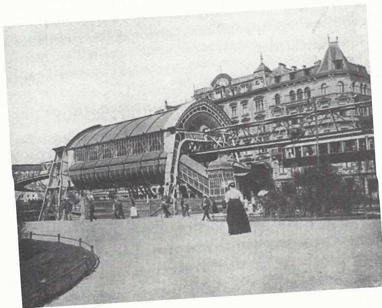
Εικόνα 8.2 Υπέργειος αστικός σιδηρόδρομος στη γερμανική πόλη Έλμπερφελντ. Οι χρήστες των ηλεκτροκίνητων μέσων μεταφοράς προέρχονταν επί μακρόν από τις εύπορες σχετικά τάξεις. Εξάιρεση στον κανόνα αποτελούσαν οι περιπτώσεις στις οποίες οι δημοτικές αρχές επενέβαιναν αποφασιστικά υπέρ της λειτουργίας πρωινών δρομολογίων με φτηνό εισιτήριο που απευθύνονταν στην εργατική τάξη.

το ηλεκτροκίνητο τραμ ενίσχυσε την τάση για προαστιοποίηση, μολονότι τα προάστια επί το πλείστον δεν προέκυψαν από τη χρήση του τραμ. Αν εξετάσουμε την κοινωνική προέλευση των χρηστών του τραμ, θα διακρίνουμε μίαν αναπάντεχη ποικιλία. Σε πολλές πόλεις, κυρίαρχη ομάδα χρηστών του τραμ υπήρξε επί μακρόν η τάξη των εύπορων μεσοαστών, κάτι που εξηγεί το κατά πολύ μεγαλύτερο εύρος των επιλογών που τους προσφέρονταν ως προς την τοποθεσία των συνοικιών τους και τους προορισμούς της ψυχαγωγίας και αναψυχής τους. Το κατά πόσο το τραμ θα γινόταν όχημα μιας οικιστικής μεταρρύθμισης δεν εξαρτιόταν τόσο από τεχνικές επιλογές, όσο από επιλογές πολιτικής φύσης. Το τραμ, εντέλει, θα γινόταν «το μεταφορικό μέσο του απλού λαού» μόνο στις πόλεις που τα δημοτικά συμβούλια έκαναν αποφασιστικά βήματα. Θέσπισαν φτηνά εργατικά εισιτήρια, κατα-