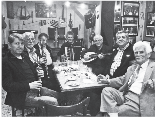
Καφενείο των Μουσικών, Σατωβριάνδου 29

τις μεθόδους που πρέπει να ακολουθήσουν για την καταγραφή του. Συζητάμε μαζί τους και συναποφασίζουμε τα θέματα που επιθυμούν να διερευνήσουν, τα οποία συνήθως συνδέονται με το προσωπικό και οικογενειακό τους υπόβαθρο, ενώ στη συνέχεια τους συμβουλευόμαστε καθ' όλη την προετοιμασία των εργασιών τους. Σε αυτό το έργο οι καθηγητές συχνά βοηθούνται από μεταπτυχιακούς και διδακτορικούς φοιτητές, δουλεύοντας έτσι σε ένα περιβάλλον μαθητείας, γεγονός το οποίο δημιουργεί αίσθηση και ταυτότητα ομαδικότητας μεταξύ κα-