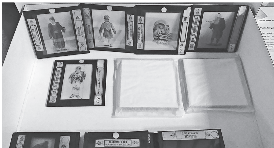
Εικ. 1. Από τα αντικείμενα του Α.Μ.Α.: Γυάλινες πλάκες που ο Νικόλαος Πολίτης χρησιμοποίησε στις διαλέξεις Μυθολογίας του.

https://pergamos.lib.uoa.gr/uoa/dl/frontend/browse.html?p.id=col_folklore .