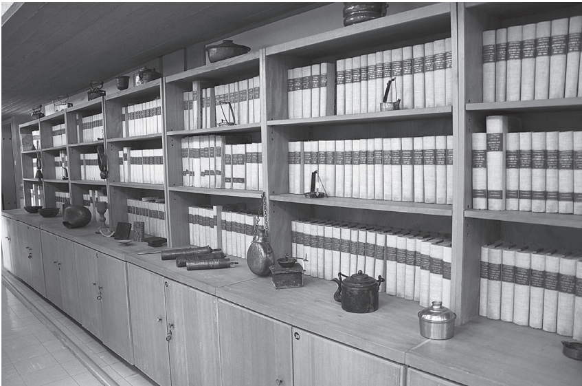
Εικ. 4. Τα λαογραφικά χειρόγραφα εκτίθενται πλάι στα αντικείμενα στο Λ.Μ.Α.

Πολλά πρώιμα χειρόγραφα περιλαμβάνουν τέτοια στοιχεία, έτσι ώστε μπορεί κανείς να τα θεωρήσει ως μουσειακά αντικείμενα καθεαυτά. Η Μηλίγκου-Μαρκαντώνη αναφέρει ότι από το 1967 ο Σπυριδάκης και η ίδια καθοδηγούσαν τους φοιτητές – ερευνητές στη μελέτη θεματικών όπως το φαγητό, τα έθιμα και οι τελετουργίες που σχετίζονται με αυτό (διατροφική εθιμολογία), αντλώντας έτσι πολύτιμες πληροφορίες για τους κοινωνικοοικονομικούς και τελετουργικούς παράγοντες που επηρέαζαν την παραγωγή και κατανάλωση τροφής σε διάφορα μέρη της Ελλάδας (Μηλίγκου-Μαρκαντώνη, 2016: 560-561). Επιπλέον, μεγάλος αριθμός αντικείμενων που αποτελούν τη μουσειακή συλλογή του Λ.Μ.Α. έχουν δωρισθεί από φοιτητές, για να συνοδεύσουν τα χειρόγραφα που υπέβαλλαν. Για να χρησιμοποιήσω τη σύγχρονη ακαδημαϊκή ορολογία, η διδασκαλία της λαογραφίας στο Πανεπιστήμιο Αθηνών τόνιζε εξ αρχής τόσο τις υλικές όσο και τις άυλες πτυχές της πολιτιστικής κληρονομιάς (intangible cultural heritage/ ICH, σύμφωνα με τη διεθνή ορολογία), που θεωρούνται ως αλληλένδετες στα αντικείμενα της Λαογραφικής Συλλογής /Λ.Μ.Α., γεγονός το οποίο ωθούσε τους φοιτητές να αντιλαμβάνονται τον παραδοσιακό πολιτισμό στην ολότητά του 8 .