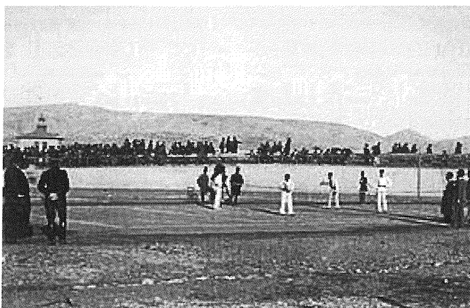
Τελικός του διπλού αγωνίσματος