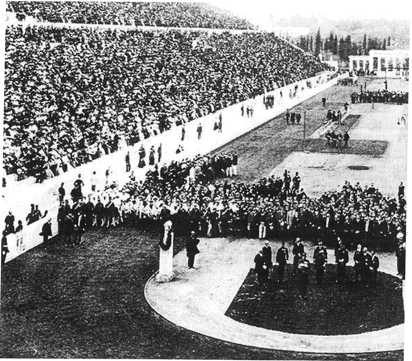
1896 Olympic opening ceremony

για να παρακολουθήσει την εκδήλωση. Προφανώς ο Μάνος ήθελε να στρατολογήσει θεατές για τους αγώνες ή και συμμετέχοντες προερχόμενους από τον κύκλο του πανεπιστημίου της Οξφόρδης, και ταυτόχρονα να διαδώσει το μήνυμα της επικείμενης αναβίωσης των αγώνων.