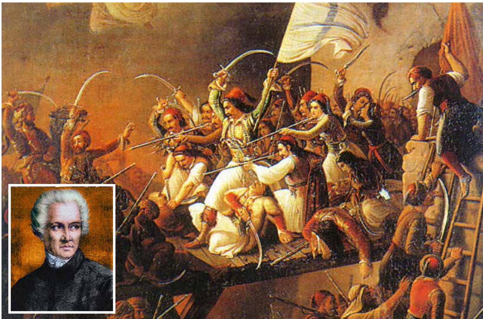
Ο Διονύσιος Σολωμός (1798-1857) - Από την έξοδο του Μεσολογγίου.