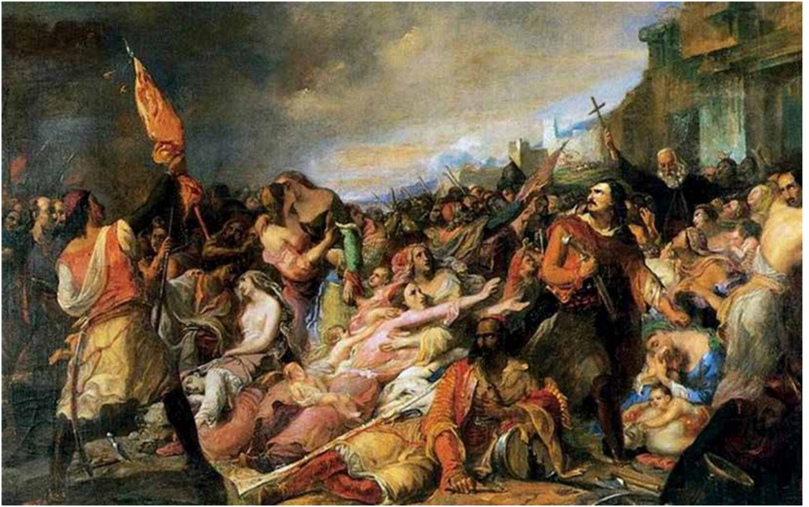
Louis Joseph Toussaint Rossignol-Η τελευταία μετάληψη των Μεσολογγιτών

Μεσολογγίου, συνδέεται με το Α' Σχέδιασμα των Ελεύθερων Πολιορκημένων.