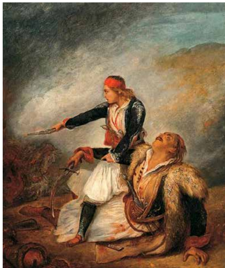
Ary SCHEFFER :Ελληνόπουλο υπερασπίζεται τον πληγωμένο πατέρα του (1827)- Μουσείο Μπενάκη

Και αναγκάζονται να τρώνε, στην αρχή, τα μεγάλα ζώα, καμήλες, άλογα, μουλάρια, γαϊδούρια... Ύστερα... εξαναγκάζονται να τρώνε γάτες, σκυλιά, ποντίκια,