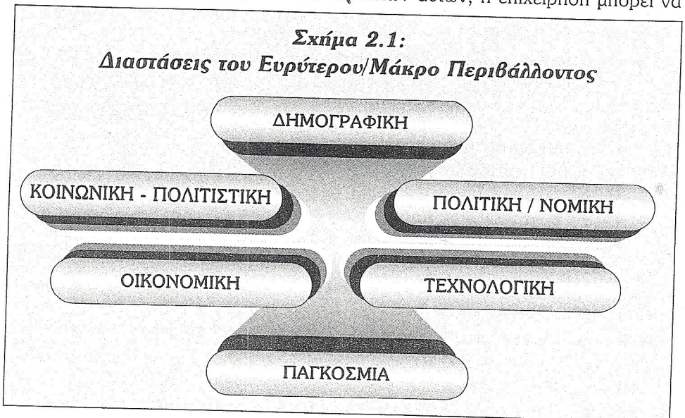
Σχήμα 2.1: Διαστάσεις του Ευρύτερου/Μάκρο Περιβάλλοντος

Μέσα από την επεξεργασία των στοιχείων αυτών, η επιχείρηση μπορεί να