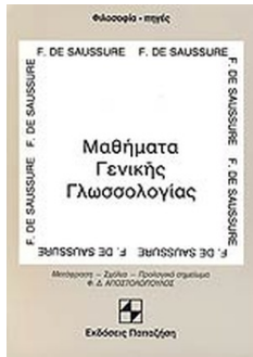
Μαθήματα γενικής γλωσσολογίας, 1916 F. de Saussure