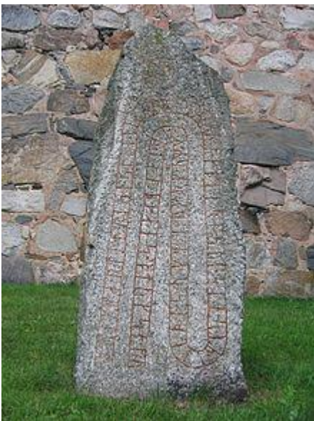
Runestone U 358