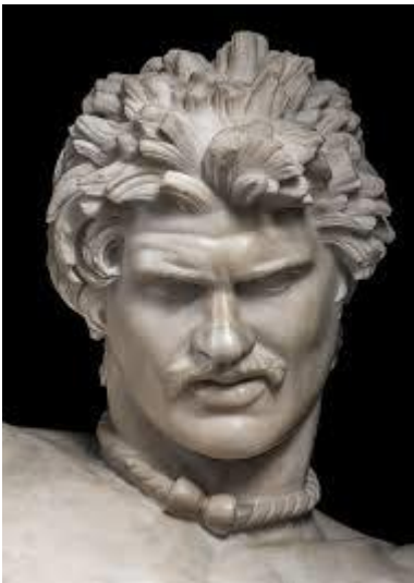
Dying Gaul, Roman, 1st or 2nd century AD, marble, 37 x 737/16 x 351/16 in., Sovrintendenza Capitolina — Musei Capitolini, Rome, Italy

Οι σημερινοί Ευρωπαίοι που είναι Κέλτες ή έχουν κελτικές ρίζες είναι στην (ή έχουν καταγωγή από) Βρετάνη (Bretagne – όπως οι δημοφιλείς ήρωες των καρτούν Γαλάτες Αστερίξ και Οβελίξ), Γαλικία (Galicia – στο βορειοδυτικό άκρο της Ισπανία), στην Ιρλανδία, την Ουαλία και την Σκωτία (με σημαντικό το σκανδιναβικό στοιχείο, λόγω των επιδρομών των Βίκινγκ).