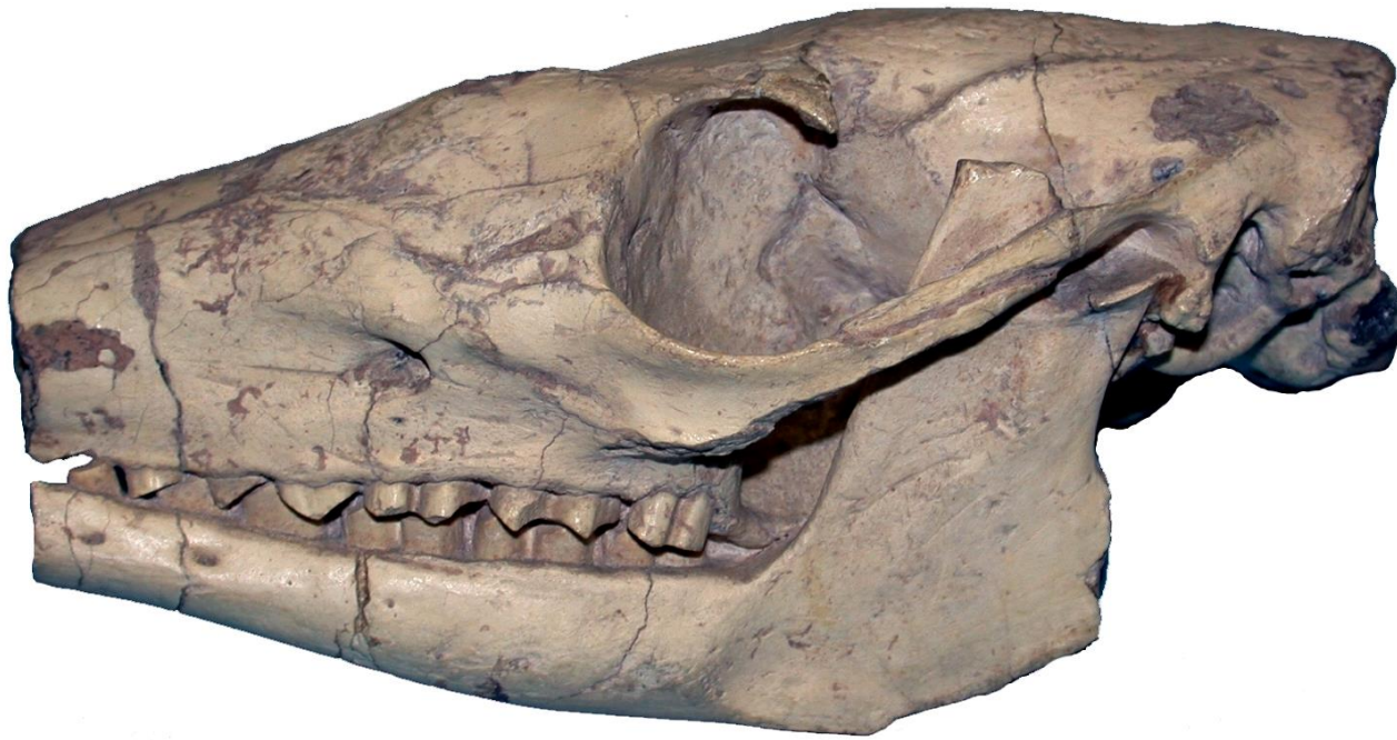
Amphiorcyteropus gaudryi , Ανώτερο Μειόκαινο, Σάμος (Μουσείο Φυσικής Ιστορίας του Λονδίνου)