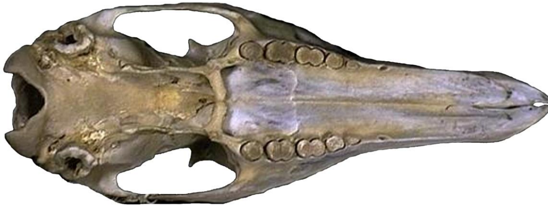
Orycteropus afer , αρτίγονο, Αφρική