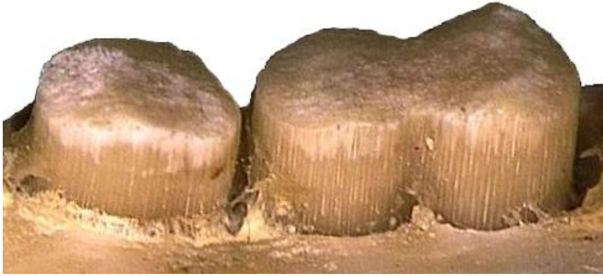
Orycteropus afer , αρτίγονο Αφρική. Λεπτομέρεια οδόντων.