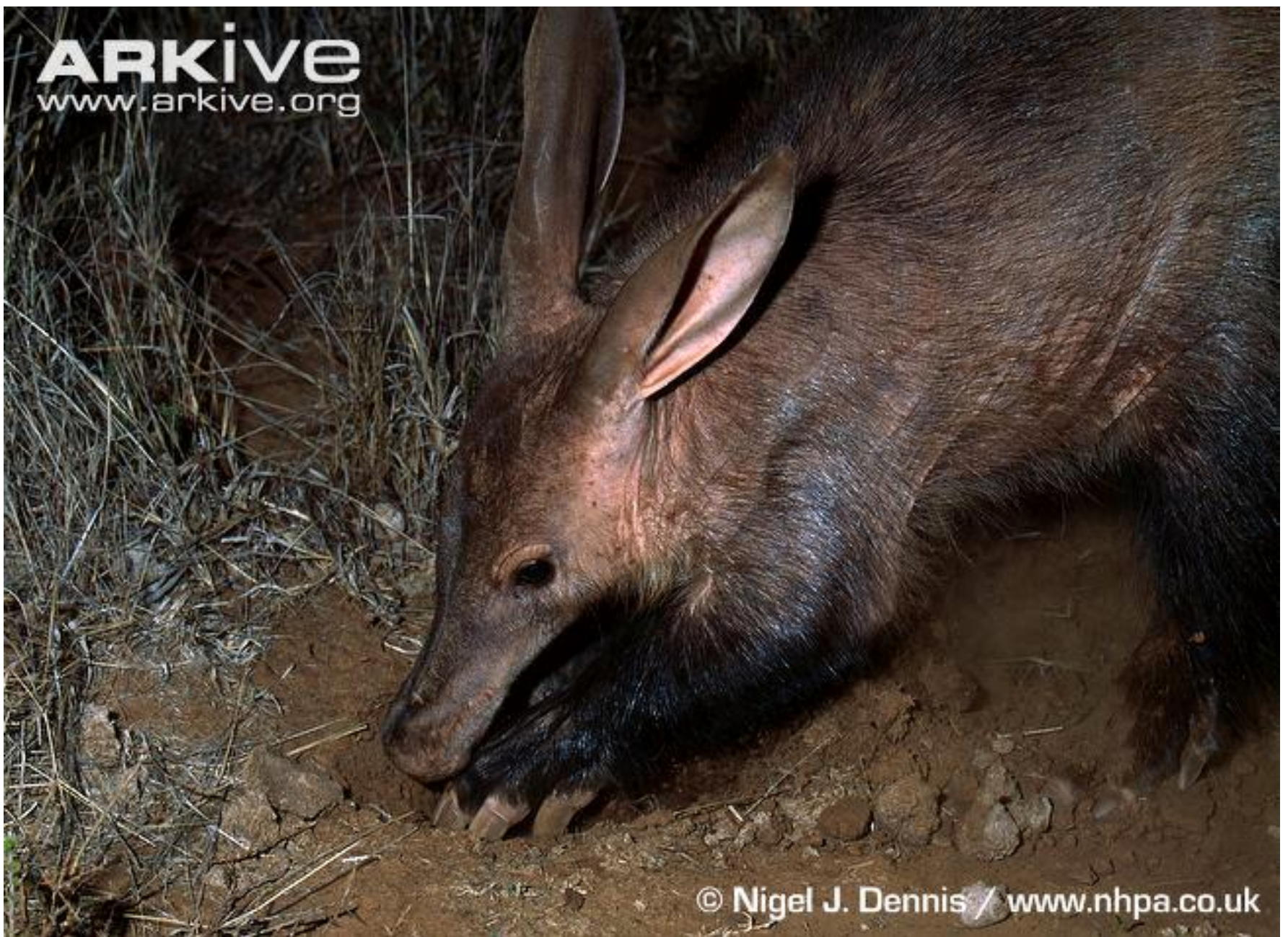
Ορυκτερόποδας ενώ σκάβει αναζητώντας τροφή