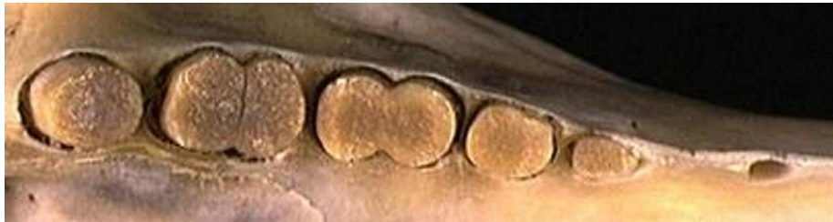
Orycteropus afer , αρτίγονο, Αφρική. Άνω οδοντοστοιχία.

Η τάξη αυτή εμφανίστηκε στο Κατώτερο Μειόκαινο της Αφρικής, πριν περίπου 20 εκατ. έτη. Αντιπρόσωποί της μετανάστευσαν στην Ευρασία πριν περίπου 15-16 εκατ. έτη. Σημερινός αντιπρόσωπος της τάξης είναι ο ορυκτερόποδας ( Orycteropus afer ) που ζει στην Αφρική.