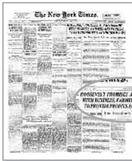
Το πρωτοσέλιδο των New York Times στις 8 Μαΐου 1933 έγραφε: «Ο Ρούζβελτ υποδέχεται "συνεργασία" με τους επιχειρηματίες, τους αγρότες και τους εργαζομένους, για να προσφέρει κέρδη και υψηλότερους μισθούς».

Συνοπτικά το Νιου Ντιλ ήταν μια σύνθεση, ένα μωσαϊκό μέτρων πολιτικής, για να αντιμετωπιστούν τα τρέ-