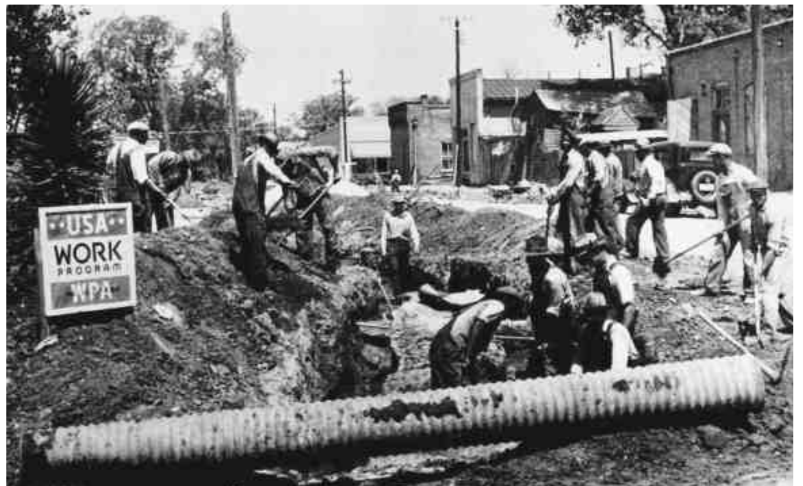
Συνεργείο της Διοίκησης Έργων (Works Progress Administration) εν ώρα εργασίας. Η WPA ήταν η μεγαλύτερη υπηρεσία του Νιου Ντιλ, η οποία τον καιρό της Μεγάλης Ύφεσης απασχολούσε εκατομμύρια ανέργους στην κατασκευή δημοσίων έργων, όπως δρόμους, σχολεία, νοσοκομεία κ.λπ. Μέχρι την παύση της από το Κογκρέσο αλλά και από την απασχόληση σχετιζόμενη με τον πόλεμο το 1943, η WPA ήταν ο μεγαλύτερος εργοδότης στις Ηνωμένες Πολιτείες της Αμερικής.

Τα προγράμματα του Νιου Ντιλ ταξινομούνται στην ιστοριογραφία σε τρεις κατηγορίες: προγράμματα ανακούφισης, προγράμματα ανασυγκρότησης και προγράμματα μεταρρύθμισης. Στο πρώτο Νιου Ντιλ δόθηκε έμφαση στην ενίσχυση της αγοραστικής δύναμης των νοικοκυριών μέσω αναδιανομής του εισοδήματος και ανάληψης από το κράτος δράσεων που δημιουργούσαν εισοδήματα. Στο δεύτερο, και λόγω της εμπειρίας του 1937-8, η έμφαση δόθηκε στη σταθεροποίηση του οικονομικού συστήματος και η δημοσιονομική πολιτική αναδείχθηκε στο κατ'εξοχήν εργαλείο παρεμβάσεων. Η εμπιστοσύνη των πολιτών προς το οικονομικό σύστημα και η λειτουργία της οικονομίας σε ένα συντονισμένο, ήρεμο οικονομικά, περιβάλλον ήταν ο απώτατος στόχος της πολιτικής.