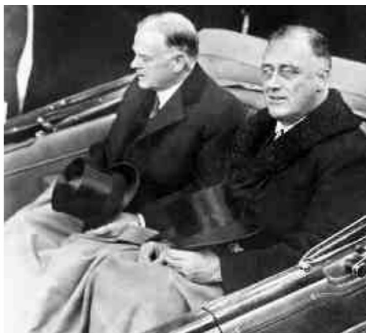
Με την έκφραση «Νιου Ντιλ» ο Ρούζβελτ (δεξιά στη λιμουζίνα, την ημέρα ορκωμοσίας του) εγκαινίαζε μια άλλη πολιτική από εκείνη του προηγούμενου προέδρου Χούβερ (αριστερά). Η κυβέρνηση Χούβερ εφάρμοσε το 1930 την πρόταση των γερουσιαστών Hawley και Smoot (κάτω, αριστερά και δεξιά αντιστοίχως) αυξάνοντας τους δασμούς κατά 33%.