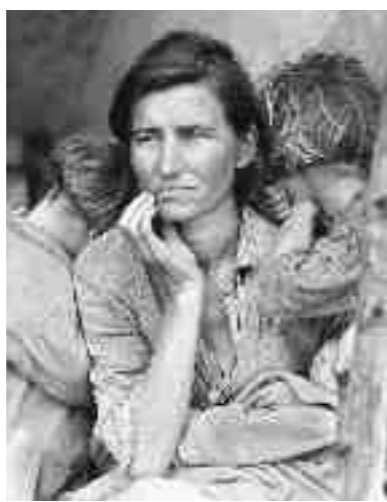
Εποχιακή εργάτρια με τα παιδιά της τον καιρό της Ύφεσης στην Καλιφόρνια.

Μετά τον Δεύτερο Παγκόσμιο Πόλεμο και λόγω της προόδου που είχε συντελεστεί σε επίπεδο οικονομικής θεωρίας, η οικονομική πολιτική του Νιου Ντιλ αναγορεύτηκε σε πυξίδα χειρισμού οικονομικών κρίσεων και κοινωνικών σταθεροποιήσεων παγκοσμίως. Οι εκλογικές επιτυχίες του Ρούζβελτ, το χάρισμα της επικοινωνίας που διέθετε και η εγγύτητα των ενεργειών του προς τα συμφέροντα της μεσαίας τάξης πιστοποιούν την κοινωνική αποδοχή της πολιτικής του.