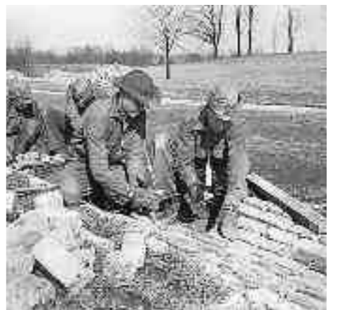
Και το Civilian Conservation Corps κατασκεύαζε δρόμους...

Η μεγάλη καινοτομία στην Οικονομική Επιστήμη κατά τον μεσοπόλεμο ήταν η δημοσίευση της «Γενικής Θεωρίας» του Κένυς το 1936. Επειδή σε αυτήν τονίζεται η σημασία της ψυχολογίας του επενδυτή, η ανάγκη κοινωνικοποίησης των επενδύσεων και η πρωταρχική σημασία της δημοσιονομικής πολιτικής για τη σταθεροποίηση της οικονομίας, κάποιοι υποστήριξαν ότι το Νιου Ντιλ αποτελούσε εφαρμογή της Κεϋνσιανής Θεωρίας στην πράξη. Η άποψη αυτή, παρότι λανθασμένη, επιβιώνει και επαυλαμβάνεται κατά καιρούς, ευτυχώς όχι στους ακαδημαϊκούς κύκλους. Είναι βέβαια σωστό ότι ο Κένυς σχολίαζε θετικά τις προσπάθειες του Ρούζβελτ να αναθεωρήσει την οικονομία. Στο ταξίδι του στις ΗΠΑ το 1935 είδε πολλούς κυβερνητικούς αξιωματούχους και ενθάρρυνε τις προσπάθειές τους. Από την άλλη υπήρξαν και στιγμές κριτικής και αρνητικών σχολίων εκατέρωθεν.