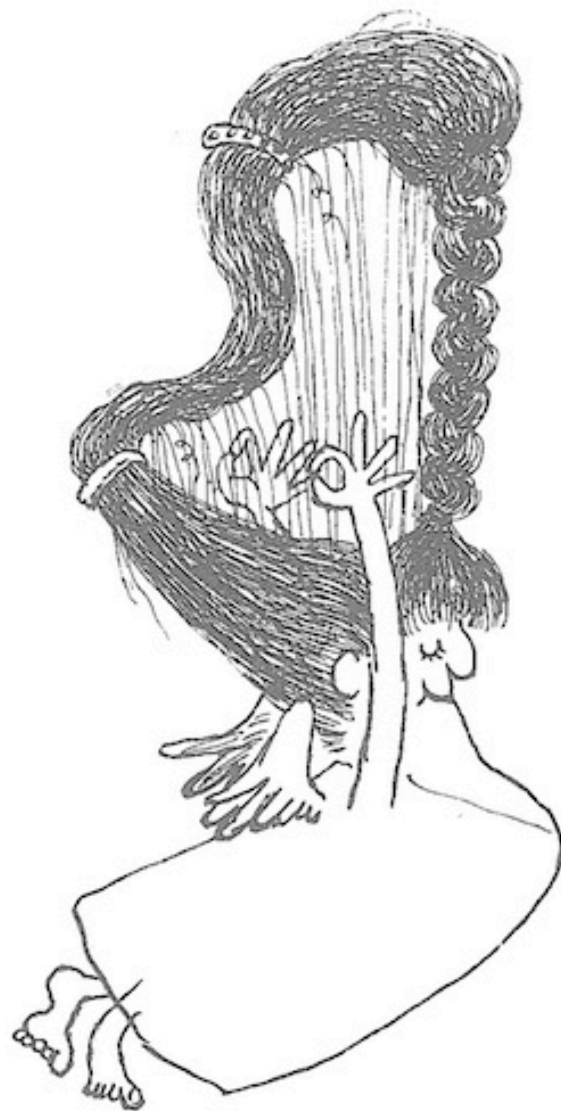
Musical Cartoons Gerard Hoffnung