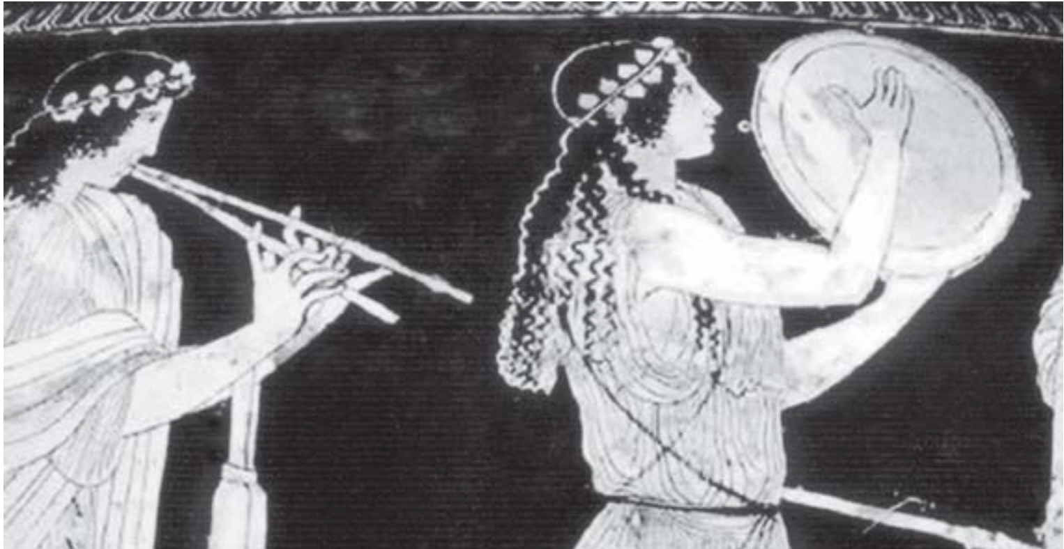
Από ελληνικό αγγείο του 5 ου αιώνα, Μαινάδες με τύμπανον