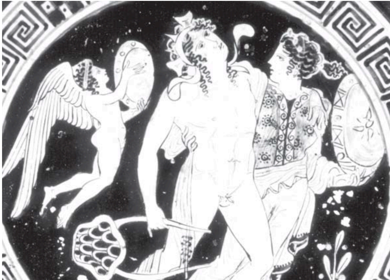
Από ελληνικό αγγείο του 5 ου αιώνα, Έρως, Διόνυσος και Αριάδνη