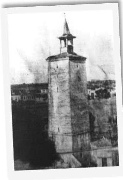
Γιαννιτιά, Ο Πύργος του Ρολογιού, αρχές 20ού αι.

Πολλές γέφυρες κτίστηκαν επάνω σε ερείπια παλαιότερων βυζα