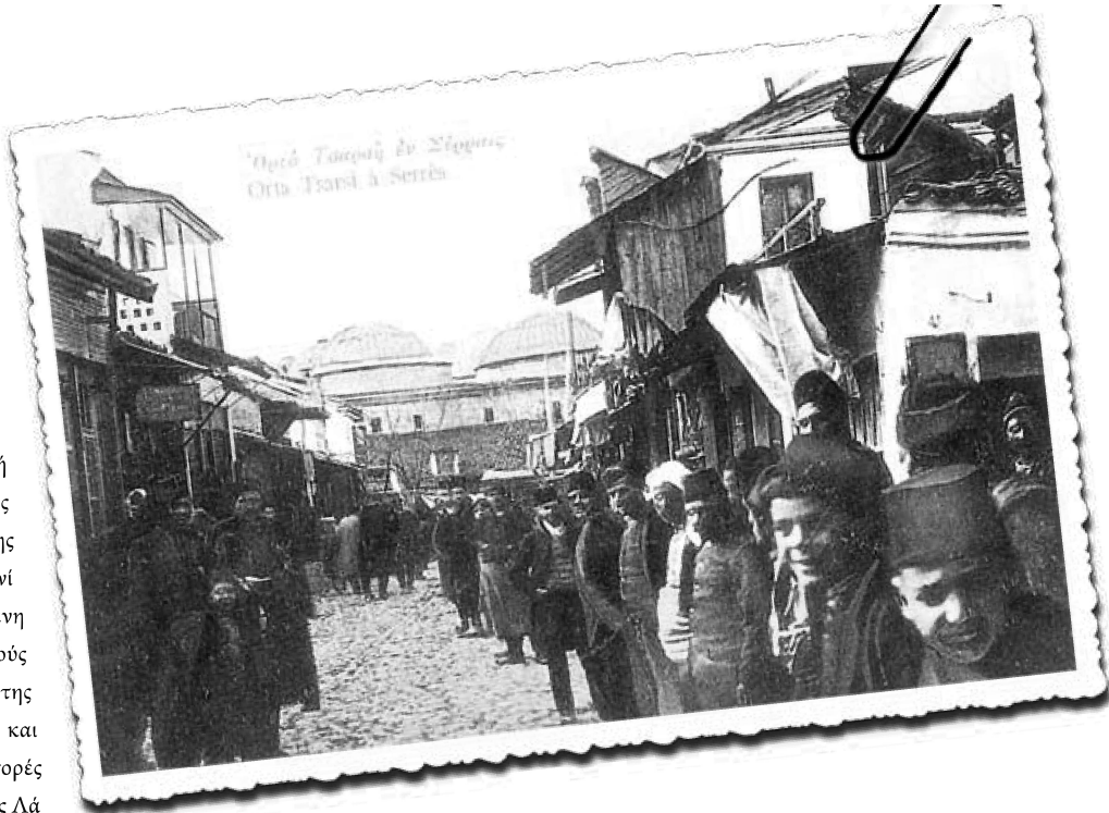
Σέρρες, η κεντρική αγορά (Ορτά τσαρσί)>διακρίνονται οι θόλοι του μπεζεστενίου.

Με καταγωγή από την ελληνορωμαϊκή βασιλική ή καισάρειον, το μπεζεστένι (bedesten ή bazzâzistân ή qaysariyya, όρος με τον οποίο ήταν γνωστό στις αραβικές χώρες, την ανατολική Μικρά Ασία και το Ιράν), ήταν θεσμός συνδεδεμένος με το διεθνές εμπόριο. Κτισμένο μόνο στις σημαντικές και με έντονα εμπορικό χαρακτήρα πόλεις, το μπεζεστένι πάντοτε αναφερόταν ανάμεσα στους σημαντικότερους θεσμούς των πόλεων. Ο Εβλιγιά Τσελεμπί κατατάσσει τις πόλεις σε δύο κατηγορίες: σε αυτές με μπεζεστένι και σε αυτές χωρίς.