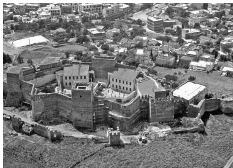
Θεσσαλονίκη, Επταπύργιο (Γεντί Κουλέ).

ντινών ή ρωμαϊκών, κατά μήκος σημαντικών οδικών αρτηριών. Ήταν λιθόκτιστες, με πολλά, σχετικά χαμηλά και αργότερα ψηλά, τόσο οξυκόρυφα όσο και ημικυκλικά τόξα. Οι Οθωμανοί φρόντισαν από τα πρώτα χρόνια της κατάκτησης να επισκευάσουν τις παλιές γέφυρες, ώστε να ενισχυθούν οι εμπορικοί και στρατιωτικοί οδικοί άξονες.