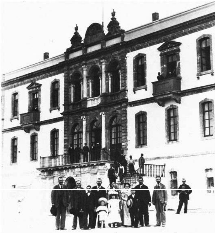
Στρατιωτικό Νοσοκομείο Χανίων, Φωτογραφία του Π. Διαμαντόπουλου, αρχές 20ού αι.

Μάνη, τη Μεσσηνία, μέχρι τη Ύδρα και τα νησιά του Αιγαίου.