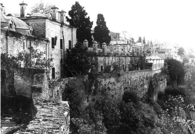
Ιμαρέτ Καβάλας, 20ός αι.

Οι πόλεις υδρεύονταν από τις κρήνες (çeşme). Το νερό διοχετευόταν μέσω ενός συστήματος υπόγειων αγωγών και δεξαμενών στις