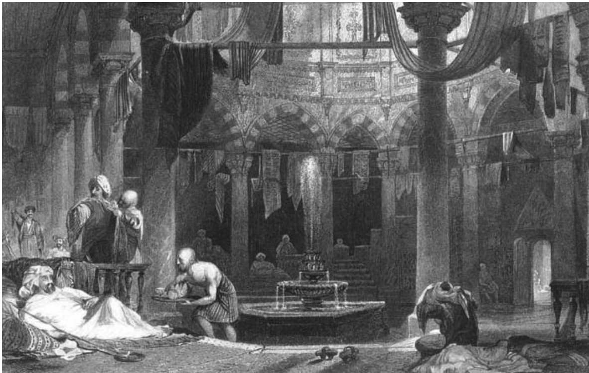
Αποδυτήρια χαμάμ, ατσαλογραφία, T. Allom (ζωγράφος) και T. A. Prior (χαράκτης).

με ξύλινες στέγες και οι υπόλοιποι χώροι με άτεχνους θόλους. Τα περισσότερα λουτρά που κτίζονται σε μικρά αστικά κέντρα και σε περιοχές που κατακτήθηκαν ή επανακτήθηκαν από τους Οθωμανούς, όπως στην Κρήτη, την Πελοπόννησο, τη Ίο κ.α. κατασκευάζονται με τους απαραίτητους μόνο χώρους και χωρίς διάκοσμο. Τον 19ο αιώνα, μέσα στη γενικότερη προσπάθεια επιστροφής στην κλασική οθωμανική αρχιτεκτονική, κατασκευάζονται πάλι λουτρά μεγάλων διαστάσεων και αίθουσες αποδυτηρίων που έχουν τα πρότυπά τους στην αστική αρχιτεκτονική.