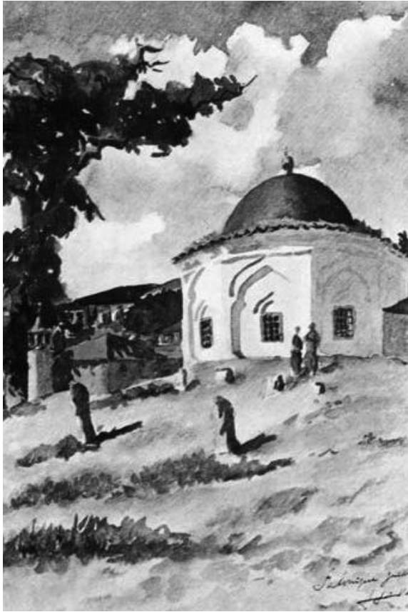
Θεσσαλονίκη, τουρμπές του Μουσά Μπαμπά.

σε ένα ιμαρέτ, όπου οι μαθητές σιτίζονταν δωρεάν. Το έργο του διδασκάλου εκτελούσε συνήθως ο ιμάμης.