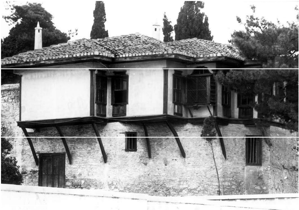
Καβάλα, Κονάκι Μωχάμεντ Άλι Πασά, 20ός αι.

αίωνα, με τον ψηλό γεροχτισμένο πέτρινο κορμό και τα προεξέχοντα σαχνισιά και χαγιάτια στον όροφο, χαρακτηρίστηκε «μακεδονίτικη», επειδή τα πιο πλούσια και πιο αντιπροσωπευτικά παραδείγματα σώζονταν στη Μακεδονία. Παρόμοια όμως αρχοντικά, με τα γενικά βασικά χαρακτηριστικά αυτής της μορφής, υπάρχουν ή υπήρχαν –είναι γνωστά από χαρακτηριστικά, φωτογραφικές και σχεδιαστικές απεικονίσεις και περιγραφές περιηγητών– στη Ύβρακη, στη Ύβρσαλία, στην Ήπειρο, στη Στερεά Ελλάδα, στον νησιωτικό χώρο (Ύβρσο, Μυτιλήνη, Σάμο, Σκόπελο), αλλά και στα μικρασιατικά παράλια. Πριν από την Επανάσταση του 1821 αποτελούσαν ουσιαστικά τον ενιαίο τύπο της ελλαδικής μεταβυζαντινής αρχιτεκτονικής.