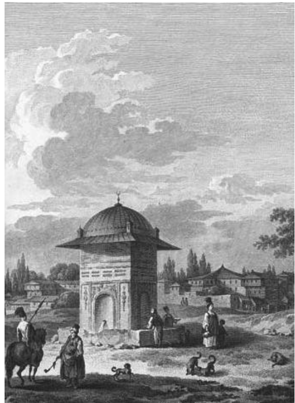
Κρήνη στην πόλη της Χίου, χαλκογραφία, 1782.

Το φρούριο του Βαρδαρίου Ψεσσαλονίκης (Torhane) κτίστη