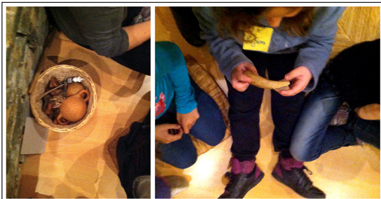
Εικόνα 9.10-9.11 Το καλάθι με τα αντίγραφα μουσειακών αντικειμένων και απτικές δραστηριότητες στο πλαίσιο του εκπαιδευτικού προγράμματος.