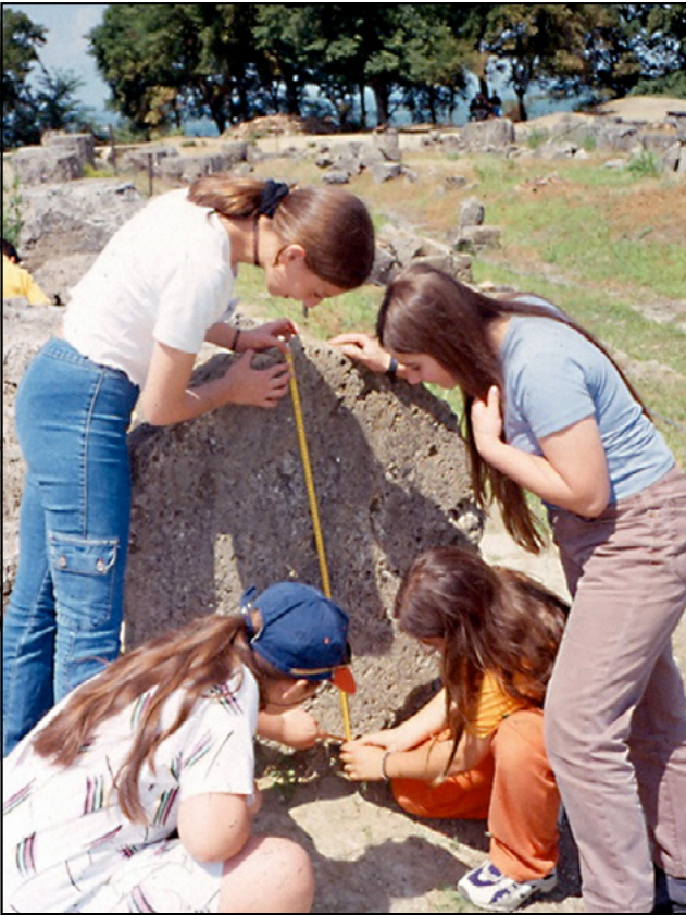
Εικόνα 9.13 Από το εκπαιδευτικό πρόγραμμα για σχολικές ομάδες «Στη Βεργίνα» και την εξερεύνηση του Ανακτόρου.