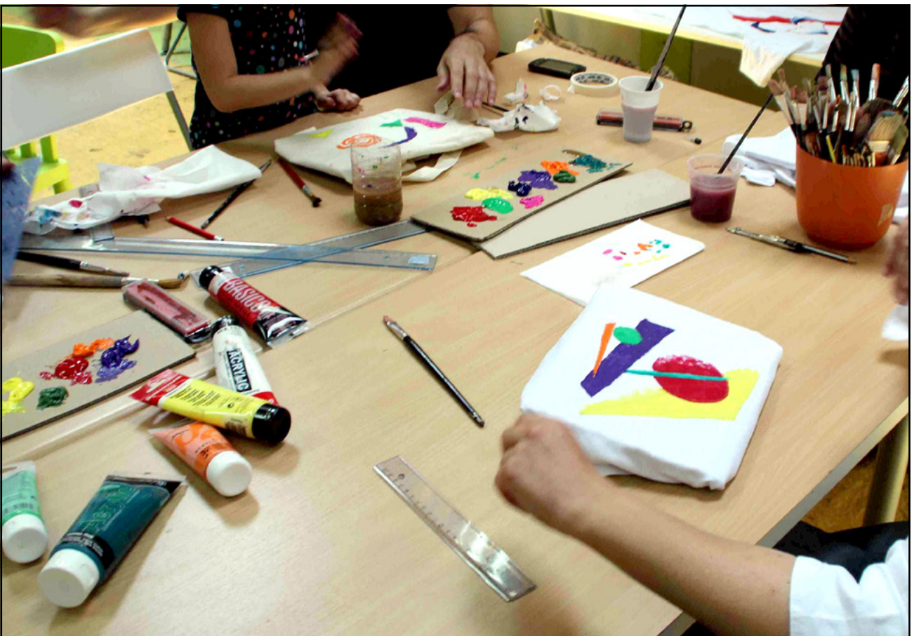
Εικόνα 9.14 Από οικογενειακό πρόγραμμα στο Κρατικό Μουσείο Σύγχρονης Τέχνης.