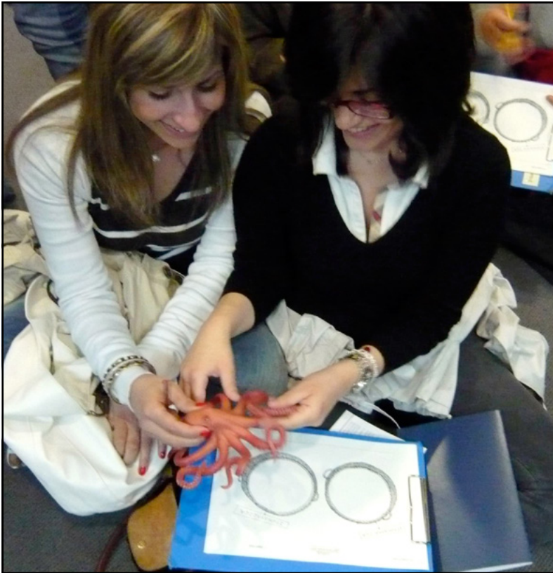
Εικόνα 9.12 Μουσείο Φυσικής Ιστορίας Γουλανδρή, καλάθι με υλικά και απτικές δραστηριότητες.

Αντίστοιχα πρακτικές ακολουθούν και άλλα είδη μουσείων, όπως για παράδειγμα το Μουσείο Φυσικής Ιστορίας Γουλανδρή (Εικόνα 9.12)