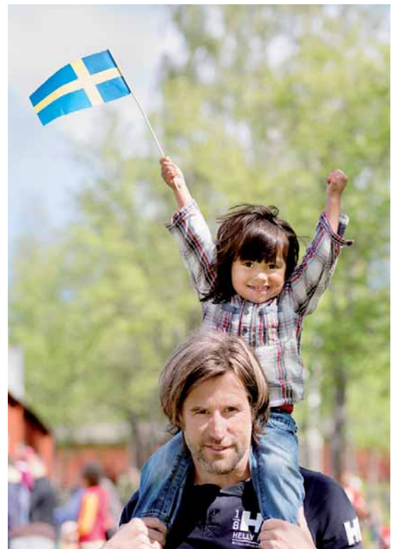
Η φωτογραφία αυτή εικονίζει τη δουλειά μας με τους γονείς, που έχει ως στόχο την υποστήριξη των πατέρων στον ρόλο του γονέα