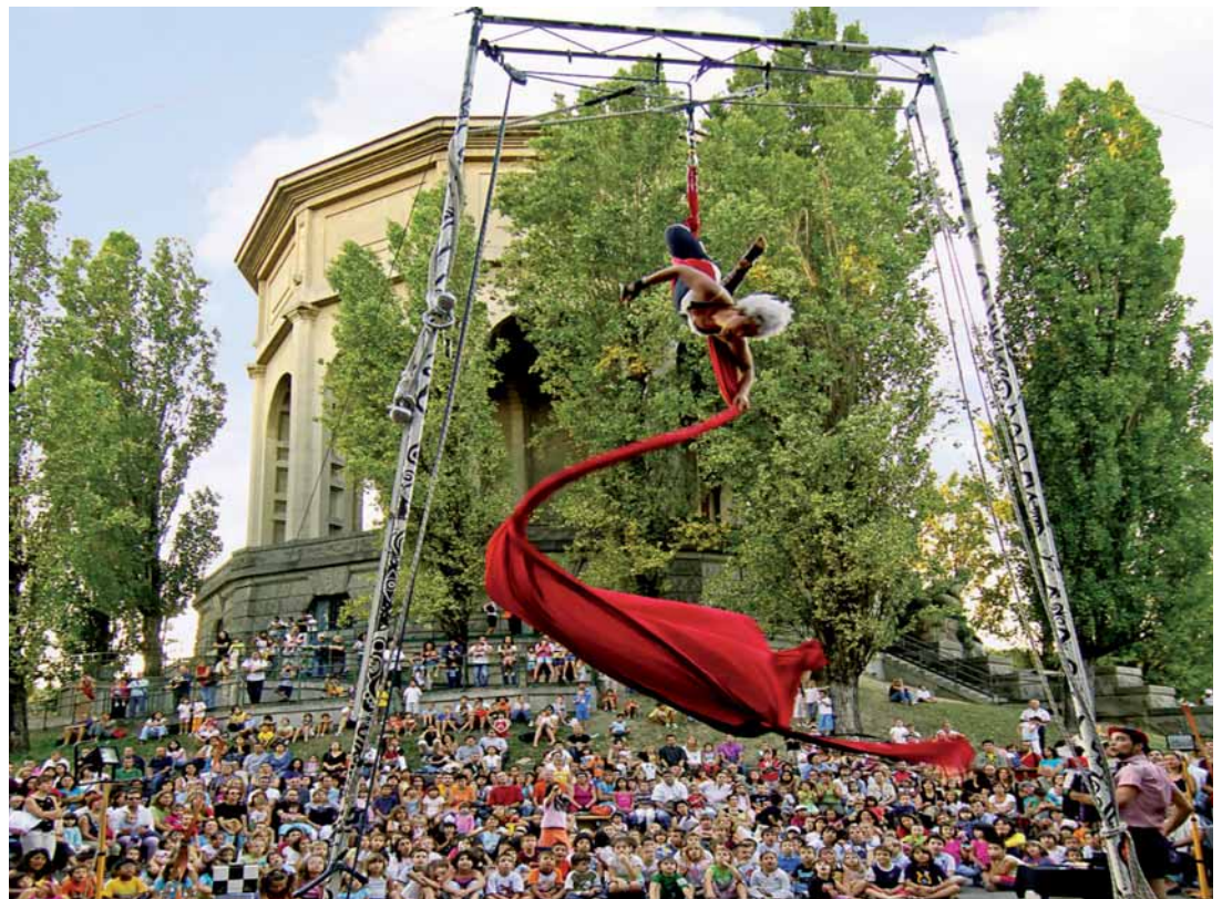
Στιγμιότυπο από την εκδήλωση Estate Bambini (Παιδιά του Καλοκαιριού) που διοργανώνεται στο Κέντρο Παιδιών και Γονέων «Το Νησί των Θησαυρών» της Φεράρας