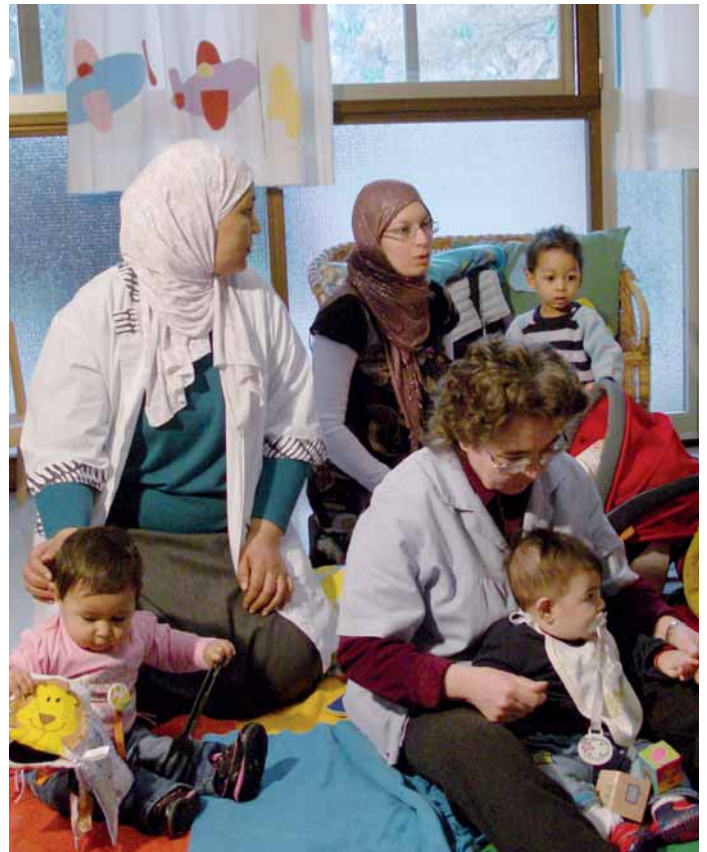
Μάθημα ιταλικής γλώσσας για ξένες μητέρες με μικρά παιδιά στο Κέντρο «Γαλάζιος Ελέφαντας» της Φεράρας.

Υπηρεσίες συνύπαρξης ενηλίκων-παιδιών υπήρχαν στην Ιταλία από τα τέλη της δεκαετίας του 1980, εμπνευσμένες σε μεγάλο βαθμό από τη γαλλική εμπειρία του Maison Verte της Françoise Dolto, αλλά από την εποχή του πρωτοποριακού Tempi per le famiglie (Χρόνος για τις οικογένειες) του Μιλάνου διασυνδέθηκαν ισχυρά με το σύστημα των nidi και στράφηκαν στην υποστήριξη της γονικότητας. Τώρα, πάνω από είκοσι χρόνια αργότερα, τα Κέντρα Παιδιών και Γονέων δεν είναι μόνο μια καθιερωμένη πραγματικότητα που διατηρεί δυνατές σχέσεις με τα nidi (στα οποία οφείλουν σε μεγάλο βαθμό την ίδρυσή τους). Στα χρόνια της σημερινής ύφεσης, που όλοι βιώνουμε, έχουν αποδείξει ότι μπορούν να συμβάλουν με σημαντικούς τρόπους στη συνέχιση της ύπαρξης και της ανανέωσης ολόκληρου του συστήματος των εκπαιδευτικών υπηρεσιών, χάρη σε δύο βασικά χαρακτηριστικά τους: τη