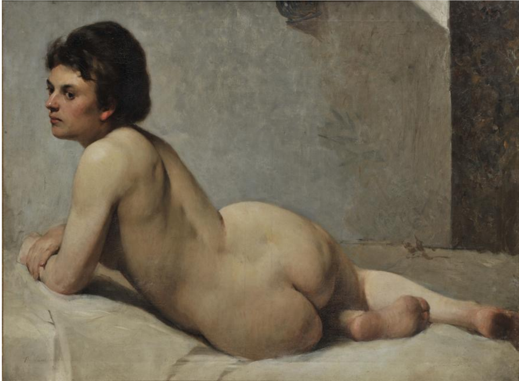
Πολυχρόνης Λεμπέσης Γυμνό , π. 1877, λάδι σε μουσαμά, 87 x 116 εκ. Εθνική Πινακοθήκη-Μουσείο Αλεξάνδρου Σούτσου