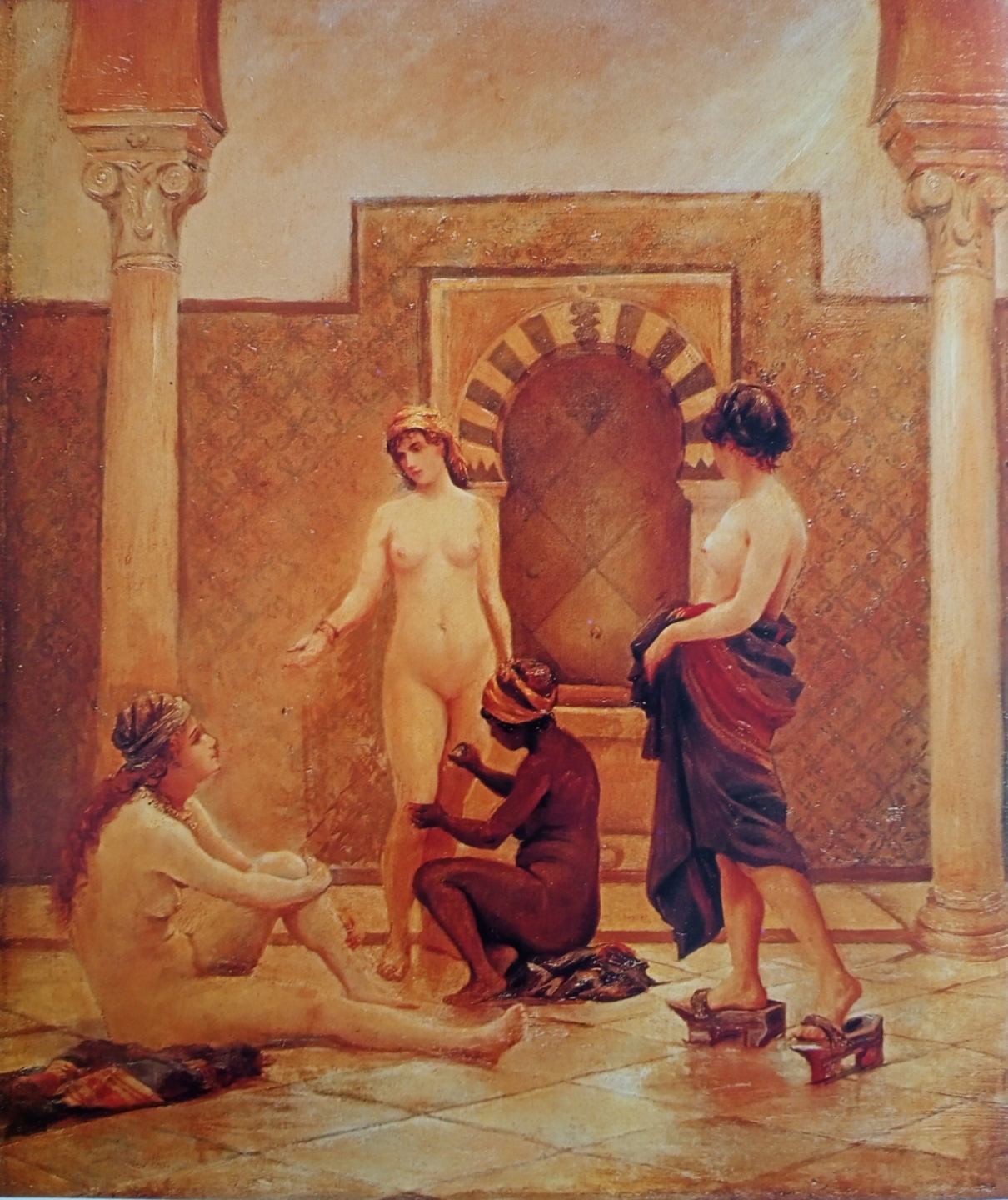
Θεόδωρος Ράλλης Ανατολίτικο λουτρό, π. 1880-1890, λάδι σε μουσαμά, 56 x 46,5 εκ., Πινακοθήκη Ε. Αβέρωφ, Μέτσοβο