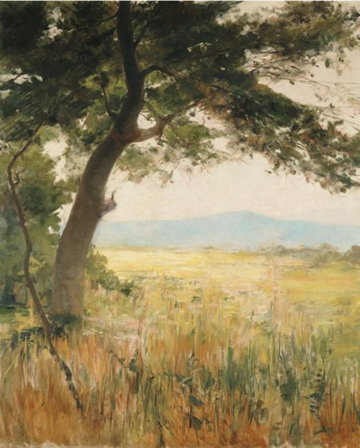
Οδυσσέας Φωκάς Υμηττός, π. 1900, λάδι σε μουσαμά, 133 x 112 εκ., Εθνική Πινακοθήκη- Μουσείο Αλεξάνδρου Σούτσου