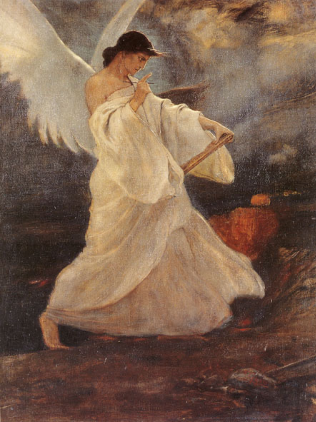
Νικόλαος Γύζης Η Δόξα των Ψαρών Εθνική Πινακοθήκη- Μουσείο Αλεξάνδρου Σούτσου