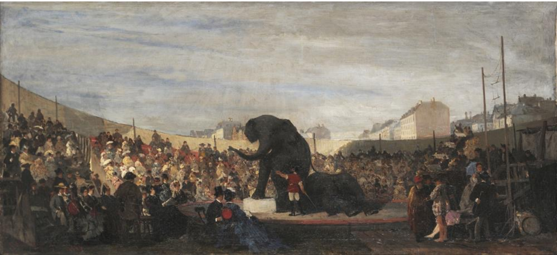
Κωνσταντίνος Βολανάκης Πανηγύρι στο Μόναχο, 1876, λάδι σε μουσαμά, 60 x 130 εκ. Εθνική Πινακοθήκη-Μουσείο Αλεξάνδρου Σούτσου