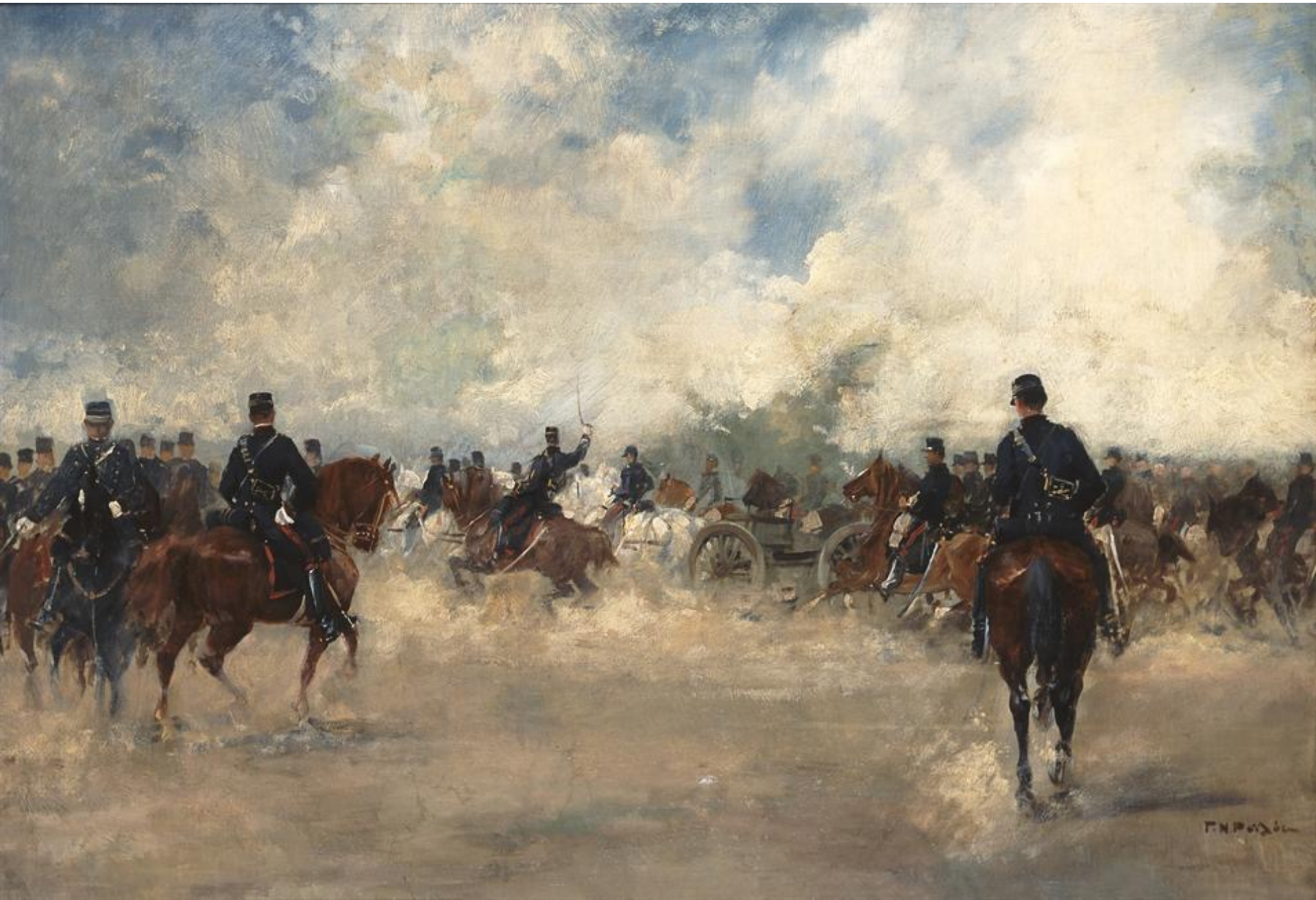
Η μάχη των Φαρσάλων, 1897-1903, λάδι σε μουσαμά, 38 x 55 εκ., Εθνική Πινακοθήκη-Μουσείο Αλεξάνδρου Σούτσου