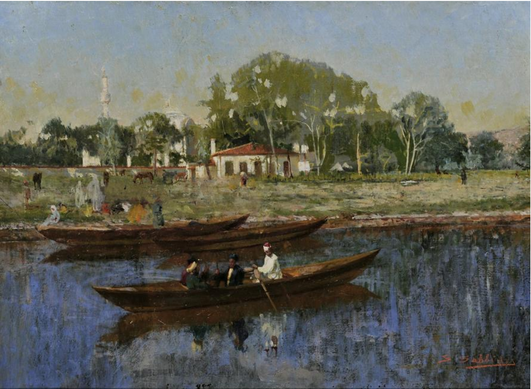
Συμεών Σαββίδης Βάρκες στα νερά του Βοσπόρου, 1907, λάδι σε μουσαμά επικολλημένο σε χαρτόνι, 35 x 50 εκ., Εθνική Πινακοθήκη-Μουσείο Αλεξάνδρου Σούτσου