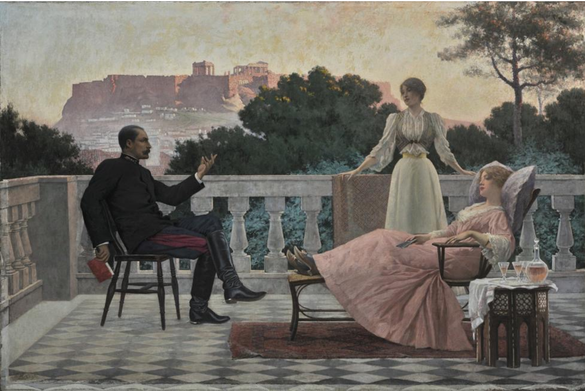
Ιάκωβος Ρίζος Στην τσάρατσα , 1897, λάδι σε μουσαμά, 111 x 167 εκ., Εθνική Πινακοθήκη-Μουσείο Αλεξάνδρου Σούτσου