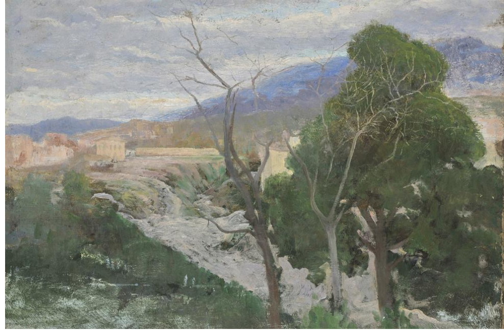
Τοπίο Αττικής , λάδι σε μουσαμά, 34 x 47 εκ., Εθνική Πινακοθήκη- Μουσείο Αλεξάνδρου Σούτσου

Συγκαταλέγεται στους πρωτοπόρους Έλληνες τοπιογράφους του τέλους του 19ου και των πρώτων δεκαετιών του 20ού αιώνα. Στο έργο του αξιοποίησε τα νεωτεριστικά μηνύματα του γερμανικού υπαιθρισμού.