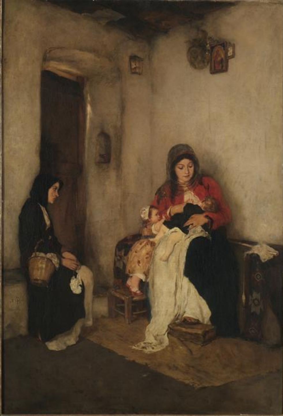
Νικόλαος Γύζης Ψυχομάννα , 1882-1883, λάδι σε μουσαμά, 105 x 73 εκ. Εθνική Πινακοθήκη-Μουσείο Αλεξάνδρου Σούτσου