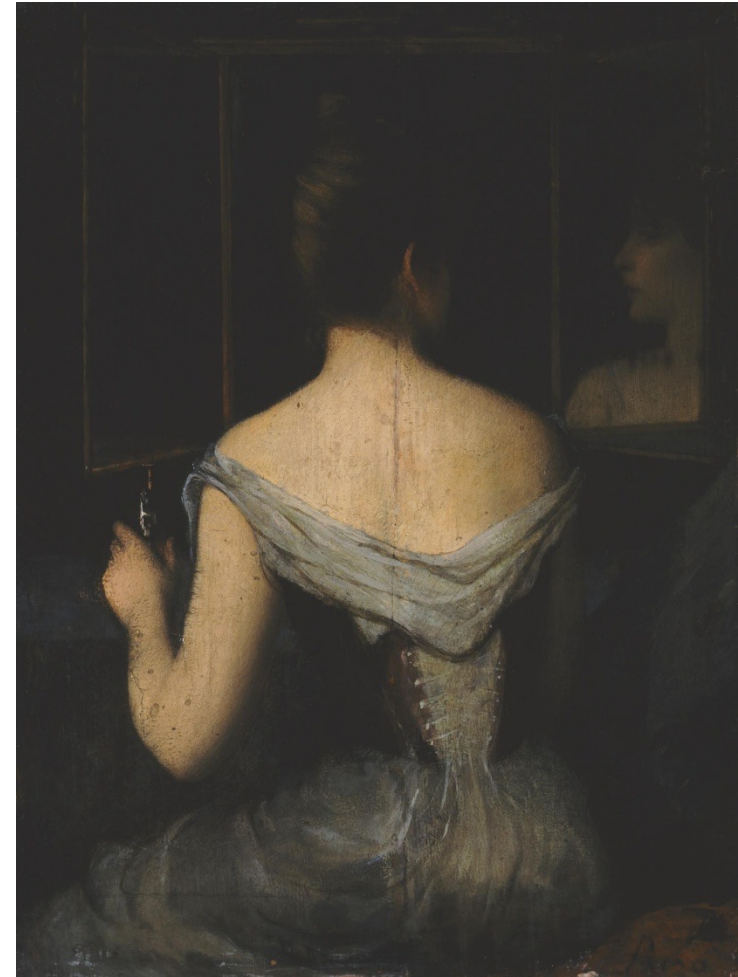
Κυρία στον καθρέφτη, λάδι σε ξύλο, 31 x 23 εκ., Εθνική Πινακοθήκη-Μουσείο Αλεξάνδρου Σούτσου

Στο έργο του κυρίαρχο ρόλο παίζουν οι κομψές γυναικείες μορφές, που εικονίζονται σε αριστοκρατικά εσωτερικά και σε ευγενικές απασχολήσεις, στο πλαίσιο της αντίληψης της Μπελ Επόκ. Σε πιο περιορισμένη κλίμακα ασχολήθηκε με το τοπίο, υιοθετώντας τις ιμπρεσιονιστικές-υπαιθριστικές αντιλήψεις.