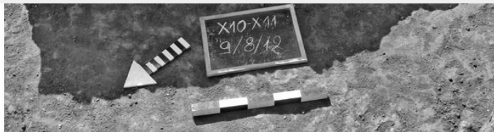
Εικ. 10. Άργος Ορεστικό, Παραβέλα (X10). Τμήμα του νέου οικοδομήματος με την κλίμακα του υπόγειου ταφικού μνημείου (2012).

Το 2010 είχε αποκαλυφθεί τοίχος παράλληλος προς τον τοίχο του βόρειου κλίτους της βασιλικής αποτελούμενος από αργούς λίθους 8 . Η περαιτέρω διερεύνηση έδειξε ότι ο τοίχος σχηματίζει με άλλον ένα ορθή γωνία στο νοτιοανατολικό του τμήμα και συνεχίζει κάτω από τη βασιλική (Εικ. 10). Στο εσωτερικό της γωνίας αποκαλύφθηκε πυκνό στρώμα καταστροφής με κεραμίδες και τρία χάλκινα νομίσματα, εκ των οποίων ένα αυτοκράτορας Βαλεντινιανού Β' (378-383 μ.Χ.) 9 ,