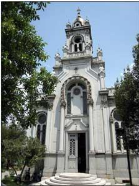
Basilique Saint Stéphane à Istanbul.