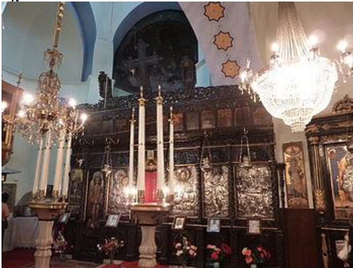
Εσωτερικό του Ναού.

Η Παναγία των Μογγολίων, ή Μουγουλίων, κοινώς Παναγία του Μουχλιού ή Μουχλιώτισσα είναι Ορθόδοξη χριστιανική εκκλησία στην Κωνσταντινούπολη , που ανήκει στο Οικουμενικό πατριαρχείο Κωνσταντινουπόλεως .