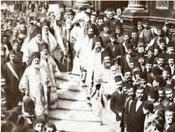
Inauguration de l'église le 08 septembre 1898.

Le montage dura un an et demi et fut terminé en 1898. Le bâtiment est long de 32.50 mètres, large de 12.50 mètres et haut (avec le clocher) de 40 mètres. Le poids total est de 500 tonnes et l'enceinte peut accueillir 600 personnes. De style néo-classique et néo-baroque, l'église est faite de structures d'acier recouvertes de plaques de tôle et de fonte, maintenues par des boulons et des soudures. Elle est richement décorée de fer forgé. L'intérieur venait aussi de Vienne – des colonnes corinthiennes, des anges, des motifs floraux soudés ou arrimés par des boulons. Le style de l'intérieur porte l'influence de l'Art nouveau, dont il est le premier exemple à Istanbul. L'iconostase viennoise avait été faite en style catholique. Le secrétaire de l'Exarchat Athanase Chopov et l'architecte Aznavour furent obligés d'aller en Russie pour commander une iconostase orthodoxe. Elle fut réalisée par la firme moscovite de Nikolai Ahapkin avec des icônes peintes par le peintre russe Klavdyi Lebedev. Les six cloches furent moulées aussi en Russie à Yaroslav dans l'usine de Peter Olvyanchikov.