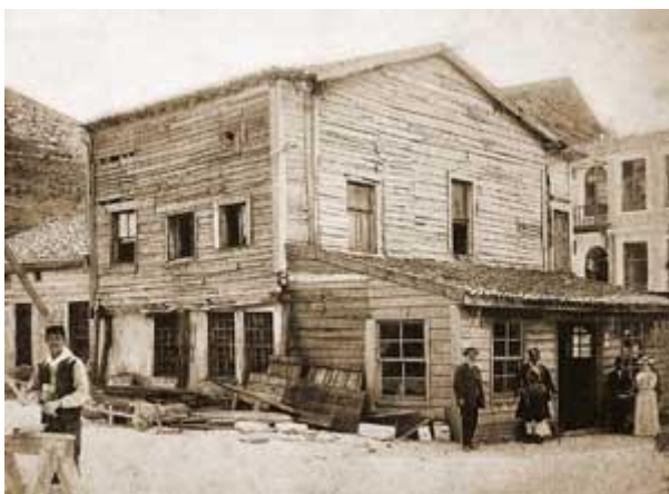
L'église bulgare en bois en 1892.