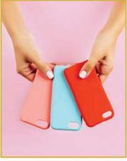
Cep telefonu kılıfı