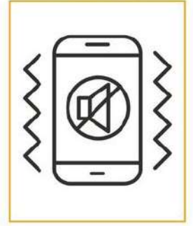
Sessize / titreşime almak