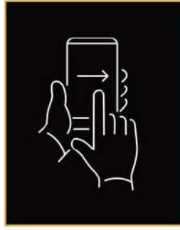
Telefonun kilidini açmak