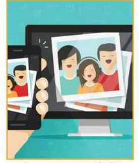
Ekran çözünürlüğü (1080p / 4K)