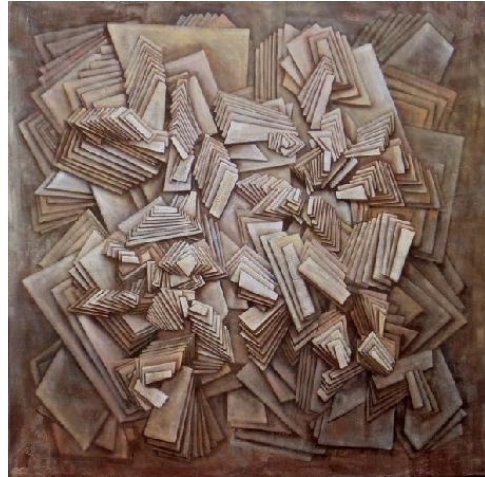
Εικόνα 4. Ο όρος "footing" θυμίζει αλλαγή στη στάση του σώματος.

(Kulick, 2005). Στο πλαίσιο αυτό είναι χρήσιμο να παραθέσουμε απόσπασμα από το σύστημα που αναπτύχθηκε από τον Gail Jefferson (1984) για την καταγραφή αυτών που συνήθως μένουν απέξω κατά στην καταγραφή μιας συνέντευξης.