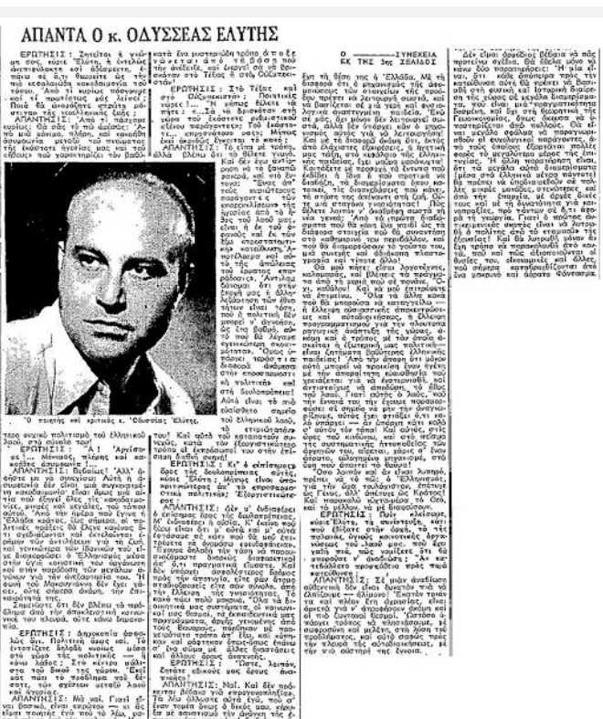
Εικόνα 1. Απόσπασμα από την εφημερίδα Ελευθερία . Συνέντευξη του Οδυσσέα Ελύτη στον συγγραφέα Ρένο Αποστολίδη (15 Ιουνίου 1958).

Οι ερωτήσεις, σύμφωνα με τον Patton (1990) μπορεί να είναι ερωτήσεις background, ερωτήσεις γνώσεων, ερωτήσεις σχετικές με τις εμπειρίες ή τις συμπεριφορές των ερευνούμενων, ερωτήσεις σχετικά με τις γνώμες, τις απόψεις, και τις αξίες τους και τέλος, ερωτήσεις σχετικές με στάσεις, συναισθήματα, και ιδεολογήματα. Παράλληλα, όμως, ο ερευνητής προσέχει τις εντυπώσεις που ίσως δημιουργεί ο ίδιος κατά τη διάρκεια της συνέντευξης. Έχει επίσης υπόψη του θέματα τα οποία είναι καλύτερα να μην αγγιχτούν. Έχει τέλος υπόψη του ότι μέσω λεκτικών αλλά και μη λεκτικών μηνυμάτων είναι δυνατόν να προκαλέσει στρεβλώσεις και ότι πάντα ελλοχεύει ο κίνδυνος για μικρές ή