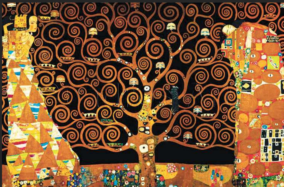
El árbol de la ciencia (1909). Gustav Klimt