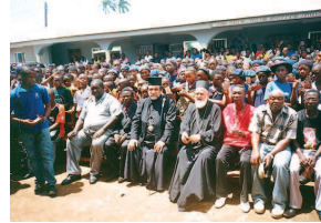
Στιγμιότυπο από την επίσκεψη του μητροπολίτη Γκνάβας Δαμασκηνού στην Ορθόδοξη Ιεραποστολή στην Ακτή του Ελεφαντιστού και τη Σιέρα Λεόνε (2009)

(Διεθνές Συνέδριο Ιεραποστολής) και ιδίως του 3 ου , που έλαβε χώρα στο Ταμπαράμ της Ινδίας το 1938. Ήταν ένα οικουμενικό συνέδριο, πρόδρομος του μόνιμου οργανισμού Παγκόσμιου Συμβουλίου Εκκλησιών, αλλά εκεί οι Ορθόδοξοι ήρθαν ξανά σε επαφή με την εργώδη ιεραποστολική δραστηριότητα των άλλων εκκλησιών. Το θέμα μπήκε για τα καλά στη ζωή ορισμένων, λες και μόνο μια αφορμή ζητούσε για να αναδειχθεί. Οι συνθήκες είχαν ωριμάσει. Στο πλαίσιο του Συνδέσμου, της Παγκόσμιας Αδελφότητας Ορθοδόξων Νέων, ιδρύθηκε το 1961 στην Ελλάδα το Διορθόδοξο Κέντρο «Πορευθέντες» με πρωτεργάτες αυτής της προσπάθειας, τον νυν αρχιεπίσκοπο Αλβανίας Αναστάσιο (Γιαννουλάτο) και τον μετέπειτα καθηγητή Ιεραποστολικής στην Αθήνα Ηλία Βουλγαράκη. Το άκουσμα ήταν πρωτόκουστο, όπως ήδη τονίσαμε, καθώς η θεολογία μας τότε ήταν βαθιά ριζωμένη σε μια μιμητική