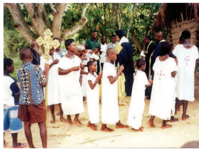
Ο μητροπολίτης Γέφυρας Αζώμων Πέτρος σε επίσκεψη του στην Ορθόδοξη ιεραποστολή στην Αντίς Αμπέμπα της Αιθιοπίας (2006)

Μαζί με το παράδειγμα του βίου της χριστιανικής κοινότητας υπήρχε μια κοινωνιολογική παράμετρος, η οποία