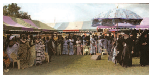
Χαιρετισμός του Πατριάρχου Αλεξανδρείας Θεοδώρου Β΄ με τον αρχηγό της φυλής Λάιτε στη Γκάνας, στο πλαίσιο των εορτασμών για τα 25 χρόνια της Ορθοδοξίας στην Γκάνα

το μοναστήρι Κύριλλου-Μπελοζέρσκι, στην όχθη της λίμνης Σιβέρσκογιε στο τέλος του 16 ου αι., ενώ από τους μοναχούς του συστάθηκαν σε έναν αιώνα άλλα δεκαεννιά μοναστήρια. Τον 14 ο αι. αξιόλογο ιεραποστολικό έργο αναπτύσσει στους Ζυριάνους ο άγιος Στέφανος της Περμ. Μετά τη μάχη του Κουλίκοβο το 1380, που ήταν το πρώτο μήνυμα για το τέλος του μογγολικού ζυγού, και τη Μεγάλη Παράταξη στον ποταμό Ούγκρα το 1480, όπου οι Ρώσοι κέρδι-