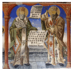
Οι άγιοι Κύριλλος και Μεθόδιος, ευαγγελιστές των Σλάβων, εξωτερική τοιχογραφία, μονή Sveti Jovan Bigorski (ΠΑΓΜ)

Εξάλλου, η εικονομαχία που ταλαιπώρησε για δύο περίπου αιώνες την αυτοκρατορία οδήγησε σε εσωστρέφεια και αναστολή της ιεραποστολικής δράσης προς τα έξω. Εντούτοις, δύο Έλληνες μοναχοί, οι Αυγουστίνος και Θεόδωρος, εκκινώντας από τη Ρώμη,