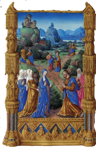
Οι Απόστολοι ξεκινούν για να κηρύξουν το Ευαγγέλιο, μικρογραφία χρ.., Très Riches Heures du Duc de Berry (μεταξύ 1411-1416), Ms. 65, f. 122v, Musée Condé, Chantilly (Παρισί)