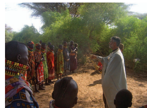
Θεία Λειτουργία στην Κένυα

Είναι επίσης σημαντικό να σημειωθεί για την περίοδο αυτή κάτι που συνήθως παρασιωπάται. Πέρα από το αποστολικό έργο των ίδιων των αποστόλων, ιδίως ασφαλώς του αποστόλου Παύλου, καθώς και του αποστόλου Πέτρου, του αποστόλου Ανδρέα, και άλλων μαθητών των οποίων τα ονόματα διασώζονται, οι πραγματικοί