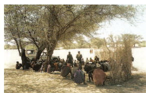
Ο μητροπολίτης Κέννας Μακάριος πραγματοποιεί το πρώτο μάθημα Κατήχησης στους ιθαγενείς της φυλής Τουρκάνα

απεσταλμένους από τη Μόσχα, ενώ μετά τη νίκη επί των Τατάρων και την κατάληψη του μουσουλμανικού Καζάν, ιδρύεται εκεί αρχιεπισκοπή το 1555 με πρώτο επίσκοπο τον ιεραπόστολο άγιο Γκούρι. Εκτός από την προσπάθεια για εκχριστιανισμό των Τατάρων, ιεραποστολικό έργο λαμβάνει χώρα και σε άλλα μη μουσουλμανικά φύλα, όπως Τσουβάσους, Μορντβίνους, Τσερεμίους και Βοτγιαίκους. Μικρότερη επιτυχία σημειώνεται μεταξύ των Τσερκέζων της Κριμαίας. Υπάρχουν