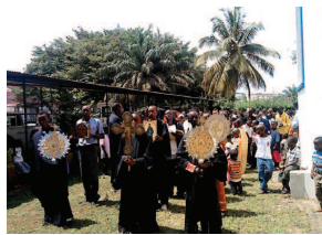
Κυριακή της Ορθοδοξίας στο Χαράρε της Ζιμπάμπουε (2011)

φωνή των ιθαγενών ενάντια στην αυθαιρεσία και την εκμετάλλευση. Έτσι, είναι χαρακτηριστική η ρήξη των ιεραποστόλων με τους εμπόρους, οι οποίοι στην περίπτωση της Αλάσκας εκτελούσαν και χρέη διοίκησης (sv). Σε κάθε περίπτωση, το θέμα της επίδρασης των σχέσεων Πολιτείας και Εκκλησίας στο πεδίο της Ιεραποστολής χρήζει περισσότερης μελέτης.