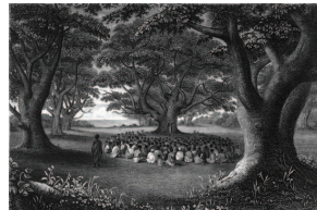
J.A. Rolph, Ιεραπόστολος κηρύσσει στη Χαβάνη, χαρακτηριστικό σε σχέδιο του Α.Τ. Agate 1845

2:34), προφανῶς επειδή δεν επέλεξε να αποδείξει τη μοναδική Του ἀλήθεια, οὔτε ὅταν Του το ζήτησαν οι διώκτες Του στον σταυρό (Λκ 23:35). Από την άποψη αυτή, η Ορθόδοξη ιεραποστολή ατενίζοντας προς το κοινό μέλλον, το βαθιά εδραιωμένο στο παρόν, ἔχει μια κατεξοχὴν προοδευτική προοπτική. Σκοπός της ιεραποστολής, ὅπως και της θεολογικής ανθρωπολογίας εν γένει, δεν είναι η επανέκρηξη ενός απολεσθέντος παραδείσου. Μια τέτοια σκέψη θα σήμαινε νοσταλγική επιστροφή στο παρελθόν, μια ματιά κατεξοχὴν συντηρητική.