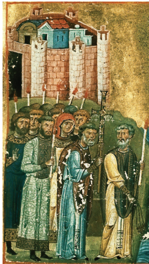
Οι άγιοι Κύριλλος και Μεθόδιος, μικρογραφία χ.φ., Μνολόγιον Βασιλείου (10 ος αι.)

7. Σε όλες τις προσπάθειες αλλαγής παραδείγματος, όπως είναι και η ιεραποστολική προσπάθεια, ο τομέας της εκπαίδευσης και ευρύτερα της παιδείας είναι ένας ακρογωνιαίος λίθος. Κάπως διαφορετικά από τη Δύση, η οποία επιχειρήσε να ελέγξει στενά τον τομέα της εκπαίδευσης, στην Ανατολή επικράτησε περισσότερο ένα ανοιχτό μορφωτικό ιδεώδες. Κλειδί για τη διαμόρφωση αυτής της στάσης αποτέλεσε η θεολογία των Καπαδοκίων κυρίως μεγάλων Πατέρων. Εδώ,