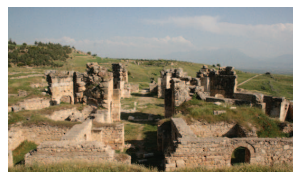
Ιεράπολη, γενική όψη του Μαρτυρίου του Αποστόλου Φιλίππου

στους επισκοπικούς καταλόγους. Κατά τον 12 ο αι. η περιοχή θα βρεθεί στη γραμμή αντιπαράθεσης Βυζαντινών, Σελτζούκων και τουρκομανικών φύλων, με αποτέλεσμα να εγκαταλειφθεί και από τους τελευταίους κατοίκους της· έτσι στα 1190 οι άνδρες της τρίτης σταυροφορίας θα τη βρουν τελείως ερημωμένη. Στα ερείπιά της εγκαθίστανται Τουρκομάνοι νομάδες μέχρι που λίγο μετά τα μέσα του 14 ου αι. θα εγκαταλειφθεί οριστικά. Η πόλη θα ξανάρθει στο φως στα τέλη του 19 ου αι. χάρη στις ανασκαφές του Γερμανού αρχαιολόγου Carl Humann. Σήμερα είναι δημοφιλής τουριστικός προορισμός και η ρωμαϊκή πόλη από το 1988 έχει ανακηρυχθεί σε μνημείο παγκόσμιας πολιτιστικής κληρονομιάς. Η πόλη γίνεται γενικώς αποδεκτή ως η γενέτειρα του στωικού φιλοσόφου Επικτήτου.