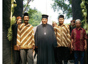
Ορθόδοξη ιεραποστολή στην Ανατολική Ιάβα

ρίλλου Ιεροσολύμων: Ιεραποστολική Θεώρηση , Θεσσαλονίκη: ΠΙΠΜ 1977. (- Κυριακίδης, Κ.), Νερό από την Ερήμο: Ιεραποστολικές Ιστορίες από τη Ζωή των Μοναχών της Αρχαίας Εκκλησίας μας , Αθήνα: Αποστολική Διακονία 2019. 1996- Ιεραποστολή: Μεθόριος Χριστιανισμού και Ελληνισμού , Αθήνα: Μαΐστρος 2007. [GB]