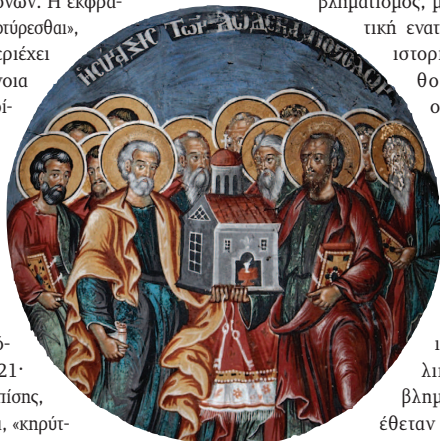
Η Σύναξη των Δώδεκα Αποστόλων, οικόγραφια (18 ος αι.), μονή Πέτρου και Παύλου Κλεινοβού, Καλαμπάκα