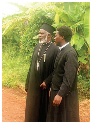
Ο μητροπολίτης Καμπάλας Ιωάννης σε επίσκεψή του στην Ορθόδοξη ιεραποστολή στο Μπουσούγκιου της Ουγκάντα (2012)

σαν χωρίς μάχη, λόγω υποχώρησης των αντιπάλων τους, οι συνθήκες διαμορφώθηκαν διαφορετικά. Στη νέα αυτοσυνειδησία και αυτοπεποίθηση προσέθεσε, κατά μία έννοια, και η πτώση της Κωνσταντινούπολης, μετά