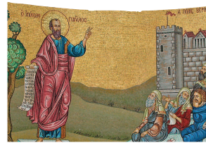
Ο Απόστολος Παύλος κηρύττει στη Βέροια (σύγχρονο ψηφιδωτό), Βέροια

14:6), λέει αυτοαναφορικά ο Χριστός, το επαναλαμβάνουμε, ο οποίος και αποκαλύπει τον Πατέρα. Στον Ορθόδοξο θεολογικό λόγο το πρόσωπο, δηλαδή η υπόσταση, η συγκεκριμένη ύπαρξη, προηγείται της ουσίας, και η υπαρξιακή προσέγγιση της ουσιοκρατίας. Η αλήθεια, συνεπώς, είναι προσωπική και είναι αλήθεια πίστωσης. Συνείπαι αυτής της παραδοχής, έναντι παλαιότερων εγχειρημάτων να αποδειχτεί η αλήθεια ή η ύπαρξη του Θεού, κατ' επίδραση της σχολαστικής θεολογίας, είναι ότι δεν ακυρώνεται, ούτε παραγράφεται η υπαρξιακή αλήθεια των προσώπων, των ανθρώπων υποκειμένων. Η ελεύθερη αποδοχή μιας αλήθειας πίστωσης συνεπάγεται και τον σεβασμό όσων έχουν μια διαφορετική θεώρηση στη ζωή. Κατ' αυτόν τον τρόπο διασφαλίζεται το κεκτημένο ενός σύνθετου και πλουραλιστικού κόσμου, ξένου προς κάθε μορφής ολοκληρωτισμό, και συνάμα ο άνθρωπος δεν παραιτείται από την επιθυμία του για ερμηνεία του κόσμου και κατ' επέκταση για αναζήτηση ταυτότητας. Έτσι, και ο πιστός άνθρωπος,