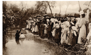
Ο ιεραπόστολος Erik Jansson στο Guarany της Βραζιλίας (φωτο του 1910)

Τούτη την περίοδο εδραιώνονται τα χαρακτηριστικά της Ορθόδοξης ιεραποστολής, που έκτοτε τη συνοδεύουν πάντοτε. Πρόκειται για το βάθος της επικοινωνίας που επιδιώκεται με τους λαούς δέκτες του ιεραποστολικού μηνύματος, μέσω της γλώσσας, του μεταφραστικού μόχθου, μέσω της ενσωμάτωσης χαρακτηριστικών στη λατρευτική παράδοση, έτσι που οι νεοεισερχόμενοι στην πίστη και αφομοιώνουν πραγματικά και καθιστούν δική τους τη νέα πίστη, η οποία