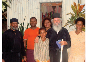
Ο μητροπολίτης Κορέας Αμβρόσιος σε επίσκεψή του στην Ορθόδοξη ιεραποστολή στη νήσο στη Lautoka των νήσων Φίτζι (2011)

στα ζητήματα της ιεραποστολής. Ζητούμενο στη σύγχρονη ιεραποστολή δεν είναι ένας υψηλός σε ποσότητα και ένταση ακτιβισμός, καρπός ενός ζήλου «οὐ κατ' ἐπίγνωσιν», αλλά ένα