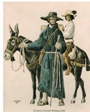
Φραγκισκανός ιεραπόστολος στη Νότια Αμερική, επιχρωματισμένη λιθογραφία (19 ος αι.)

Το άνοιγμα του ρωσικού μετώπου. Στις αρχές του 20 ου αι. ο Σμιρνόφ (ES 1903) γράφει μια Ιστορία των Ρωσικών Ιεραποστολών, εν γνώσει του και ακριβώς για τον λόγο ότι δεν υπάρχει άλλη. Μερικές δεκαετίες αργότερα, ο