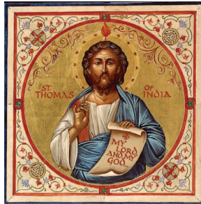
Ο Απόστολος Θωμάς, κατά την παράδοση ευαγγελιστής των Ινδών

λειτουργεί ως πρότυπο παρακίνησης, ώστε παρατηρείται και επαναλαμβάνεται ένα μοτίβο με βάση το οποίο ένα μαρτύριο το ακολουθούν και άλλες μεταστροφές, ενίοτε και δεσποφυλάκων, δικωτών ή και δημίων ή διατηρεί μια αίγλη στο διηνεκές.