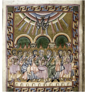
Η Πεντηκοστή, μικρογραφία χφ. Ευχολογίου (β' μισό 11 ου αι., προέλευση Γερμανία), Harley 2908, f. 69v, British Library (Λονδίνο)

αποκλειστικού μοιάζει με κατάλοιπο άλλων εποχών, ιδέα αποθνηπτική στον σύγχρονο άνθρωπο. Εντούτοις, και η ιδέα της πολλαπλότητας οδήγησε σε αλληπάλπλα φιλοσοφικά ρεύματα και τάσεις, οι οποίες εκφράστηκαν και μέσω της τέχνης και της λογοτεχνίας, και συνδέονται με έναν αγνωστικισμό,