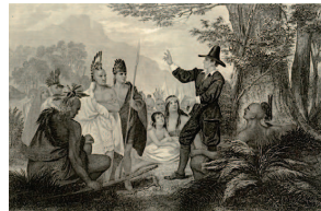
Ο ιεραπόστολος David Brainerd κηρύσσει στους Ινδιάνους, εικονογραφία του 18 ου αι.

Το κίνητρο. Όπως λέγει ο απόστολος Παῦλος, «εἴτε προφάσει εἴτε ἀληθείᾳ, Χριστὸς καταγγέλλεται» (Φιλ 1:18). Ο ίδιος καταγράφει στη συγκεκριμένη συνάφεια ποικίλα, ὅχι πάντα θετικά, κίνητρα ιεραποστολής, ανάμεσά τους την ἔριδα και το φθόνο. Και παρά το ότι μοιάζει να επικεντρώνεται στο τε-