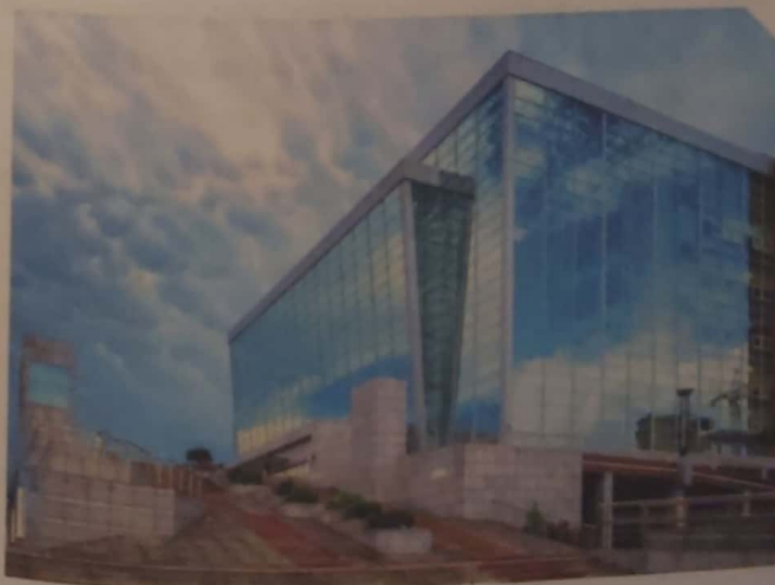
Приморская сцена Мариинского театра

Три сцены театра — Большой зал, Малый зал и Летняя площадка — принимают актёров театра, артистов оперы и балета, исполнителей инструментальной и хоровой музыки. Большой зал театра имеет форму классической итальянской подковы horseshoe с четырьмя ярусами балконов более чем на 1300 мест. Внутренняя отделка зала — это панели из натурального дерева светлых тонов, что дарит первоклассное качество звука, а подвесной вантовый потолок делает всё пространство лёгким и воздушным.