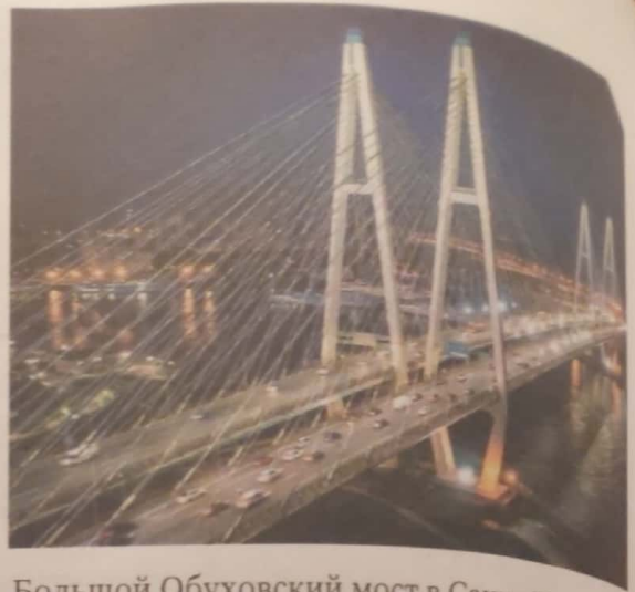
Большой Обуховский мост в Санкт-Петербурге