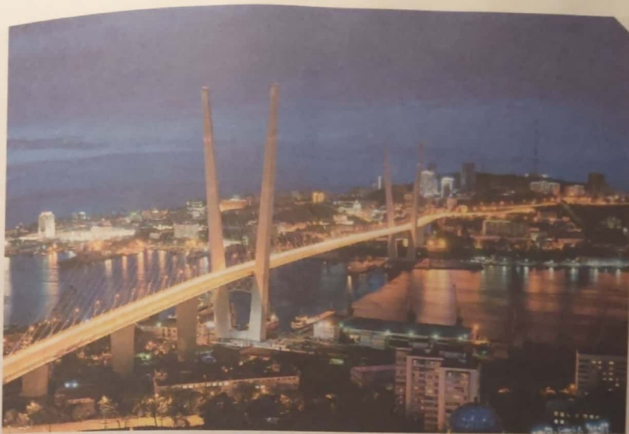
Золотой мост во Владивостоке

Например, Золотой мост через бухту Золотой Рог horn соединил центральную часть Владивостока и район мыса Чуркина. Раньше дорога туда на машине занимала полтора часа, сейчас — только 5 минут. Длина моста — почти 1400 метров, опоры держат его над водой на высоте 65 метров. Благодаря новому мосту район мыса Чуркина стал важным центром культурной жизни города, здесь появился театр оперы и балета — Приморская сцена (А) _____ театра.