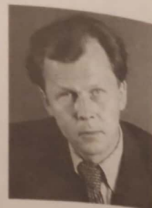
Александр Твардовский, поэт

Санкт-Петербург и Владивосток — города очень разные, но поэт Александр Твардовский говорит, что они «братья». Санкт-Петербург (советское название — Ленинград) — это центр, культурное сердце России, а Владивосток — город-порт на Дальнем Востоке, конечная точка самой длинной железной дороги в мире — знаменитой Транссибирской магистрали. Расстояние между ними почти 10 000 километров. Чем они могут быть похожи друг на друга?