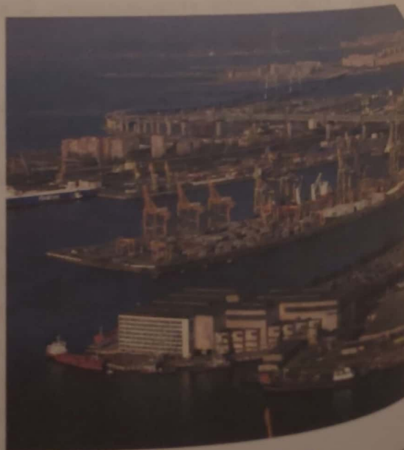
Морской порт Санкт-Петербурга