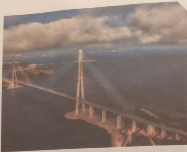
Мост на остров Русский во Владивостоке