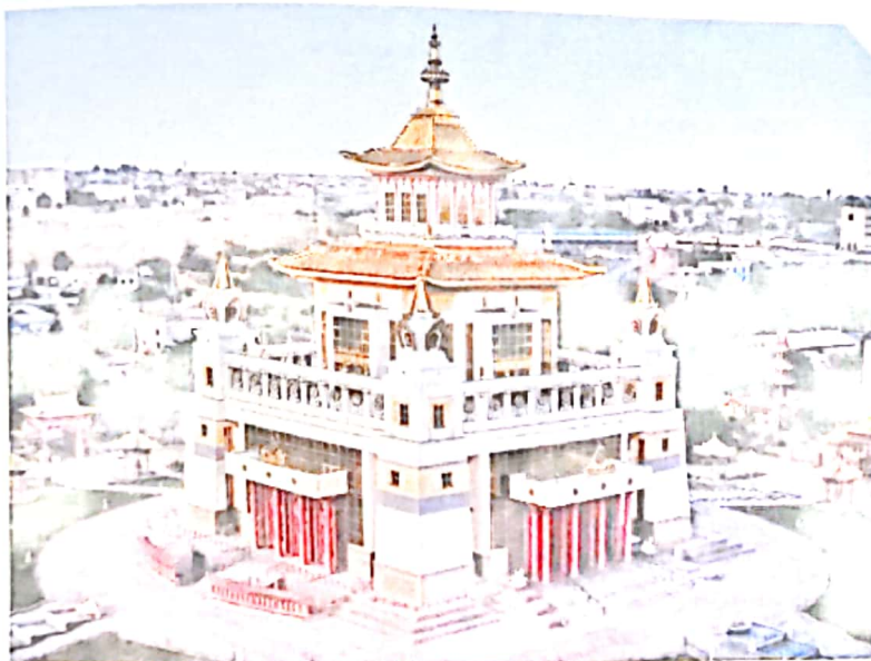
Золотая обитель Будды Шакьямуни