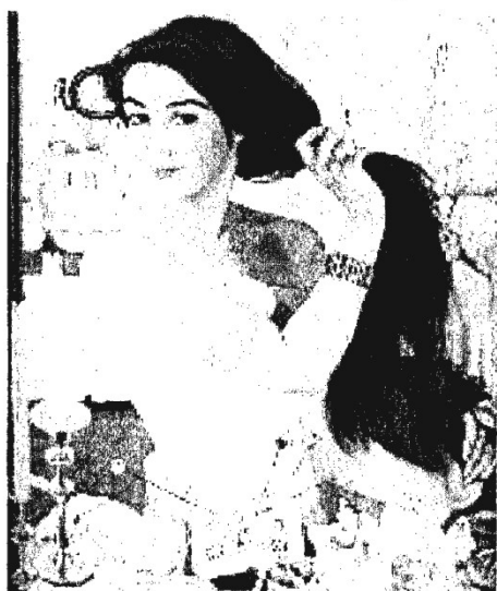
З.Е. Серебрякова. Автопортрет