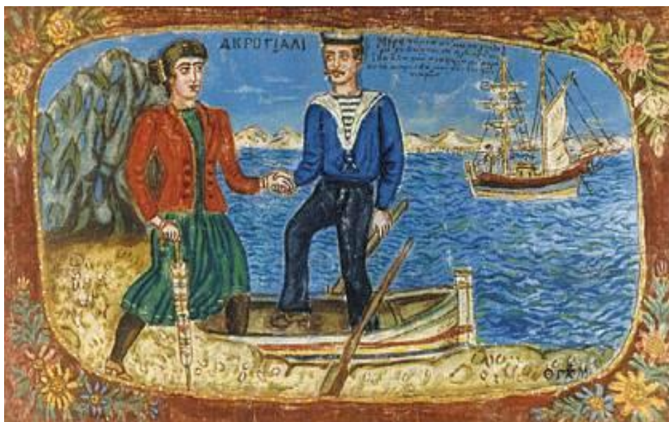
Ακρογιάλι». Ελαιογραφία σε ύφασμα

Woodard, L. J. (2004). Sexuality and disability. Clinics in Family Practice , 6, 941–954.