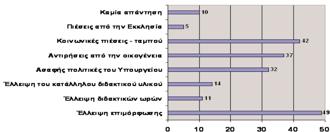
Σχήμα 3. Ανασταλτικοί παράγοντες 53 για την εφαρμογή σεξουαλικής αγωγής

Τα εμπόδια (σχ. 3) που λειτουργούν ανασταλτικά στην εισαγωγή της σεξουαλικής αγωγής στο δημοτικό σχολείο ήταν μια άλλη ερώτηση αυτής της έρευνας (ανοικτή ερώτηση, Παράρτημα Β, ερώτηση 23).