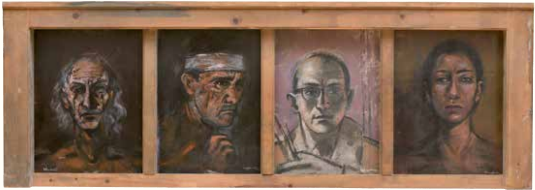
→ Τέμπλο – τέσσερα κεφάλια, 1994