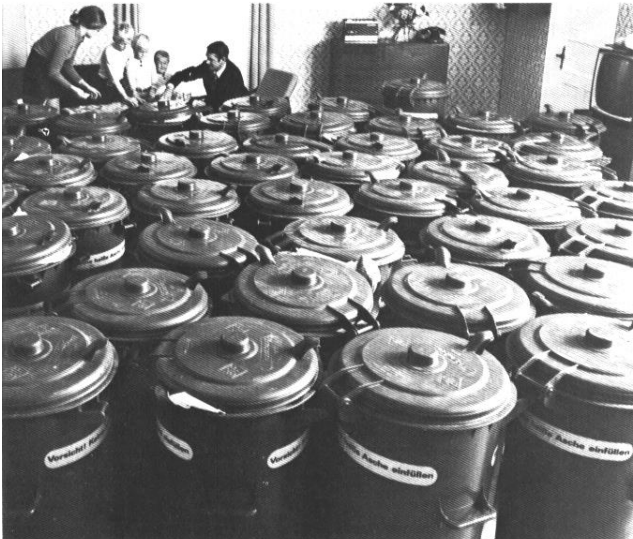
Günter Haaf: Rettet die Natur, München 1985 [Heyne Sachbuch 01/7265], S. 143.

Jeder Bürger der Bundesrepublik Deutschland wirft im Jahr durchschnittlich 360 Kilogramm Abfall in den Müll. Bei einer fünfköpfigen Familie kommt eine »Jahresproduktion« von rund 60 Mülltonnen mit je 30 Kilogramm Fassungsvermögen zusammen.