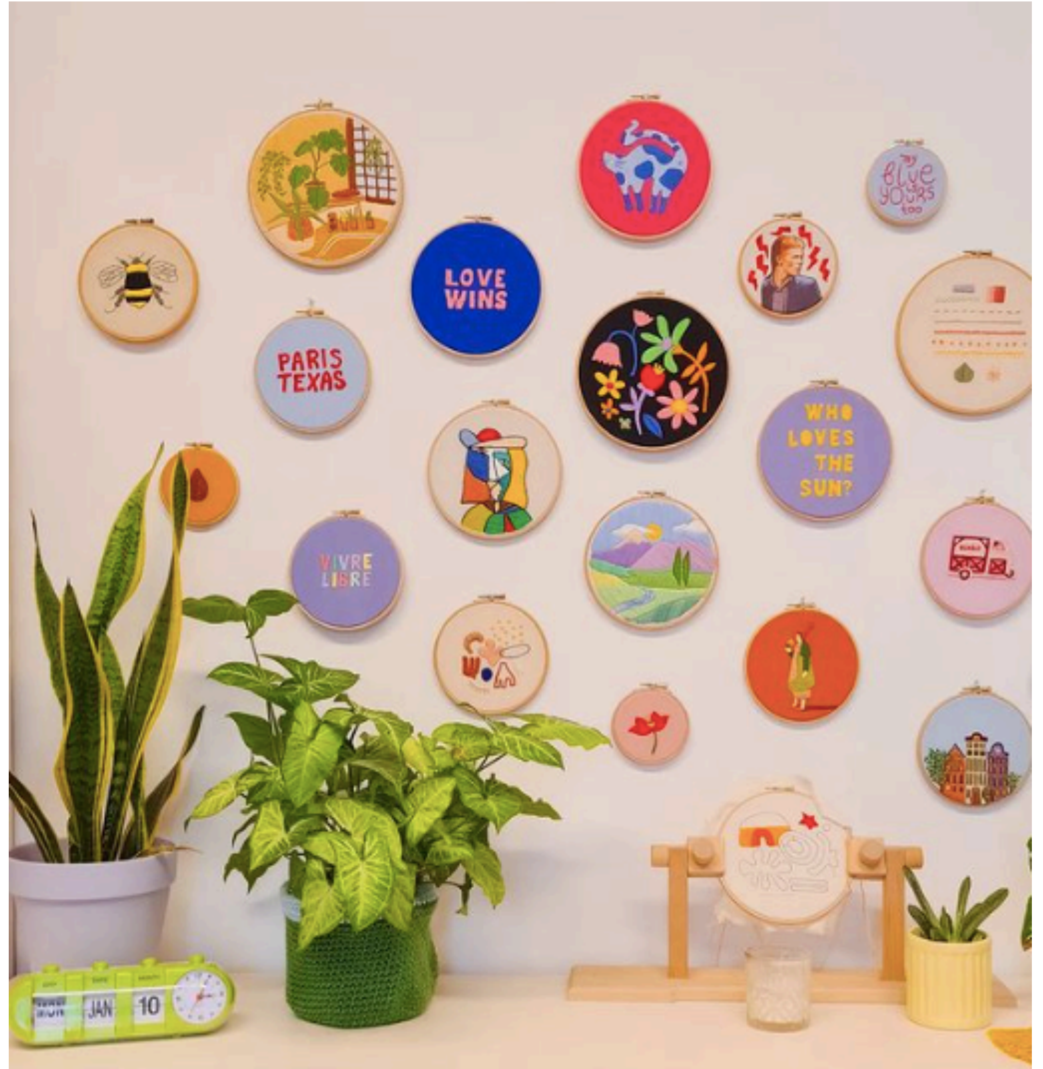
A shiny day (link)