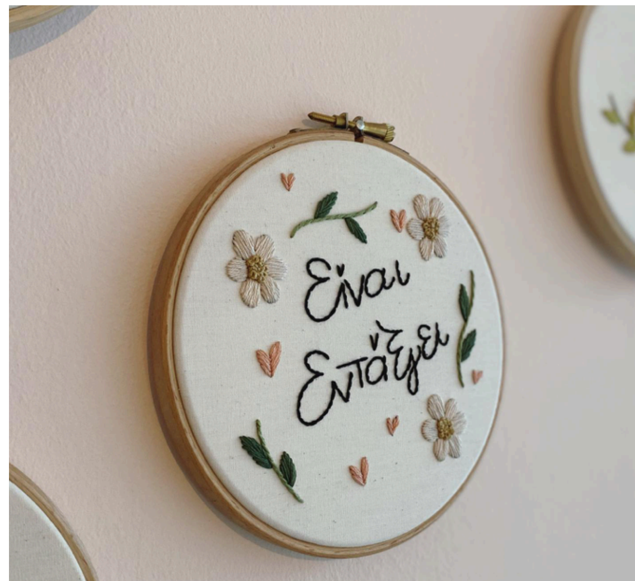
The greek stitch ( link )