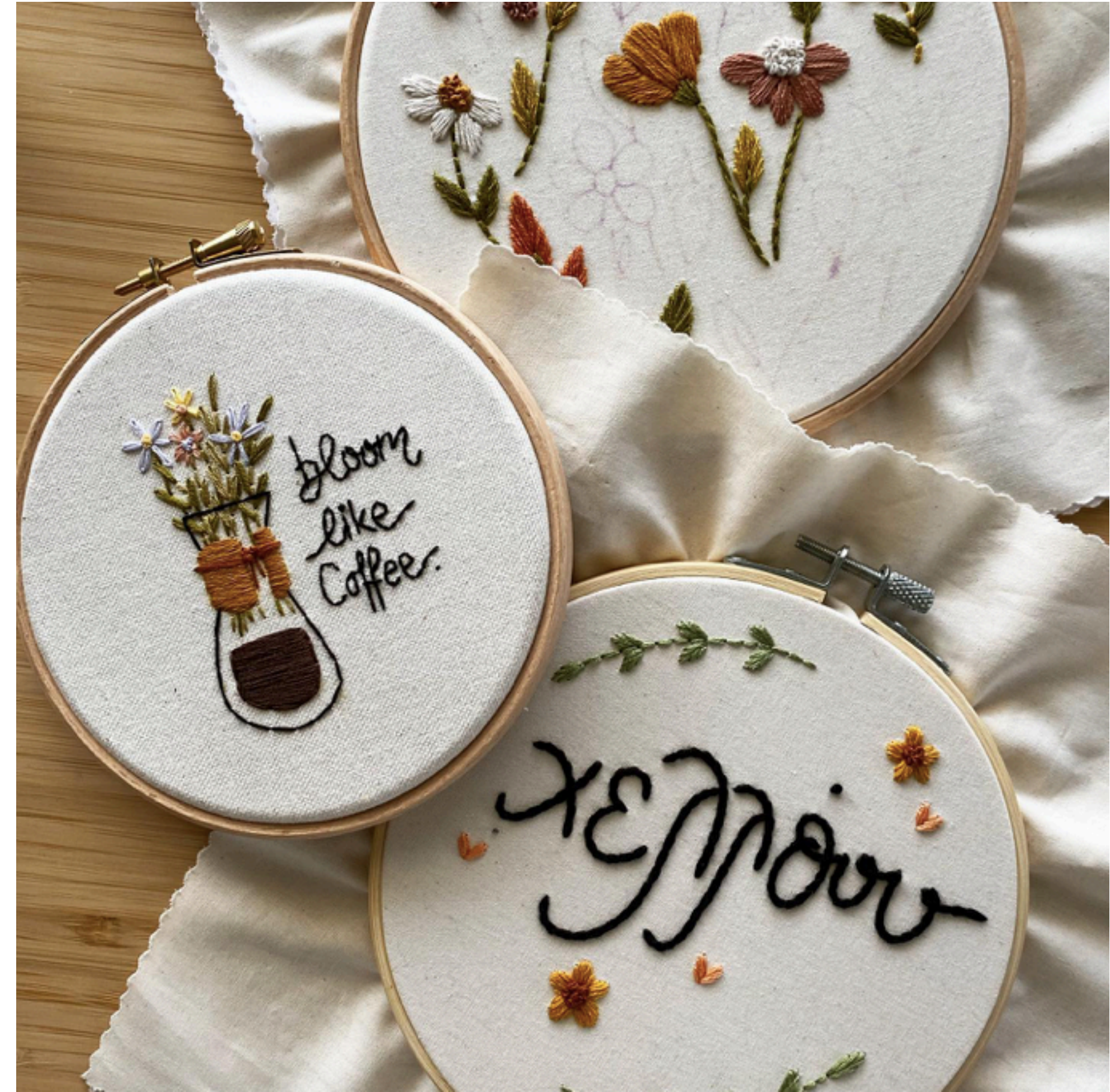
The greek stitch ( link )