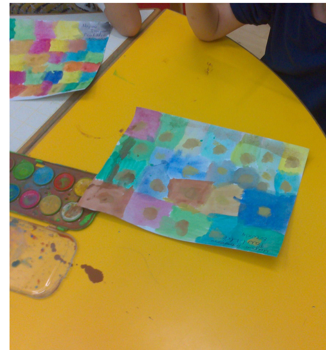
Άκατα Μάκατα Νηπιαγωγείο στη Λάρισα