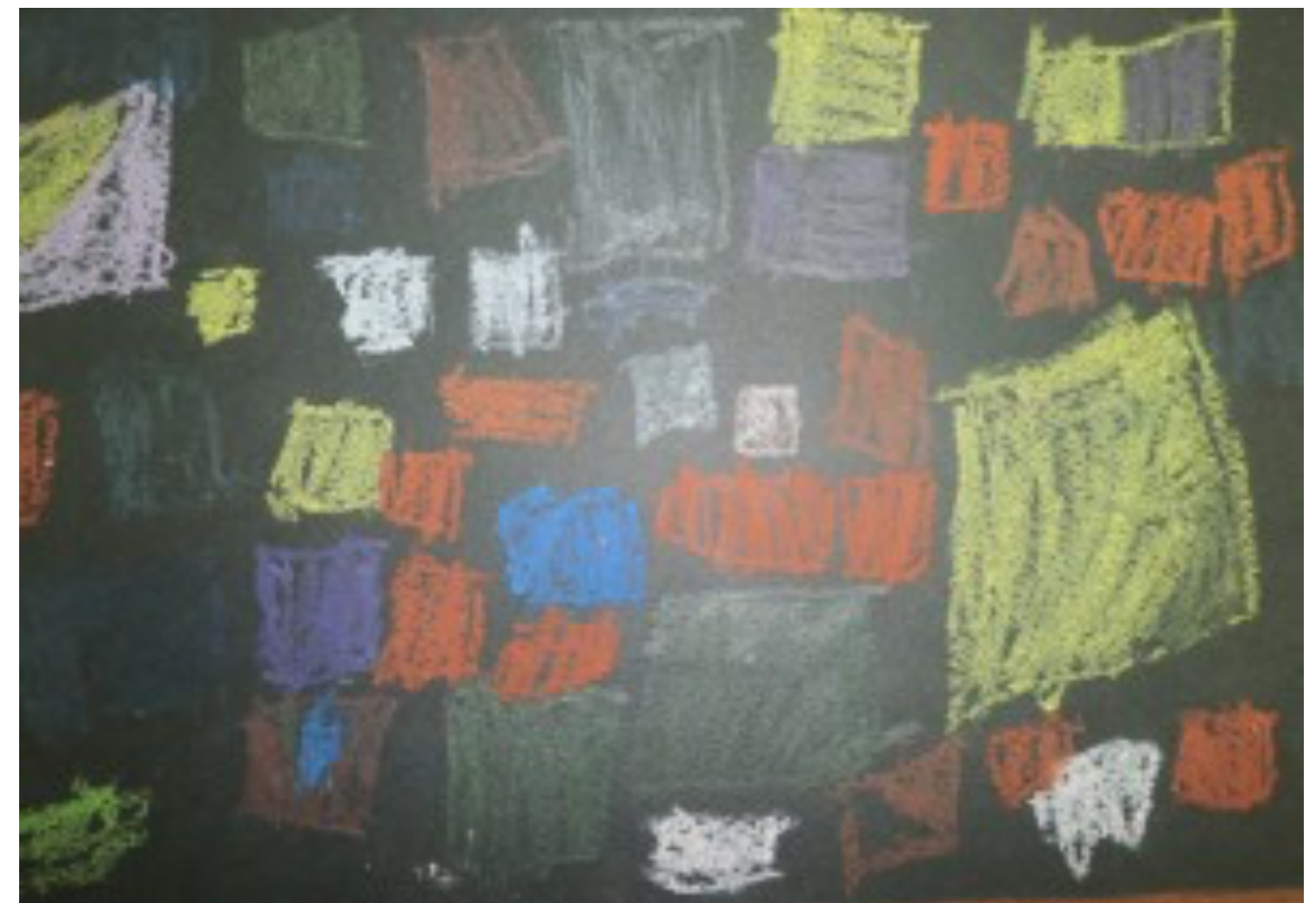
36ο Νηπιαγωγείο Αθήνας