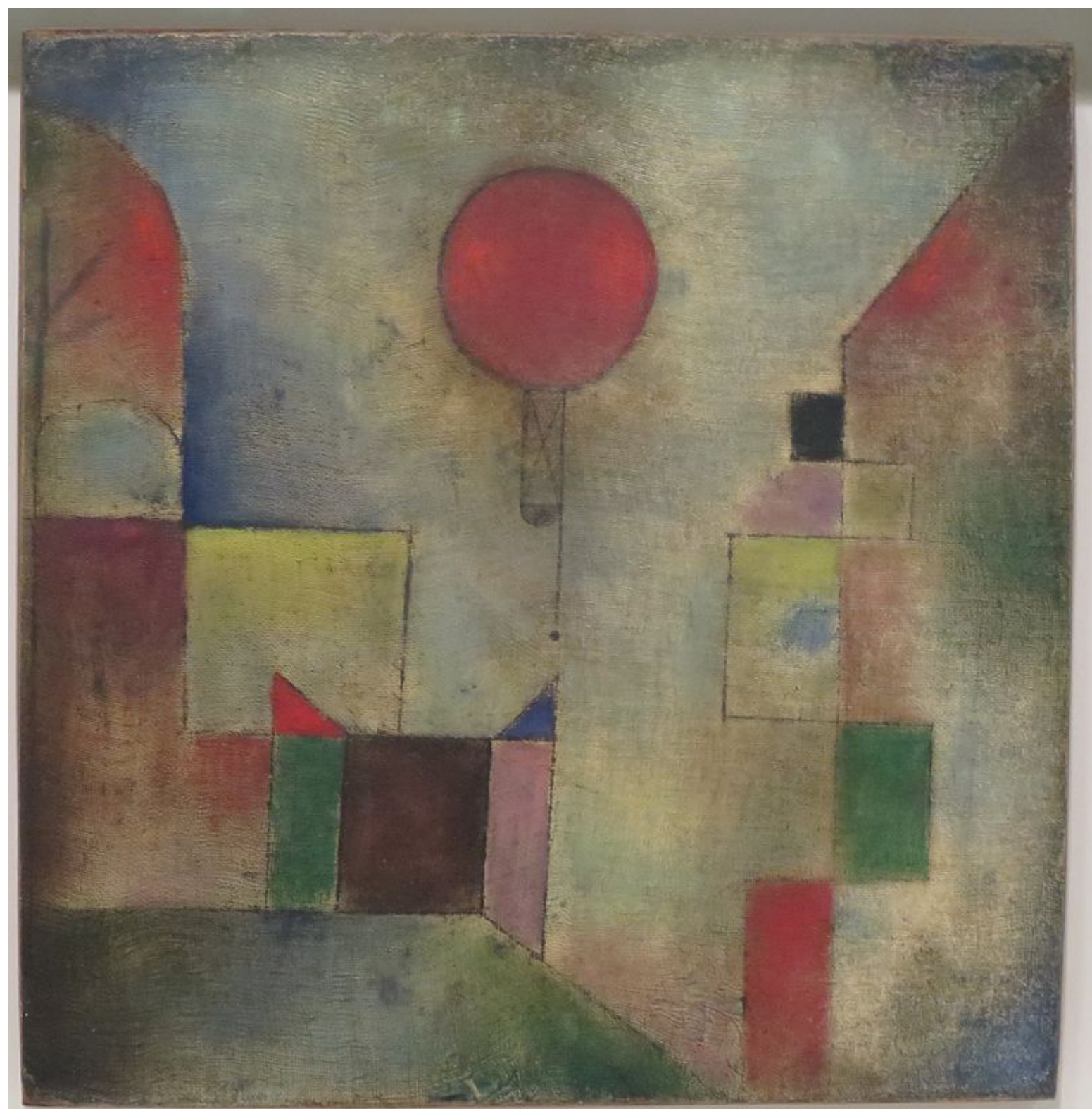
Το κόκκινο μπαλόνι (1922)