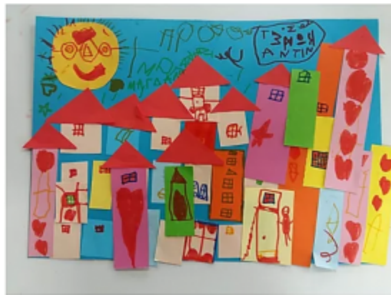
Το Παραμύθι Νηπιαγωγείο στην Πάτρα