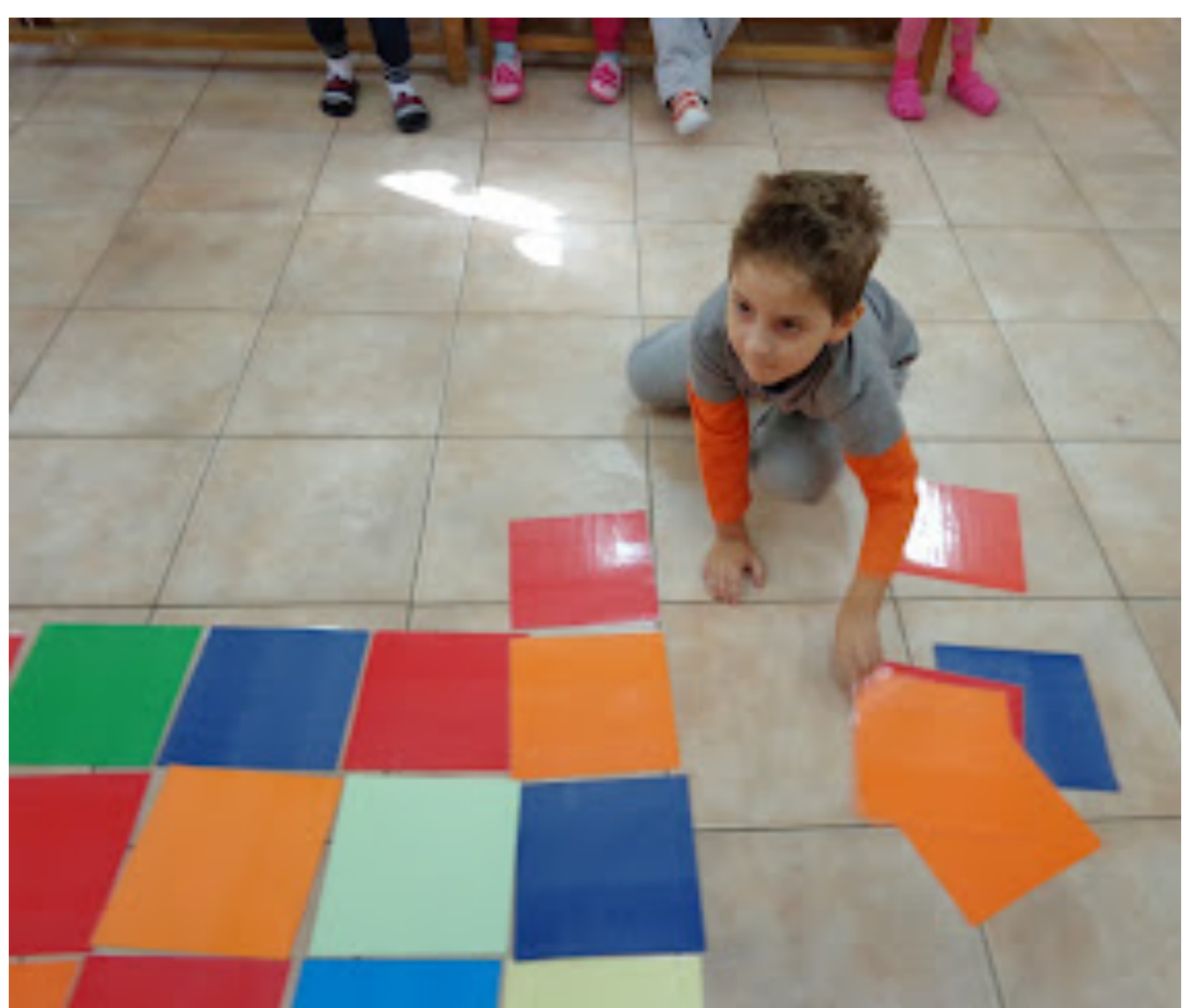
13ο Νηπιαγωγείο Αχαρνών