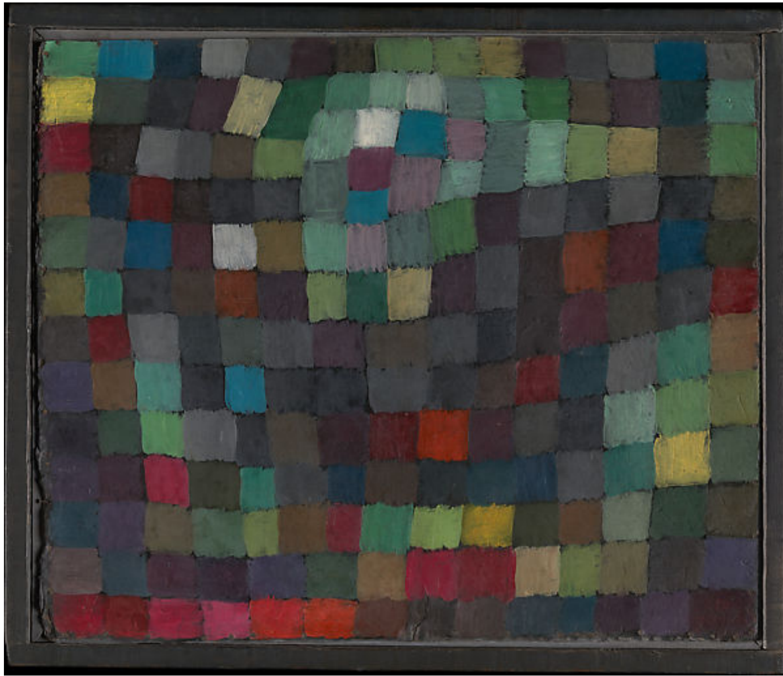
May Picture (1925)