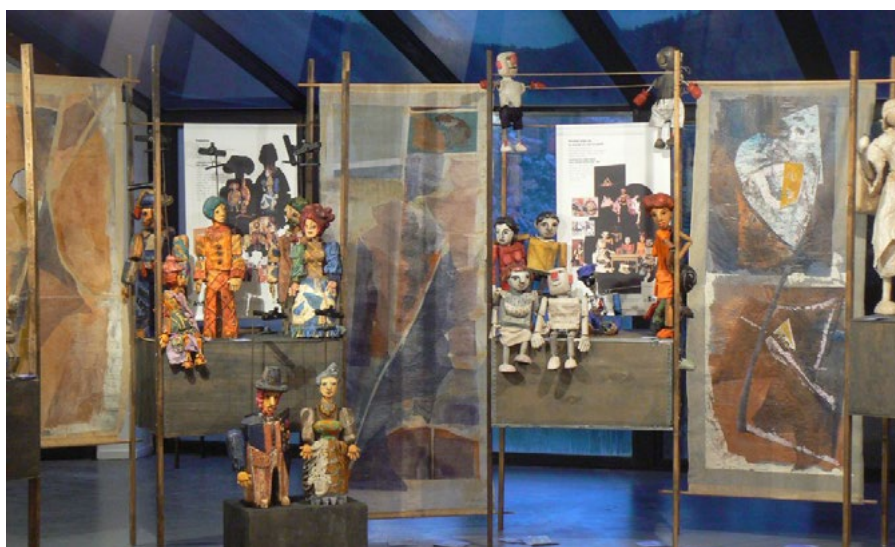
Exposition permanente de prototypes Arketal

Il y a un petit studio de répétition. Des marionnettes de recherche et des prototypes sont exposés en permanence. Une bibliothèque d'ouvrages sur le Théâtre de marionnettes, le Théâtre, les Arts Plastiques et les Contes sont à la disposition des stagiaires.