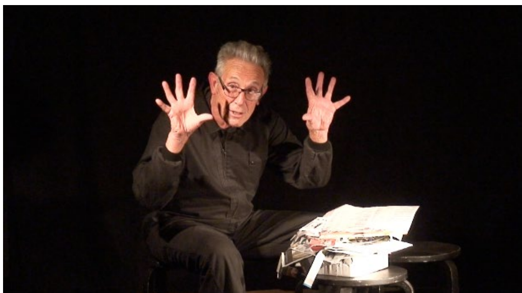
Joan Baixas – artiste catalan

Cette année (2017) Joan Baixas vient avec pour la première fois avec le programme « Oh la la La marionnette ».