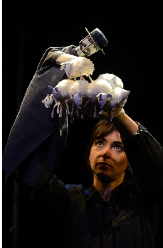
L'homme qui plantait des arbres 4

projet personnel. Ces stages, ont lieu en dehors des périodes de formation habituelles et offrent aux élèves une immersion totale, propice à la création comme à l'approfondissement des connaissances.