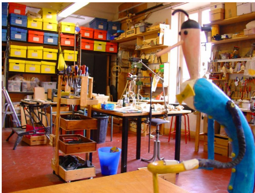
Atelier de Arketal

Il y a un petit studio de répétition. Des marionnettes de recherche et des prototypes sont exposés en permanence. Une bibliothèque d'ouvrages sur le Théâtre de marionnettes, le Théâtre, les Arts Plastiques et les Contes sont à la disposition des stagiaires.