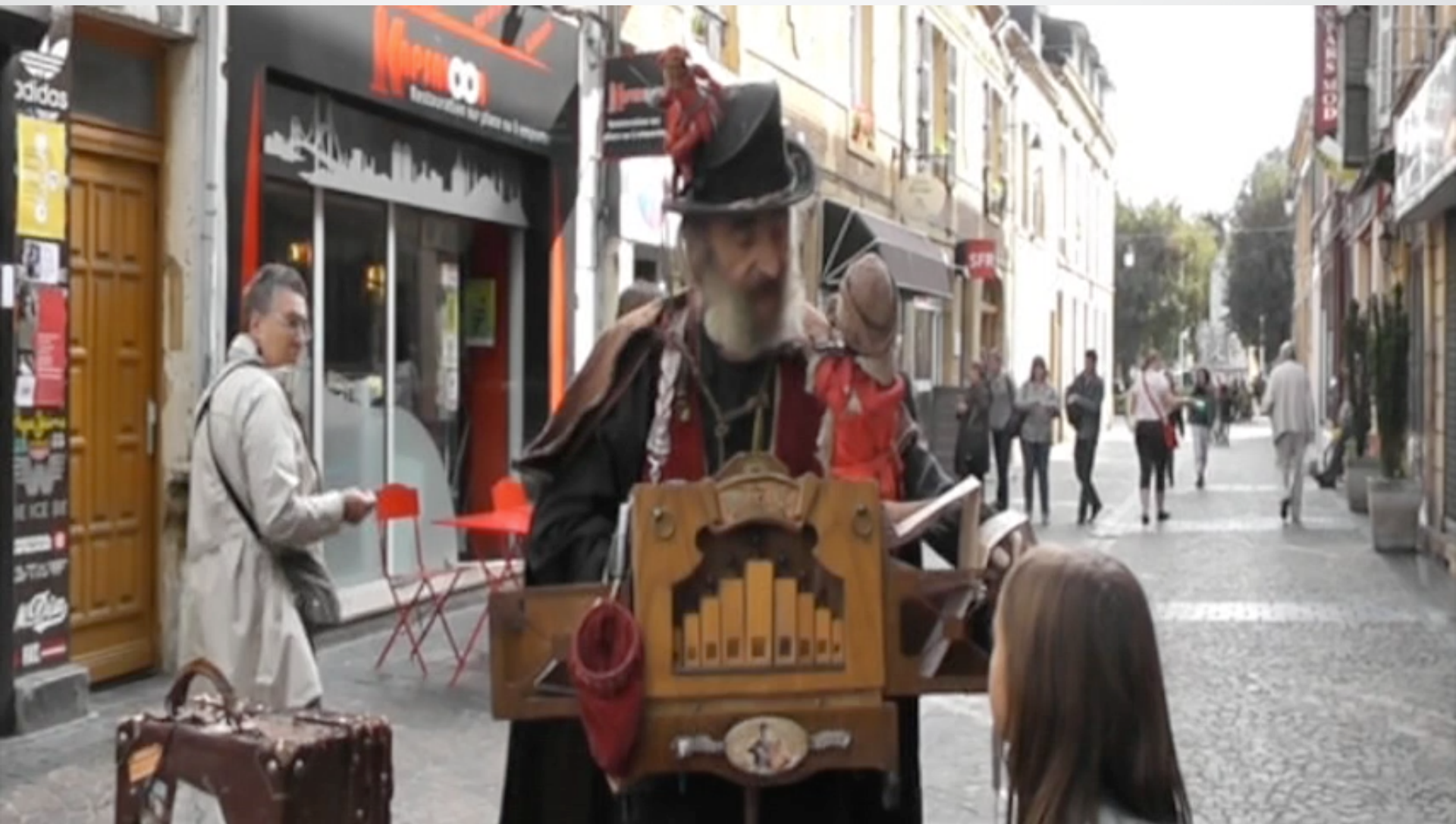
Διεθνές Φεστιβάλ μαριονέτας Charleville- Mézière 1996