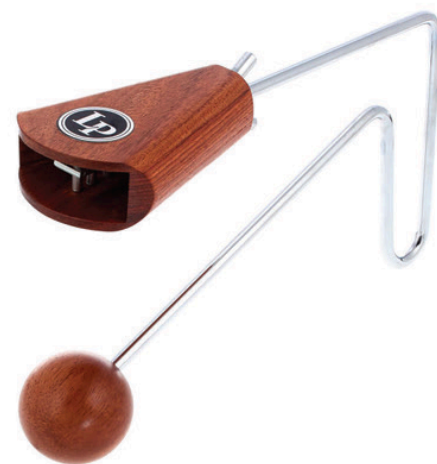
α) κλαβες, β) ντέφι, και γ) βάιμπρασλαπ.