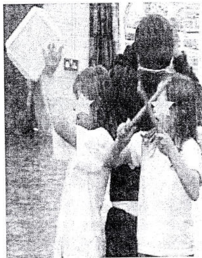
Φωτ. 4: Χρήση ηχηρών αντικειμένων στο πλαίσιο μαθήματος μουσικοκινητικής αγωγής