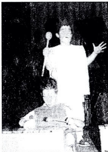
Φωτ. 1: Ρυθμική απαγγελία με μουσική συνοδεία (μαθητές νηπίου)