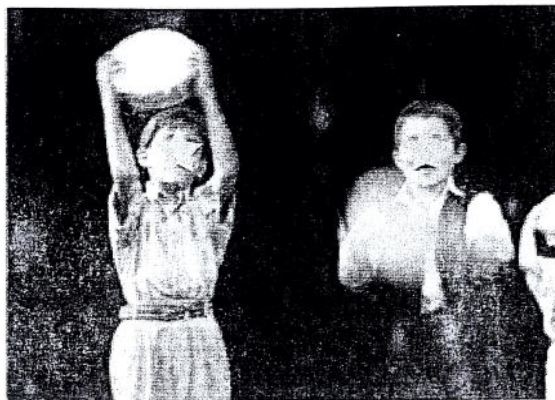
Φωτ. 2: Κίνηση με ταυτόχρονη ρυθμική απαγγελία και συνοδεία από χειροτόμπανα (μαθητές νηπίου)