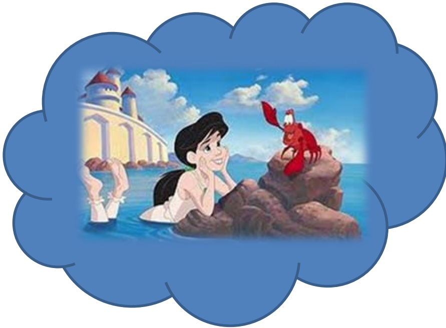
Η αδελφή μου η Αναστασία (Η μικρή γοργόνα 2 της Disney)