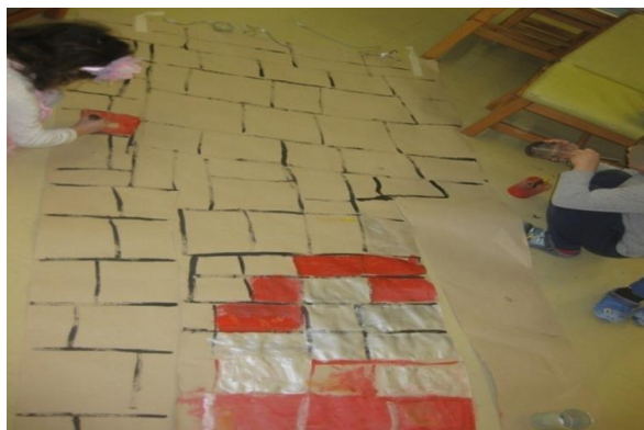
Εικόνα 12 Διακόσμηση με τούβλα