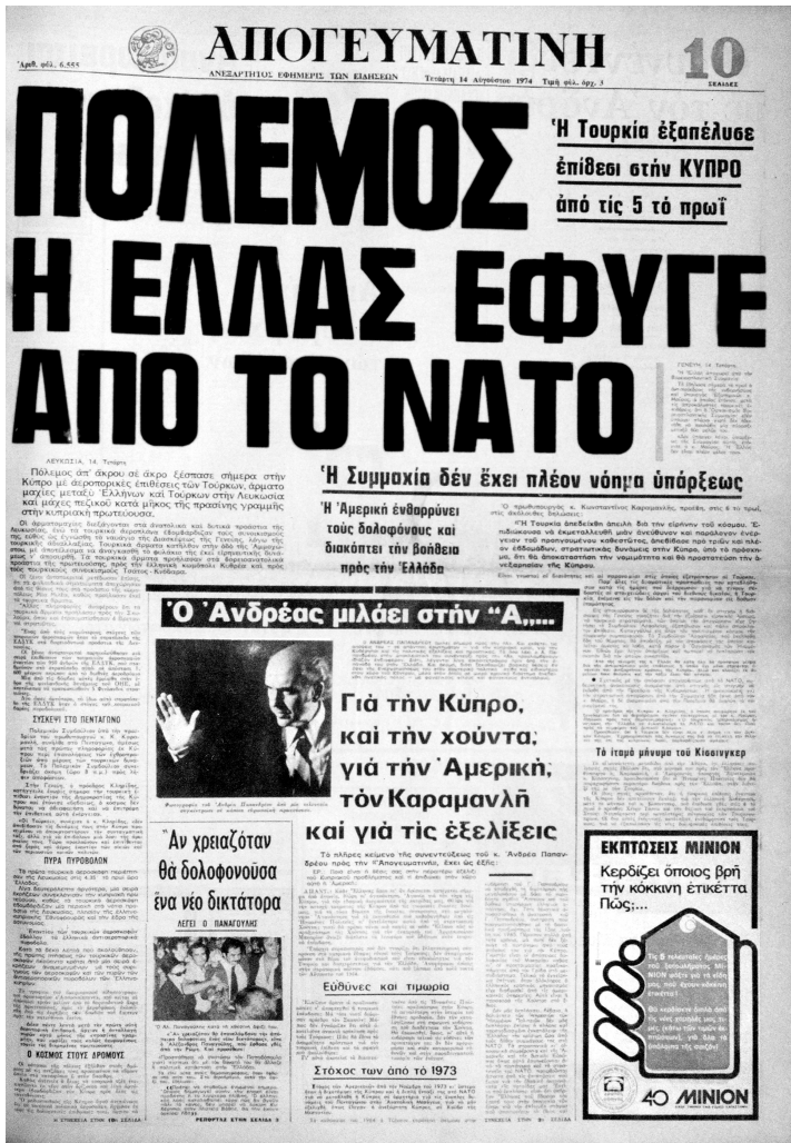
■ ■ Η ανακοίνωση της αποχώρησης της Ελλάδας από το στρατιωτικό σκέλος του ΝΑΤΟ, 14 Αυγούστου 1974.