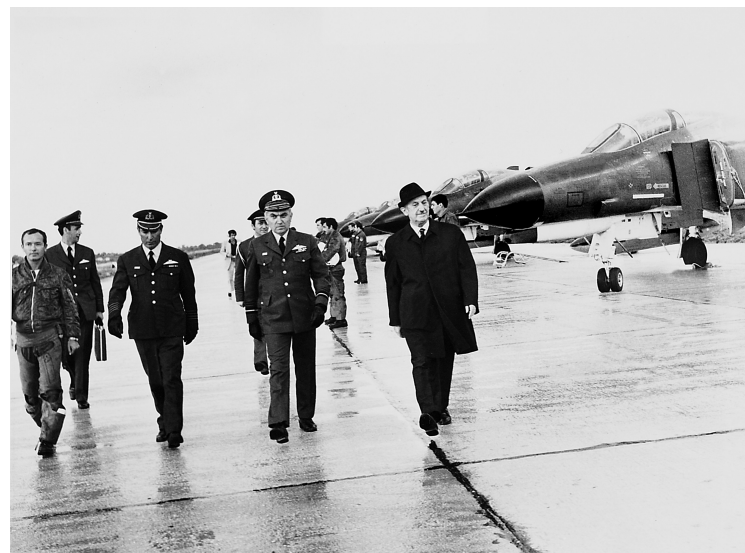
■ ■ Ο Ευάγγελος Αβέρωφ επιθεωρεί μαχητικά αεροσκάφη. Η ενίσχυση των στρατιωτικών δυνατοτήτων της χώρας αποτέλεσε μείζονα προτεραιότητα των κυβερνήσεων της Μεταπολίτευσης.

Τα γεγονότα του Ιουλίου και του Αυγούστου 1974 αποτέλεσαν τραυματική εμπειρία για την Ελλάδα (και βέβαια την Κύπρο) και σηματοδότησαν την απαρχή μιας νέας περιόδου στην ελληνική εξωτερική πολιτική και πολιτική ασφάλειας. Πρώτα από όλα αυξήθηκε κατακόρυφα ο αντιαμερικανισμός της ελληνικής κοινής γνώμης, ενώ καταδείχθηκε σαφώς ότι η συμμαχική σχέση με τις ΗΠΑ και η συμμετοχή στην Ατλαντική Συμμαχία δεν αποτελούσαν πανάκεια για την κατοχύρωση της ασφάλειας της χώρας και των συμφερόντων της. Ακόμη και μετά την πολιτειακή αλλαγή της 24ης Ιουλίου 1974 οι ΗΠΑ τήρησαν πολιτική ίσων αποστάσεων ανάμεσα στην Ελλάδα και την Κύπρο, από τη μια πλευρά, και την Τουρκία από την άλλη, και περιόρισαν τις μεσολαβητικές τους προσπάθειες στην αποτροπή της έκρηξης ενός ελληνοτουρκικού πολέμου. Ιδίως ο ρόλος του υπουργού Εξωτερικών Χένρι Κισινγκερ και του υφυπουργού Εξωτερικών Τζόζεφ Σίσκο ήταν ελάχιστα εποικοδομητικός κατά τη διάρκεια της κυπριακής κρίσης και της τουρκικής εισβολής. Δεύτερον, σταδιακά αναθεωρήθηκε το δόγμα του «από Βορρά κινδύνου», αφού πλέον κατέστη φανερό ότι την κύρια απειλή για την ελληνική ασφάλεια και εδαφική ακεραιότητα αποτελούσε η Τουρκία, εταίρος της Ελλάδας στο ΝΑΤΟ· συνεπώς η ελληνική αμυντική στρατηγική έπρεπε να αναθεωρηθεί αναλόγως, παρότι προφανώς δεν θα συμβάδιζε πλέον με τις ψυχροπολεμικές προτεραιότητες και τον στρατιωτικό σχεδιασμό του ΝΑΤΟ στην ανα-