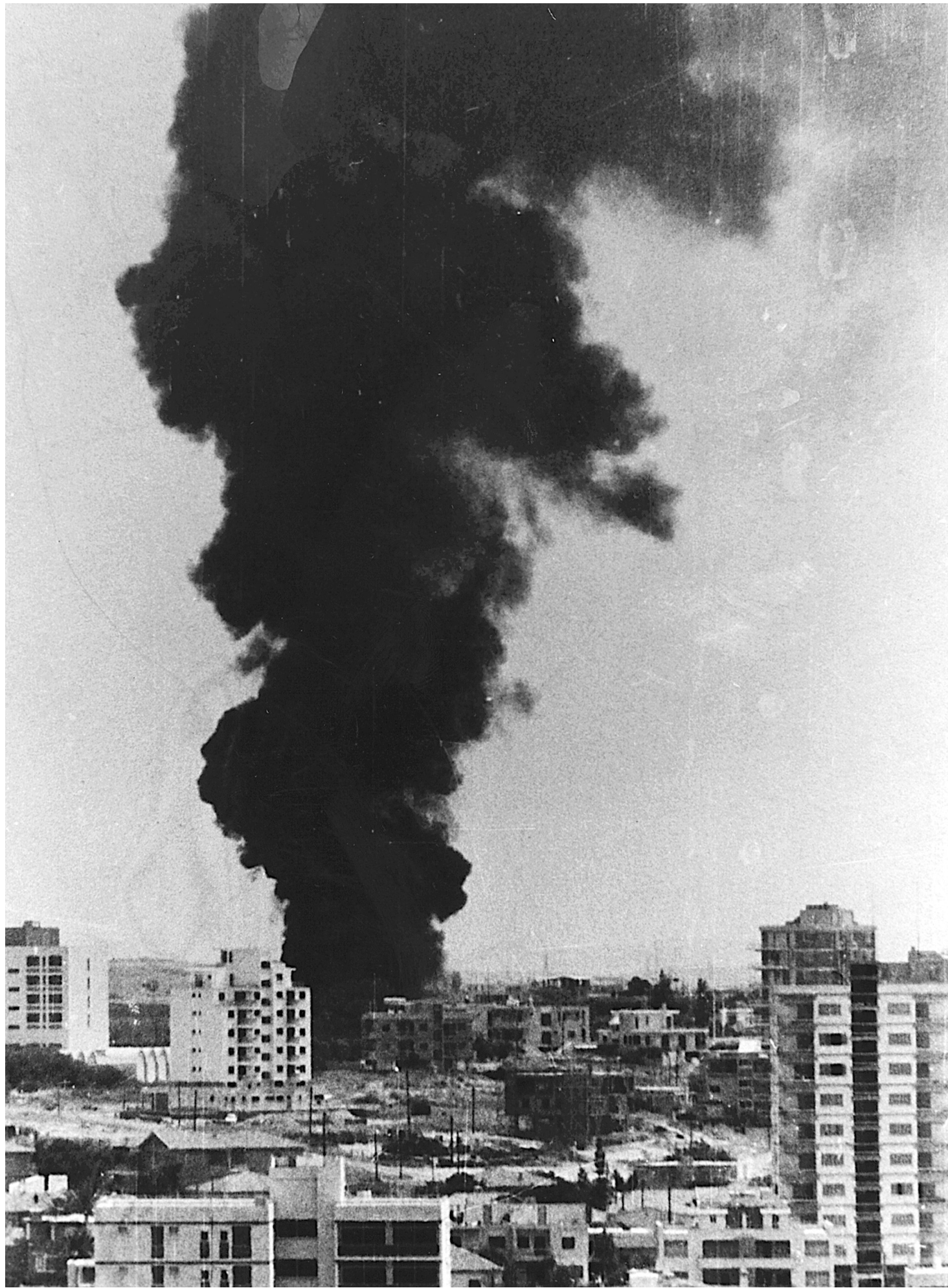
■ Βομβαρδισμός της Αμμοχώστου κατά τον δεύτερο «Αττίλα». Η απραξία της δυτικής Συμμαχίας προκάλεσε την αποχώρηση της Ελλάδας από το στρατιωτικό σκέλος της.