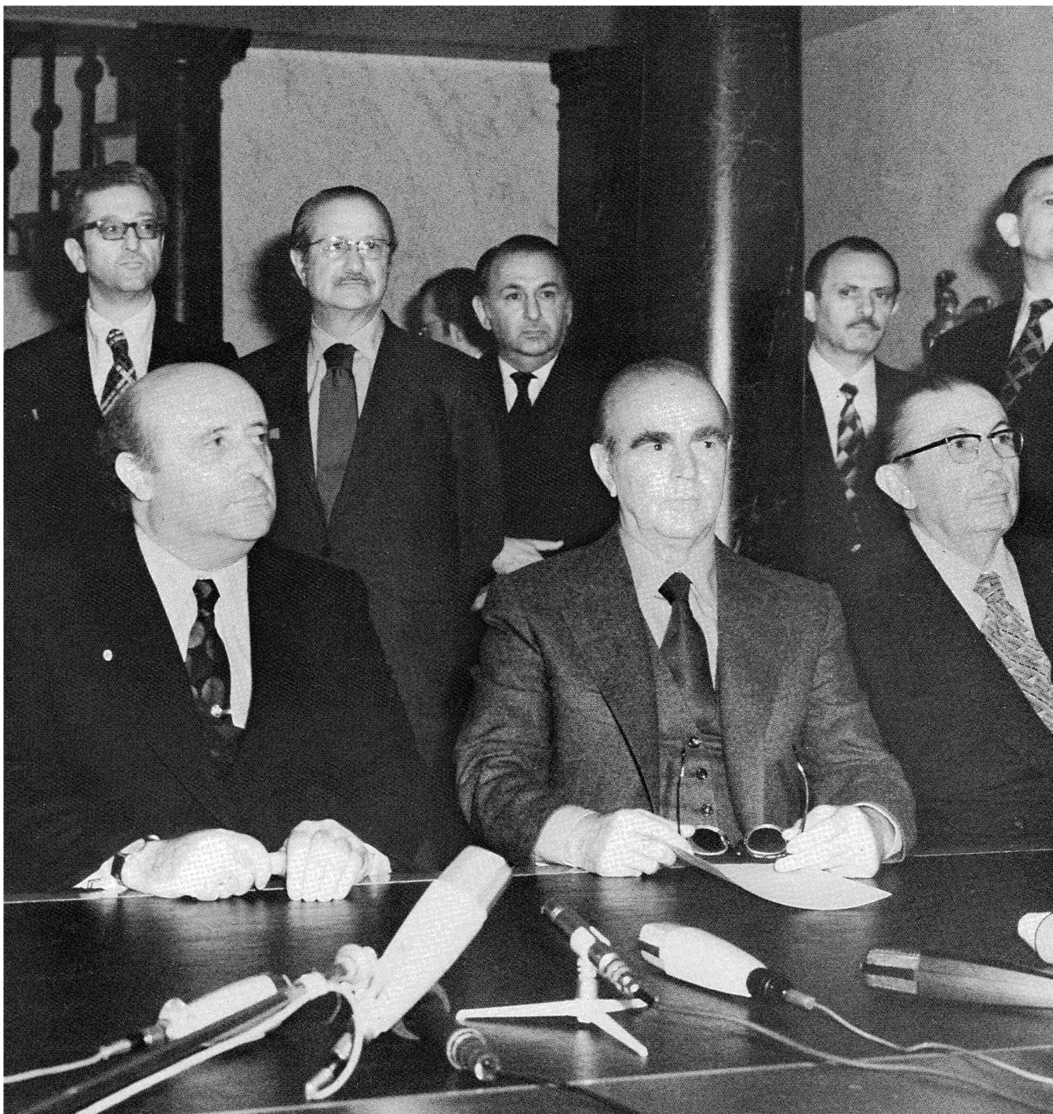
■ ■ Βρυξέλλες, 31 Μαΐου 1975, στο περιθώριο της συνόδου κορυφής του ΝΑΤΟ. Ο Κ. Καραμανλής συναντάται με τον Τούρκο πρωθυπουργό Σουλεϊμάν Ντεμιρέλ και τον υπουργό Εξωτερικών Ιχσάν Σαμπρί Τσαγκαλαγκιλ.

πλαίσιο και ότι ταυτόχρονα δεν θα επέτρεπε τη διεύρυνση της ανισορροπίας ισχύος στον Εβρο και στο Αιγαίο προς όφελος της Τουρκίας. Δηλαδή, μέσω της διατήρησης του δεσμού της με τις ΗΠΑ και το ΝΑΤΟ, η Αθήνα εν τέλει επιδίωκε να πραγματώσει διττό στόχο: να περιφρουρήσει τα ελληνικά κυριαρχικά δικαιώματα στο Αιγαίο έναντι των τουρκικών προκλήσεων και διεκδικήσεων, αλλά να επιτύχει