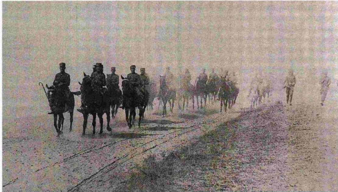
Αύγουστος 1921. Ο ελληνικός στρατός διασχίζει την Αλμυρά Ερημο, στην εκστρατεία προς Αγκυρα, εν μέσω απονικτικού καύσωνα. Το τραύμα και το ερώτημα της ήττας του 1922 παραμένουν ακόμη ανοικτά και δυοίσατα.

Σήμερα υπηρετεί ως αναπληρωτής καθηγητής στο Τμήμα Ιστορίας και Αρχαιολογίας του Εθνικού και Καποδιστριακού Πανεπιστημίου Αθηνών. Έχει γράψει επίσης τα βιβλία: «Εθνοτική συμβίωση στα Βαλκάνια. Έλληνες και Βούλγαροι στη Φιλιππούπολη 1878-1914» (Πατάκη), «Εδαφος και μνήμη στα Βαλκάνια. Ο “γεωργικός εθνικισμός” στην Ελλάδα και στη Βουλγαρία (1927-46)» (Πατάκη), «Το καθεστώς Ιωάννη Μεταξά (1936-1941)» (Βιβλιοπωλείον της Εστίας), «Τα μυστήρια της Αιγυπτίας: Το Μικρασιατικό Ζήτημα στην ελληνική πολιτική, 1891-1922» (Βιβλιοπωλείον της Εστίας), «Μεταξύ επανάστασης και μεταρρυθμίσεων: Ελευθέριος Κ. Βενιζέλος και βενιζελισμός (1909-1922)» (Πατάκη), «Ο ήχος των εν Υδρα: Ο Πόρος κατά την Ελληνική Επανάσταση (1821-1831)» (Παπαδήμα).