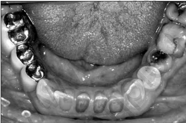
ΕΙΚΟΝΕΣ 3, 4. Λόγω ταχείας αποτριβής, ο πολφός των κάτω προσθίων δοντιών είναι ορατός και συμπτωματικός (συρίγγιο).

Η απώλεια της οδοντικής ουσίας σε αυτή την κατηγορία οφείλεται σε μη φυσιολογική μηχανικής αιτιολογίας αποδόμηση, η οποία εμπεριέχει ξένα αντικείμενα ή ουσίες σε επαφή με τα δόντια. 10 Η κατηγορία αυτή περιλαμβάνει τη λανθασμένη ή υπερβολική χρή-