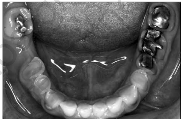
ΕΙΚΟΝΑ 9. Διάβρωση των κάτω δοντιών, στις μαστικές και παρειακές επιφάνειες, που δεν έρχονται σε σύγκλιση με τους ανταγωνιστές.