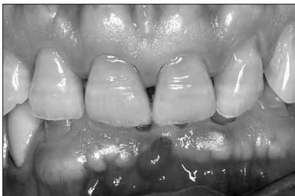
ΕΙΚΟΝΑ 5. Αποτριβή - abrasion στον κεντρικό άνω τομέα, λόγω επανειλημμένης δόξης μολυβιού.

οδηγεί στην ανάπτυξη μεγάλων δυνάμεων στην περιοχή του αυχένα των δοντιών. Χαρακτηριστική είναι η ανάλυση πεπερασμένων στοιχείων των Dejak και συν, 14 η οποία απέδειξε ότι στην περιοχή κοντά στην αδαμαντινο-οστεϊνική ένωση, οι δυνάμεις εφελκυσμού που αναπτύσσονται υπερβαίνουν την αντοχή της αδαμαντίνης και προκαλούν αποκόλληση πρισμάτων.