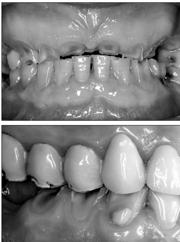
ΕΙΚΟΝΕΣ 10, 11: Οι εμφράξεις αμαλγάματος φαίνονται ως εξογκώματα (outgrowths) δια μέσου των διαβρωμένων οδοντικών ιστών.