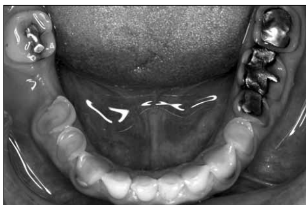
ΕΙΚΟΝΕΣ 6 και 7. Μασπτικές απόψεις ασθενούς με διάβρωση λόγω γαστρο-οισοφαγικής παλινδρόμησης.