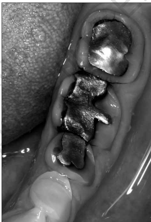
ΕΙΚΟΝΕΣ 1, 2. Αποτριβή - (attrition) στις υπερώιες επιφάνειες των άνω και στις προστομιακές επιφάνειες των κάτω προσθίων δοντιών.

γραμμένες, απαστράπτουσες επιφάνειες επεκτείνονται έξω από την περιοχή των μασπτικών επαφών κατά τη μάσηση, 1-2χιλ από τη μέγιστη συγγόμφωση. 7